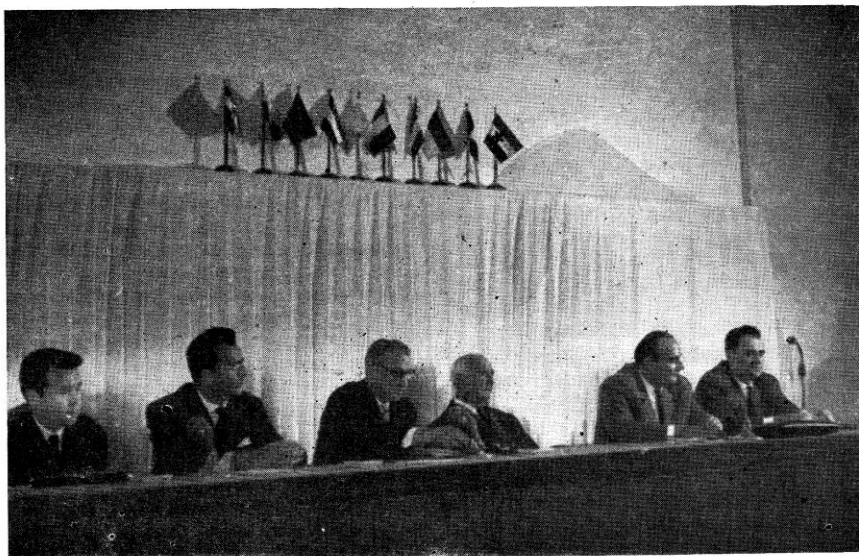
Sl. 1. Radno predsjedništvo simpozija