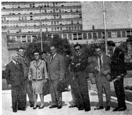
Sl. 2. Grupa učesnika pred Radničkim sveučilištem »Moša Pijade«