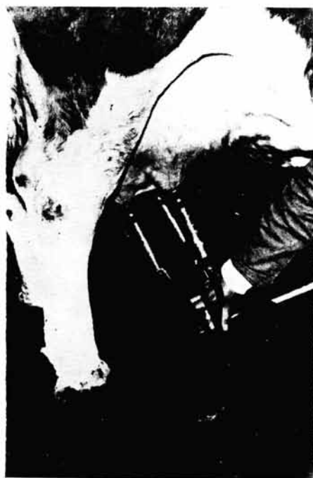
Slika br. 3. — Natezanje sisne garniture u pravcu pružanja sisa

ustanove zaostale količine mleka po četvrtima, nego da se njime iste mogu izmusti. On se izvodi u dva dela, prvo se izmuza strana suprotna onoj sa koje mužač muze kravu, jer je u njima nešto više zaostalog mleka ođ strane sa koje se muze.