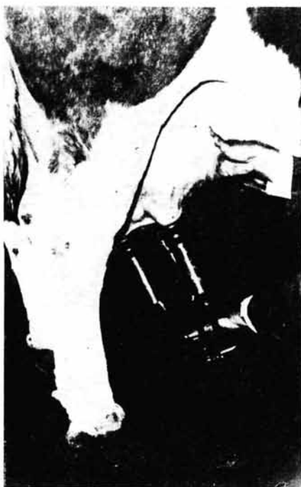
Slika br. 6. — Treći zahvat izmuzanja vimena (izmuzanje prednjih četvrti)

na izmuzanje krave koja je u fazi muže (slika 8). Pripremljena krava uvek čeka stavljanje sisne garniture, često više od dva minuta, što znači za toliko se umanjuje dejstvo oksitocina, odnosno vremenski protok, pa se onemogućuje potpuno izmuzanje vimena, što umanjuje ukupnu mlečnost, a posebno masnoću mleka. Kod primene naše metode muže krava kod radnih organizacija smo za sedam dana rada povećavali masnoću mleka od 0,2 do 0,4% masti za čitav zapat.