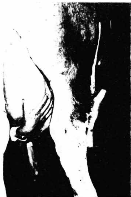
Slika br. 4. — Drugi zahvat izmuzanja vimena (izmuzanje desne zadnje četvrti)