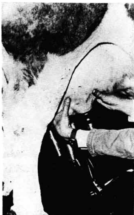
Slika br. 2. — Prvi zahvat izmuzanja vimena (izmuzanje desne strane vimena)