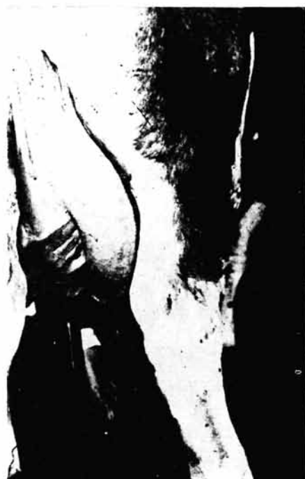
Slika br. 5. — Drugi zahvat izmuzanja vimena (izmuzanje leve zadnje četvrti)

četvrti počinje od stomaka spuštajući se obuhvaćenom četvrti odozgo na dole (slika 6).