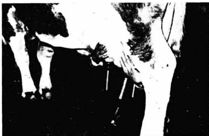
Slika br. 1. — Prvi zahvat izmuzanja vimena (izmuzanje leve strane vimena)

Izmuzanje vimena mora se obavezno obaviti. Nema te krave da je toliko »mekka« i pogodna za mužu, pa da je izmuzanje suviše. Što muža više odmiče koncentracija oksitocina u krvi se smanjuje, a time i pritisak u vimenu. Kao posledica toga, proticanje mleka naglo opada. Brzinu proticanja još više umanjuje visoka masnoća mleka pri kraju muže, te se mast lepi uz tkivo kanala na putu do mlečne cisterne. Ritam peristaltike kanala koji gura mleko do mlečne cisterne je sve slabiji, pa se mora pomoći mlečnoj žlezdi da se sve alveolarne šupljine isprazne i pripremi sav magacinski prostor za sledeću proizvodnju mleka. Ta pomoć se sastoji u masaži vimena i momenat početka masaže odnosno izmuzanja određujemo sa prestankom protoka mleka kroz kontrolna stakla prednjih četvrti. Izmuzanje vimena traži najviše znanja i savesnosti u radu, jer se ono ne sme svesti na obično stezanje i gnječenje pojedinih četvrti. Masaža mora da bude ujednačena i sa određenim pokretima, jer se u protivnom može postići negativan efekat.