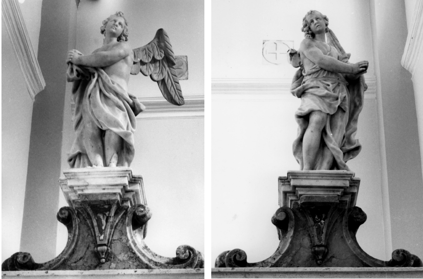
Paolo Callallo, Anđeli, Vodice, župna crkva, glavni oltar

anđela. 2 Cijela konstrukcija nije izvorna: ostaje nejasno je li oltar složen od starih dijelova koji su bili nešto drugačije raspoređeni, ili su neki dijelovi naknadno odnekuda prenijeti i uklopljeni u novu cjelinu. Doduše svetište je sagradio 1725. godine Ivan Skoko, pa nije isključeno da je tada podignut oltar koji je naknadno uklonjen, a na njegovo mjesto postavljen novi nakon što je crkva proširena 1746.-1749. godine. Povezivanje oltara s bočnim vratima u sadašnjem obliku izvedeno je u novije vrijeme. 3