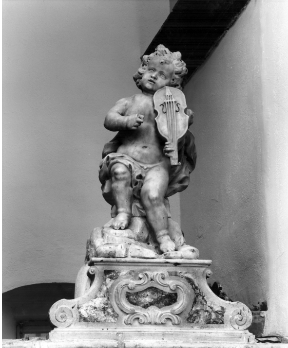
Paolo Callalo, Anđeo, Sutivan (Brač), župna crkva, glavni oltar

Prema tipološkim osobinama i dekorativnim motivima oltar je, vjerojatno, djelo Petra Pavla Bruttapelle. Ali četiri mramorna kipa anđelčića nisu Bruttepelleov rad: oni su daleko kvalitetniji nego kipovi koje je on klesao u svojoj radionici i koji se nalaze na svetohraništu u sutivanskoj župnoj crkvi. Oni su, vjerojatno kupljeni u Veneciji, upravo nakon izgradnje oltara, gdje su, nakon pada Republike 1797. godine brojne umjetnine iz ukinutih i zatvorenih crkava povoljno prodavane. 9 Kipovi se mogu datirati oko 1700. godine, a pokazuju izravne sličnosti s istoimenim djelima Paola Callala. Usporedio bih sutivanska djela s kipovima anđela koje je Callalo izradio na podnožju kipa Boga Oca (Este, Santa Maria delle Grazie, glavni oltar), potom s anđeoskim glavicama na podnožju Kristova kipa u župnoj crkvi Rođenja Blažene Djevice Marije u Labinu. Posebnu vrijednost imaju usporedbe s kipovima anđelčića u Hrenovicama (crkva sv. Martina, svetište), Veneciji (S. Stae, oltar sv. Osvalda), te na oltaru u crkvi S. Maria della Salute u Este. 10