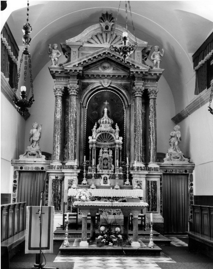
Sutivan (Brač), župna crkva, glavni oltar

Slična je povijest izgradnje glavnoga oltara u župnoj crkvi Uznesenja Blažene Djevice Marije u Sutivanu na otoku Braču. Tamošnji oltar pripada tipskoj skupini žrtvenika u formi slavoluka kakve je radio arhitekt Giorgio Massari. Prema istraživanju Andre Jutronića radovi na podizanju oltara zabilježeni su 1761., 1763. i 1766. godine. Neimenovani majstor dobio je 250 lira 1761., majstor Giovanni