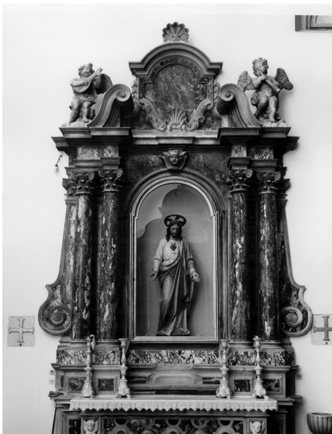
Sutivan (Brač), župna crkva, oltar Srca Isusova

U renesansnoj crkvi Bezgrješnog začeća Blažene Djevice Marije franjevac glagoljaša u Glavotoku na otoku Krku podignuta su u 18. stoljeću tri mramorna oltara. Glavni oltar postavljen je, kao i u prethodno spomenutim crkvama u Vodicama i Sutivanu, po sredini svetišta. Sastavljen je od pravokutnog stipesa i retabla s atikom. Na sredini antependija umetnut je okrugli medaljon s prikazom Bezgrješne u plitkom reljefu. Retabl je razdijeljen dvama stupovima u tri dijela, kako bi se na njemu izložio stariji, oslikani triptih. U sredini je najveće polje s prikazom Bogorodice Bezgrješnoga Začeća, a sa strana manja polja s likovima sv. Frane Asiškoga i sv. Bonaventure. Ispred središnje slike umetnuto je mramorno sveto-hranište u obliku maloga, višestranog hrama s mjedanim vratnicama iznad kojih su dvije mramorne anđeoske glavice. Stupovi nose gređe i atiku koja u središnjem dijelu ima ovalni reljef golubice Duha Svetoga. Sa strane oltara vrata povezuju redovnički kor s crkvom. Na njihovim nadvratnicima plitke su volute i kipovi anđela. Mramorni žrtvenik ispunja svetište crkve po širini i visini. Zanimljiv podatak o oltaru zabilježio je o. Stjepan Ivančić 1910. godine, prenoseći da je „obće-