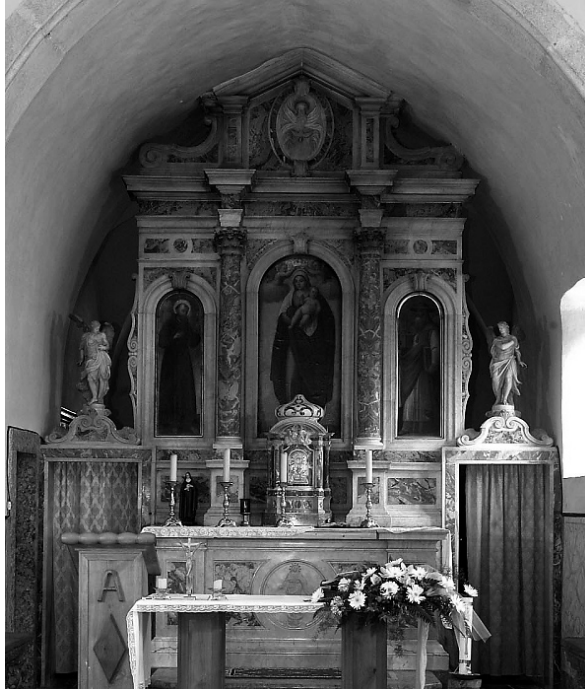
Glavotok (Krk), franjevačka crkva, glavni oltar

Slike su izvorno mogle stajati na drvenom oltaru koji je redovnicima u 18. stoljeću mogao izgledati zastarjelo, zapušteno i bezvrijedno, pa su ga odlučili zamijeniti novim, izvedenim u skupocjenom mramoru. U to su vrijeme podigli i dva bočna oltara u crkvi. Sjeverni oltar posvećen je sv. Anti Padovanskom, a južni sv. Jakovu Apostolu. Ugovor za njihovu izgradnju potpisan je 1758. godine. Oltar sv. Antuna djelo je mletačkoga majstora Giuseppea Bissona, koji ga je dovršio 1760. godine za 503 dukata. Tolika je bila i cijena oltara sv. Jakova koji je dovršen 1761. godine. Na njemu su mramorni reljefi Bogorodice s Djetetom, sv. Jakov, sv. Ljudevit Tuluški i sv. Elizabeta Ugarska. 13