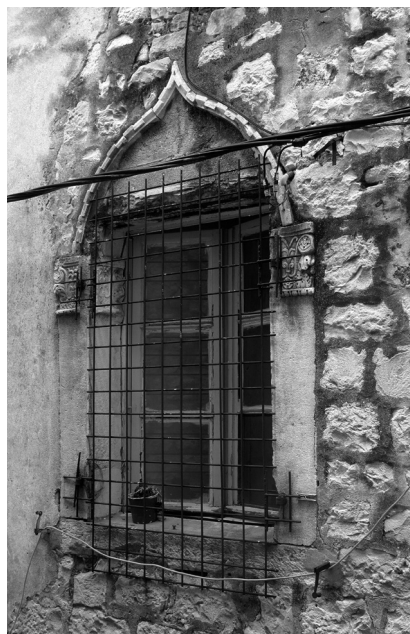
Split, gotička monofora u Kružičevoj ulici