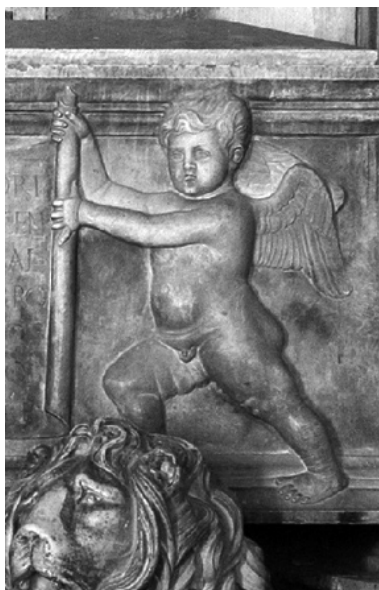
Nikola Firentinac, putto na kaminu obitelji Grisogono u Splitu i na Sobotinoj grobnici u Trogiru