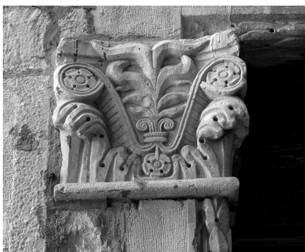
Split, kapitel portala palače Grisogono