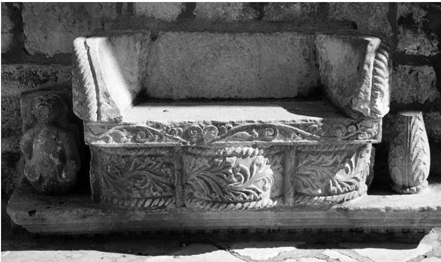
Korčula, fragmenti kamina presloženi u klupu pred župnom kućom

i arhitravom nosio zid nad sobom bez lunete i atike. Čipikov bi portal stoga imao dvije faze. Sagrađen, 1457. godine od lokalnih majstora bliskih krugu Andrije Alešija, te dograđen 1470. godine Firentinčevom atikom na kojoj štiti grba drže lavovi, a iz okulusa proviruju anđeli s kartušama u rukama na kojima je ispisan latinski prevod teksta koji je prema predaji krasio pročelje Apolonova hrama - NOSCE TE IPSUM. Firentinac se trudio uklopiti svoj dodatak portalu preciznim umetanjem tankog profiliranog okvira oko cijele kompozicije, prateći istom vrpcom stare i nove djelove portala. Radi se dakle o dvije Koriolanove obnove