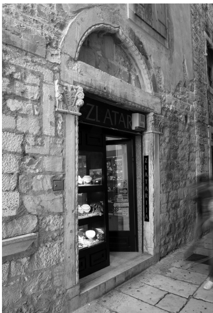
Split, gotički portal na palači Grisogono