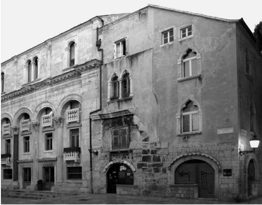
Palača Cipci i palača Grisogono na Peristilu u Splitu

majstora već u prosincu iste godine krenuli na Tremite gdje su na augustinskoj crkvi sv. Marije radili kroz cijelu 1473. godinu. 15