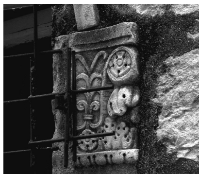
Split, kapitel monofore u Kružičevoj ulici

nja palače Grisogono. Od Firentinčevih ostvarenja na palači Grisogono ostao je samo portal u prizemlju istočnog, starijeg krila, koje nije srušeno. Taj je raniji portal preoblikovan umetanjem kapitela i dekoracijom gotičkog baštuna lovorovim lišćem izrezanim u plitkom reljefu, istim motivom kojim se Nikola često služio, kao što se može vidjeti primjerice na sjevernim vratima trogirске crkve sv. Petra. Kapiteli s motivima karakterističnim za Firentinčev opus postoje na palačama splitskih humanista. Grisogonov kamin, na kojemu je prepoznata ruka Nikole Firentinca, novi je prilog za majstorov opus u Splitu, a dodatno potkrepljuje ranije teze o postojanju Firentinčeve splitske radionice na koju je među ostalima i Cvito