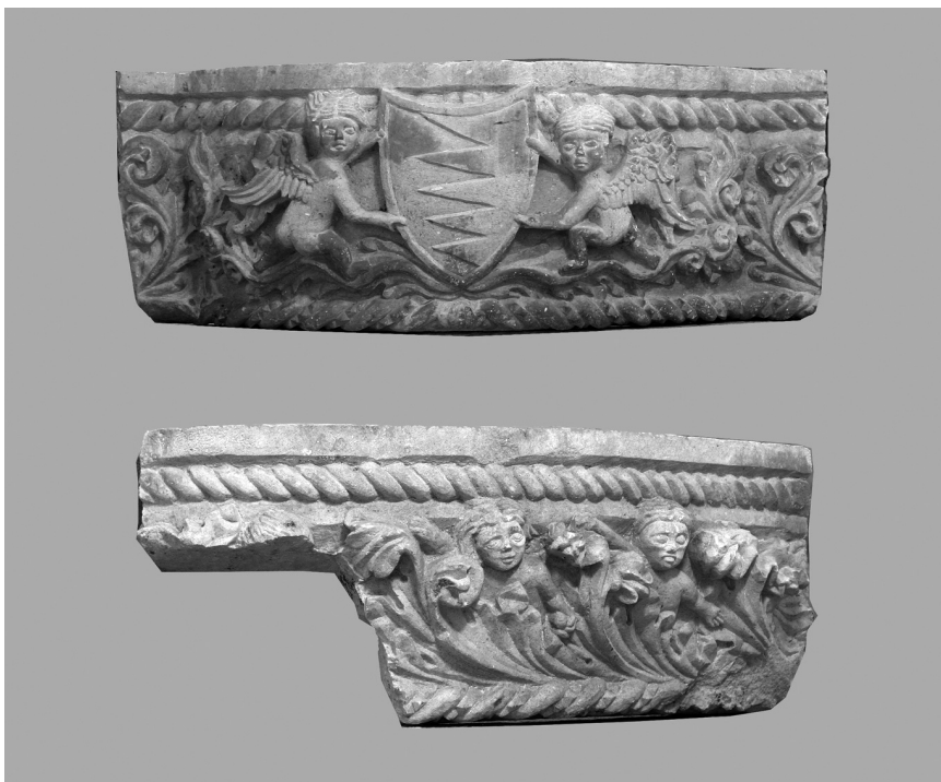
Trogir, fragmenti gotičkog kamina s Čipikovim grbom

freskama ili rezbarijama kao nape ranorenesansnih dubrovačkih kamina koje je iz arhivskih dokumenata proučavao Cvito Fisković. 9 Napa Čipikovog kamina mogla je biti od dekoriranih kamenih ploča u obliku plašta stožca trilobne osnove, što se vidi iz tragova željeznih spona kojima su bile pričvršćene za gredu. Nadvoj sličnog kamina sačuvan je uzidan pred župnom kućom na katedralnom trgu Korčule. Prislonjen je uz zid kao klupa za sjedenje, zajedno s još nekoliko kamenih ulomaka od kojih još neki mogu biti djelovi istog kamina. Dekoriran je povišenim akantusovim listovima isklesanim u poljima između tordiranih štapova, karakterističnih dekorativnih elemenata kasnogotičkog stila. Kamin je, za razliku od trogirskog, bez grba i pripadao je vjerojatno korčulanskoj građanskoj kući. Nadvoj je isklesan iz jednog komada kamena, a florealna dekoracija je skromnije kvalitete. Kamini takvog oblika mogu se naći u opremi unutrašnjosti venecijanskih palača polovicom 15. stoljeća. 10