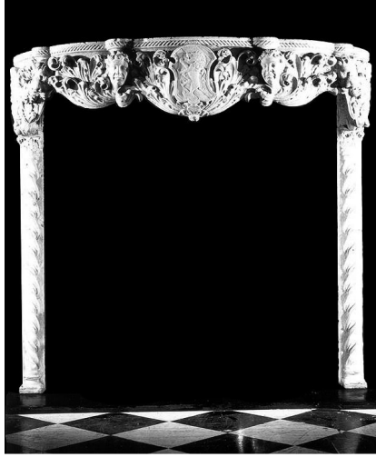
Kamin s grbom Contarini

i arhitravom nosio zid nad sobom bez lunete i atike. Čipikov bi portal stoga imao dvije faze. Sagrađen, 1457. godine od lokalnih majstora bliskih krugu Andrije Alešija, te dograđen 1470. godine Firentinčevom atikom na kojoj štiti grba drže lavovi, a iz okulusa proviruju anđeli s kartušama u rukama na kojima je ispisan latinski prevod teksta koji je prema predaji krasio pročelje Apolonova hrama - NOSCE TE IPSUM. Firentinac se trudio uklopiti svoj dodatak portalu preciznim umetanjem tankog profiliranog okvira oko cijele kompozicije, prateći istom vrpcom stare i nove djelove portala. Radi se dakle o dvije Koriolanove obnove