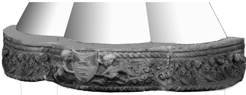
Trogir, kamin iz palače Ćipiko s rekonstrukcijom nape

roditeljske palače provedene u kratkom periodu - prvoj koja je, završena 1457. godine, ovjenčana spomenutim natpisom i drugoj koju je sedamdesetih godina proveo Nikola Firentinac u sklopu uređenja glavnoga gradskog trga. 11