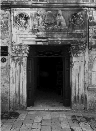
Nikola Firentinac, portal Velike palače Ćipiko u Trogiru