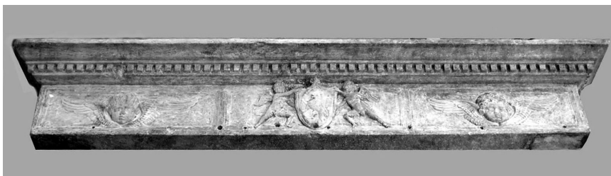
Nikola Firentinac, greda kamina s grbom obitelji Grisogono u Splitu (Muzej grada Splita)

Fisković je donio nacрте ranorenesansnog kamina iz trogirске palače Andreis na kojima vidi utjecaj Nikole Firentinca i toskanske renesanse koju taj majstor donosi u Dalmaciju 15. stoljeća. Fisković opisuje ruševine kamina kojima su sačuvane podvostručene konzole okićene svinutim reljefnim listovima i cvijetom, naglašavajući široke, profilirane grede njihovih nadvoja kojima su sačuvani samo bočni komadi. Izgubljene, čeone grede, u sredini su nesumnjivo imale Andreisov grb poput drugih trogirskih i kaštelanskih primjera 16. stoljeća koji se u tekstu navode. Nastavljajući se na temu spomenutog Fiskovićevog teksta, u ovom se radu donosi nekoliko primjera kamina 15. stoljeća, na kojima se vidi promjena oblikovanja kamina kasnogotičkog sloga u novi, renesansni, kojega će početkom 16. stoljeća korčulanski graditelj u ugovoru za izradu nazivati alla fiorentina . 5