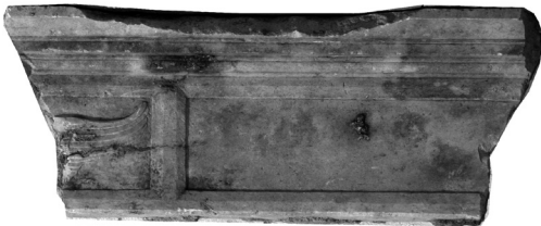
Nikola Firentinac, ulomci Ćipikova kamina s krilatim grbom

Lavlje glave s konzola splitskog kamina, raskoračeni putti okruglastih trbuha koji drže štit, glavice anđela s krilima, motivi su koji jednakim redosljedom krase grobnicu Ivana i Šimuna Sobote podignutu 1469. godine u samostanskoj crkvi trogirskih dominikanaca. 7 Rješenja u prikazu lavljih ralja, očiju, grive, ušiju i čela na Sobotinoj grobnici, ponavljaju se na konzolama splitskog kamina s jedinom razlikom u mjerilu. Ručice anđela s raširenim malim prstom, njihove glavice i frizure ukazuju na to da je skulptor oba kamina ujedno graditelj Sobotine grobnice, Nikola Ivanov Firentinac, najznačajniji kipar i arhitekt Trogira druge polovine 15. stoljeća. Firentinac je u kratkom razdoblju svog života djelovao u Splitu između 1470. i 1474. godine. Trogirski opus Firentinca znatno je bolje poznat od splitskog. Na Ćipikovim palačama radio je Nikola od dolaska u Trogir u siječnju 1468. do 1470. godine, kada je Koriolan Ćipiko napustio Trogir, priključivši se kao zapovjednik trogirске trireme ratnim operacijama protiv Turaka u Maloj Aziji. Kako je poznato, u tom razdoblju nastaju zahvati na velikoj i maloj Ćipikovoj palači, građevinama koje su definirale zapadno pročelje glavnog trogirskog trga. 8