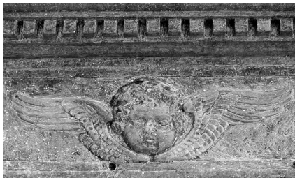
Nikola Firentinac, detalj arhitrava i konzole splitskog kamina