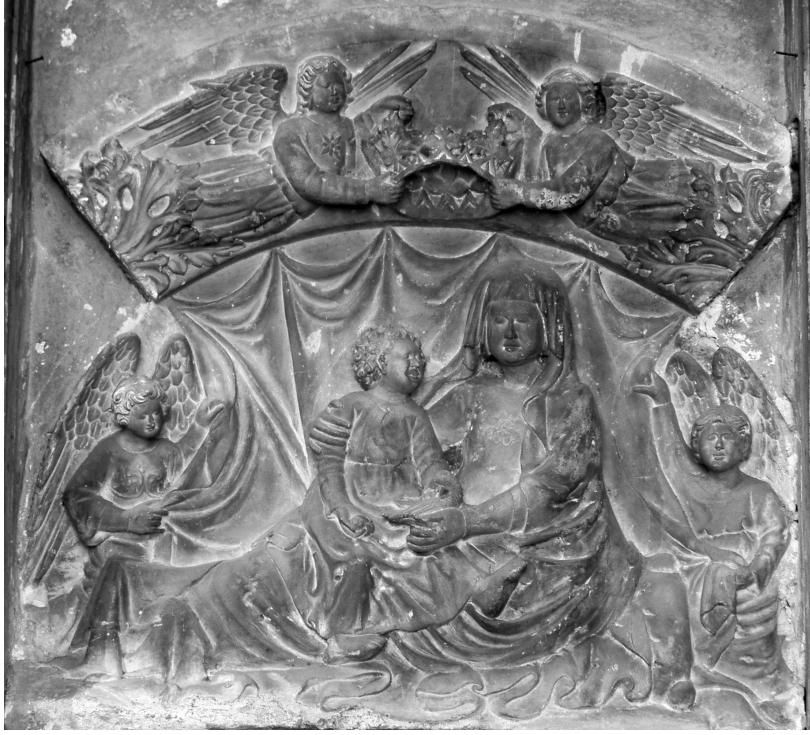
Pavao Vanucijev iz Sulmone, Reljef sv. Ane s malom Bogorodicom, Zadar, crkva sv. Krševana.

konačnoj obradi trebao predstavljati. Ipak, izgleda da je to trebala biti knjiga. Prsti ruke koji pridržavaju knjigu izrazito su predimenzionirani i u osnovi dosta nespretno izrađeni.