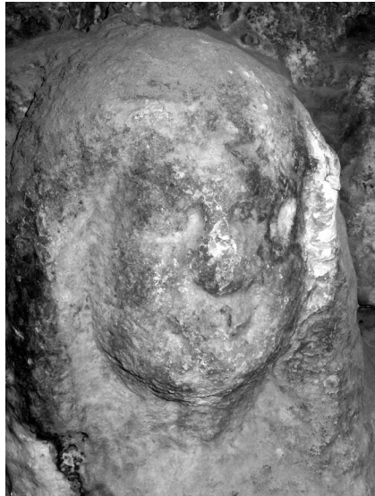
Pavao Vanucijev iz Sulmone, Reljef Bogorodice iz Navještenja (detalj).

Lik Bogorodice iz zvonika crkve sv. Krševana moguće je usporediti s još nekim djelima Pavla iz Sulmone. Opći izgled, poza, pa i tretman volumena pokazuju sličnost s likom sv. Marka evanđelista na nadgrobnoj ploči zadarskog nadbiskupa Matafara, koju je Pavao izveo prema nacrtu slikara Menegela Ivanova