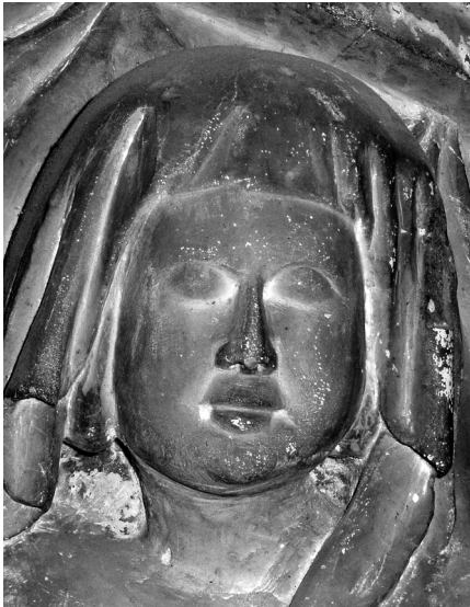
Pavao Vanucijev iz Sulmone, Reljef sv. Ane s malom Bogorodicom (detalj).

Sličnosti se očituju u cjelokupnoj formi lica, naglašenom volumenu marame, načinu na koji su oči i usne »utopljene« u plohu lica, te gotovo identično realiziranim lukovima obrva i načinu na koji se na njih nastavlja volumen nosa, te osobito tretmanu obraza, koji je i inače izrazito karakterističan za gotovo sve likove Pavla iz Sulmone, a u ovom slučaju praktički identičan.