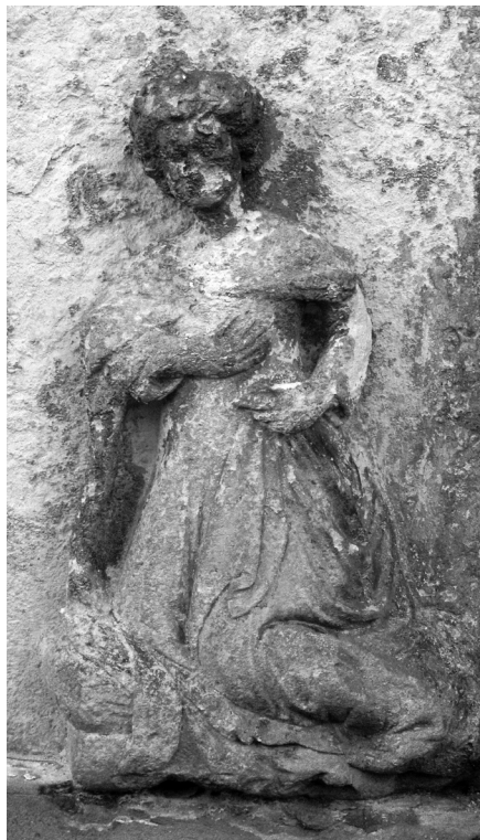
Pavao Vanucijev iz Sulmone, Reljef s prikazom sv. Šimuna i kraljice Elizabete (detalj), Zadar, Narodni muzej.

de Canali, 23 a djelomično i s likom anđela bakljonoše na grobnom spomeniku biskupa de Cardinalibus u crkvi sv. Marije u Senju. 24 Predimenzionirana šaka s nespretno definiranim prstima opće je mjesto Pavlovih figura, posebno uočljivo na oba reljefa Oplakivanja , na liku kraljice Elizabete na ploči u Narodnom muzeju u Zadru, 25 pa i na navedenom reljefu sv. Ane s malom Bogorodicom.