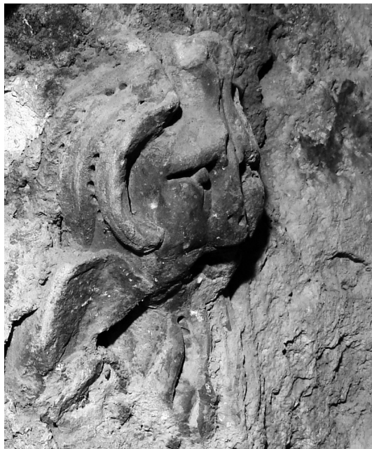
Nikola Firentinac, Lavlje poprse, Zadar, zvonik crkve sv. Krševana