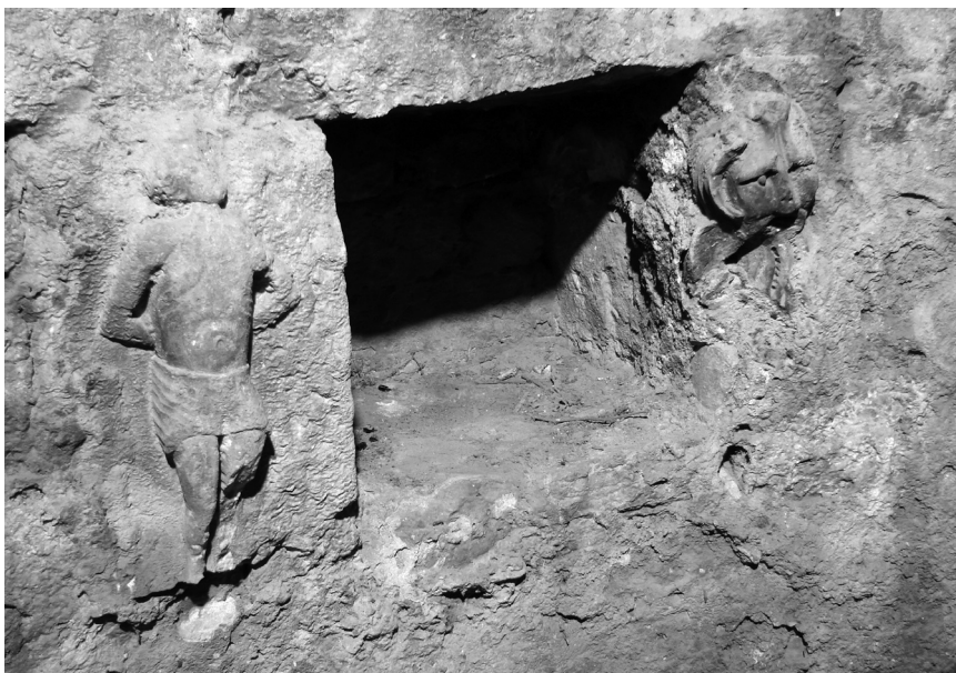
Niša s uzidanim fragmentima skulptura sv. Sebastijana i konzole s lavljim poprsjem, Zadar, zvonik crkve sv. Krševana

donjem se dijelu, ispod slomljene čeljusti, naziru dugi pramenovi grive također oblikovani dubokim urezima. Naglasak povijene linije prednjih bočnih pramenova glave u dinamičnom je odnosu s volumenom obraza i dubokim sjenama očnih ureza. Linije stražnjih bočnih pramenova, kao i one pramenova grive na prsima svojevrsna su jeka temeljnih naglasaka skulpture sadržanih u odnosu volumena prednjih pramenova grive, obraza i očnih duplji.