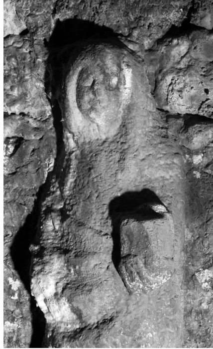
Pavao Vanucijev iz Sulmone, Reljef Bogorodice iz Navještenja, Zadar, zvonik crkve sv. Krševana.

cjelokupna draperija djeluje glomazno i teško, to jest sadrži puno više volumena nego bi to bio slučaj kod dovršenog djela. To je osobito uočljivo na marami koja uokviruje glavu u jednoj očito predimenzioniranoj formi. Lice je jedini dio kipa koji je bio dovršen (ili gotovo dovršen). 19 Nažalost, tijekom kasnijeg vremena znatno je oštećeno, pa niti ono ne omogućuje pouzdaniji sud o vještini majstora. Ipak, moguće je uočiti neke specifične odlike. U pitanju je dosta široko lice izrazito punih obraza, ali ipak relativno plitko, s razmjerno sitnim i ponešto nespretno definiranim usnicama te naglašenim lukovima obrva pod kojima su istaknute bademaste oči. Nos, koji se direktno nastavlja na linije obrva, jako je oštećen, ali izgleda da je izvorno bio dosta pravilan. Ukupni stav čitavog lika otkriva tek naznačen karakteristični gotički kontrapost, koji je vjerojatno u konačnoj obradi trebao nešto jače doći do izražaja. Desna ruka prislonjena je uz tijelo i praktički se potpuno gubi u amorfnoj neobrađenoj kamenoj masi. 20 U lijevoj ruci lik drži neki dosta masivan pravokutni blok, za koji je teško sa sigurnošću reći što je u