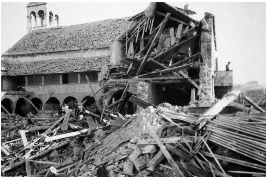
Dominikanski samostan nakon bombardiranja u Drugom svjetskom ratu