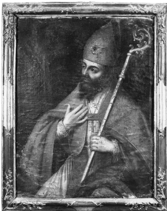
Nepoznati slikar, Bl. Augustin Kažotić

U čast prvoga hrvatskog blaženika razni drugi članovi trogirskog samostana, kako iz same plemićke obitelji Kažotića, tako i drugih, uzimali su to ime. Tako se krajem XIV. st. spominje jedan Augustin kojega je 1394. vrhovni starješina reda Rajmund De Vineis iz Capue imenovao komesarom samostana klauzurnih sestara sv. Dimitrija u Zadru davši mu vlast veću od provincijalove, a zatim mu 1396. za zasluge podijelio posebne povlastice. 89