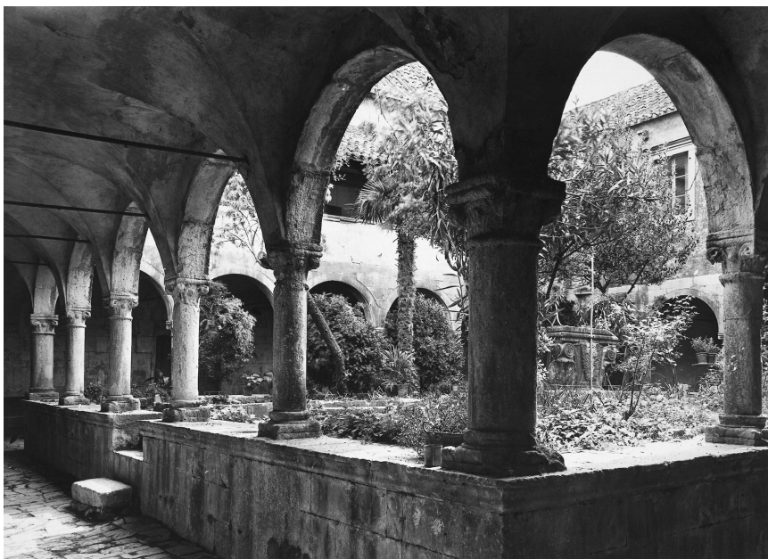
Klaustar dominikanskog samostana u Trogiru (poč. XX. st.)

žine 21 m nose 6 lukova, a zapadni i istočni od 18 m od 5 lukova nose na sebi prostranu teracu bez ograde. U sredini je zdenac s lijepo isklesanim kruništem. Građen je u ranogotičkom slogu u kojem se primjećuju elementi kasne romanike, što govori u prilog činjenici da je sagrađen oko 1300. godine. 67 Sa zapadne strane omanji je vrt za uzgoj povrća. Samostanski trijem (klaustar) sa sjeverne i zapadne strane graniči s vrtom (49 x 22,50 m) okruženim zidom. S južne strane samostan je u prošlosti graničio s gradskim zidinama. S istočne strane samostan s crkvom, u dužini od 32,70 m, graniči s ulicom.