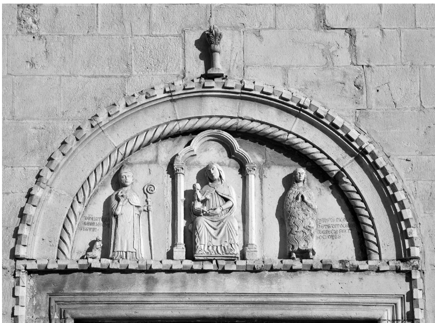
Nikola Dente, Luneta glavnog portala, oko 1372. g.

Južni ulaz je, za razliku od zapadnoga, jednostavan, bez ikakve plastike i ukrasa. To je vjerojatno zato što su se nalazila neposredno uz južni gradski zid koji nije dopuštao pogled iz daljnje perspektive, pa su imala samo funkcionalnu, a ne dekorativnu ulogu.