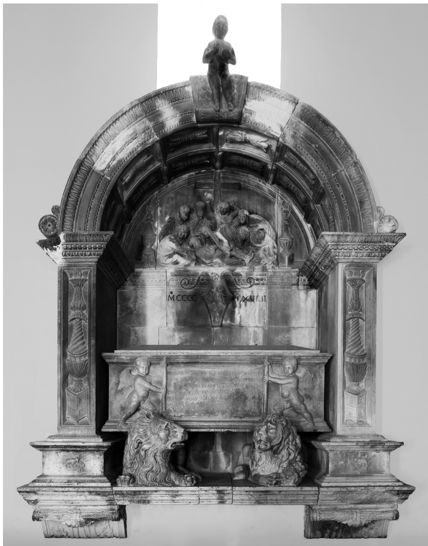
Nikola Firentinac, Grobnica obitelji Sobota, 1468. g.

okvirom, 53,5 x 63 cm) iz XVIII. st.; Sv. Dominik (ulje na bakrenom limu, s drvenim izrezbarenim i pozlaćenim okvirom, 41,5 x 35 cm) iz XVIII. st.; druga slika istog sadržaja (ulje na platnu, 65 x 52 cm) iz istog razdoblja; Sv. Marko (oval, tempera na staklu, s drvenim pozlaćenim okvirom, 41,5 x 38 cm) iz XVIII. st.; Pietà (tempera na drvu, s drvenim okvirom, 54 x 50 cm) iz početka XVII. st.; 5 zavjetnih slika s raznim motivima (ulje na drvu, 21 x 28 cm); Bogorodica s Isusom i sv. Ivanom Krstiteljem (oval, ulje na platnu, s drvenim izrezbarenim pozlaćenim i polikromiranim okvirom, 118 x 98,5 cm), iz XVII. st.; Gospa Žalosna (oval, ulje