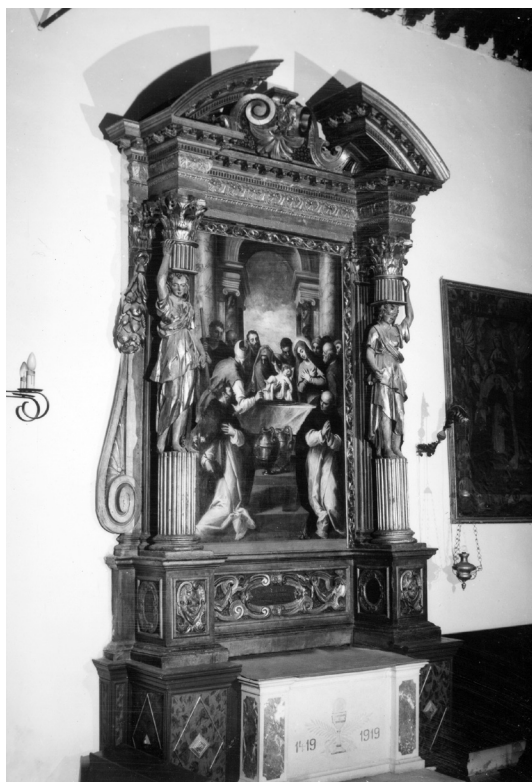
Oltar Imena Isusova sa palom "Obrezanje Kristovo" Jacopa Palme Mlađega

G. 1912. postavljen je novi oltar Gospe od Žalosti ispred monumentalnog nadgrobnog spomenika dvojici tragično poginule braće Sobota, djela poznatoga renesansnog majstora Nikole Firentinca iz 1469. godine. U luneti oltara izrađeno je Oplakivanje Krista ( Pietà ), a na konzolama stoje dva snažna lava nad kojima je sarkofag na čijoj prednjoj strani dva anđela podržavaju svitak s natpisom. Jedan lav simbolizira tužnu rezignaciju, a drugi osvetu. Sačuvani natpis glasi: