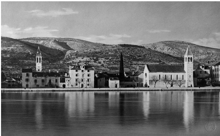
Pogled na crkvu i samostan sv. Dominika u Trogiru (nakon 1910. god.)

će propovjednika (lat. Ordo Fratrum Praedicatorum ). Prvenstveno polje njegove djelatnosti bile su urbane sredine u kojima se u srednjem vijeku odvijao sav, ili gotovo sav, društveni život. Njegovi su članovi duhovno i intelektualno morali prednjačiti ostalom kleru i stanovništvu, a materijalno biti primjer skromnosti, jednostavnosti i ozbiljnosti. Oni, načelno, nisu smjeli naplaćivati svoje duhovne i intelektualne usluge, nego živjeti od onoga što im ljudi daju dobrovoljno, što je osnovna oznaka prosjačkih crkvenih redova, niti su se smjeli povoditi za materijalnim dobrima osim u onoj mjeri koja im omogućava skroman, ali doličan život. Njihovo dragovoljno siromaštvo ( paupertas voluntaria ) kao članova prosjačkog reda nije bio samo način da se oslobodi od vremenitih briga i neizbježnih veza s političkim i gospodarskim strukturama vlasti, nego privilegiran način svjedočenja životom za evanđeoske i kršćanske vrjednote. Taj se stil života morao odražavati kako u gradnji crkava i samostana, tako i njihovu inventaru, odijevanju itd. 2