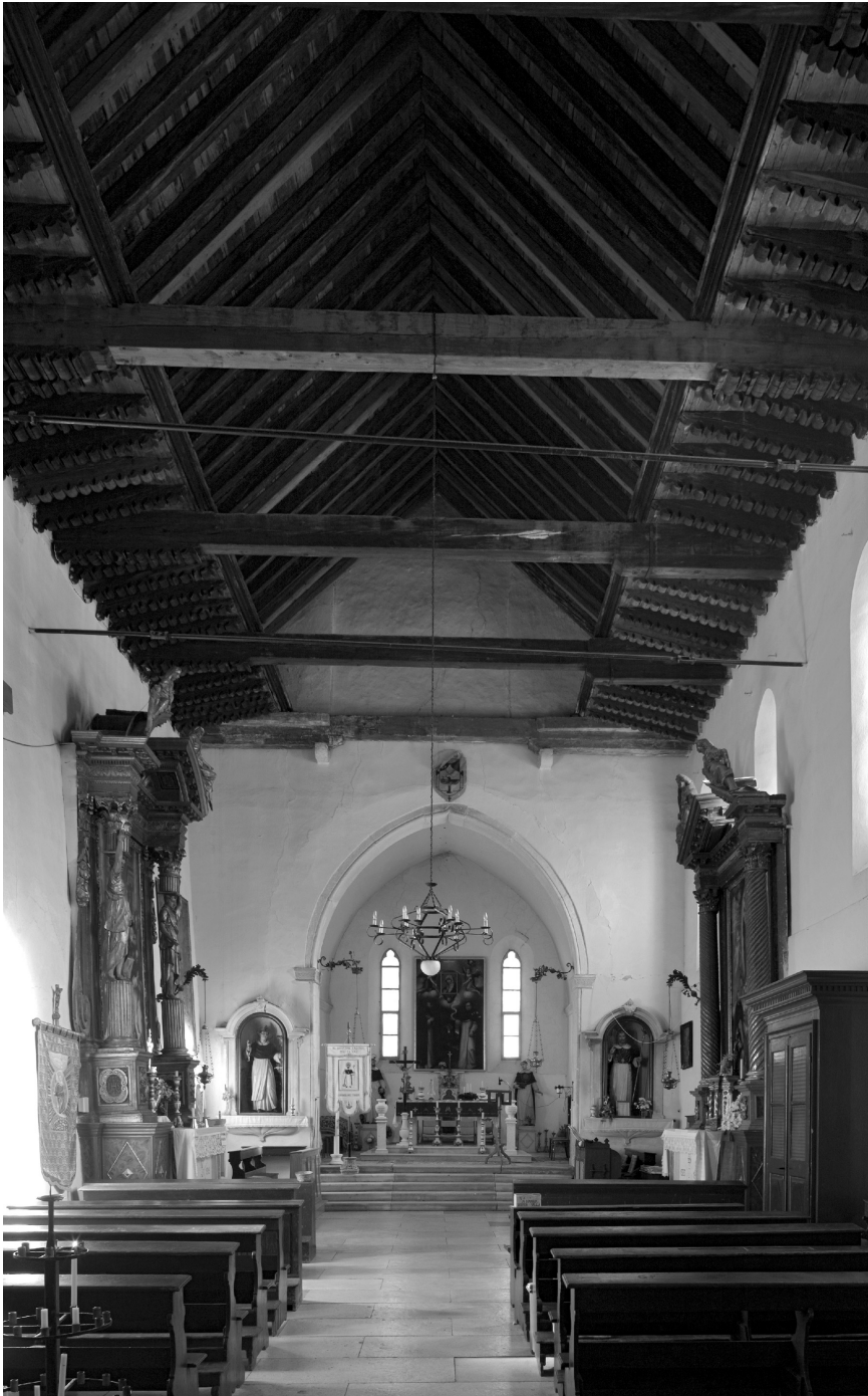
Unutrašnjost crkve sv. Dominika u Trogiru