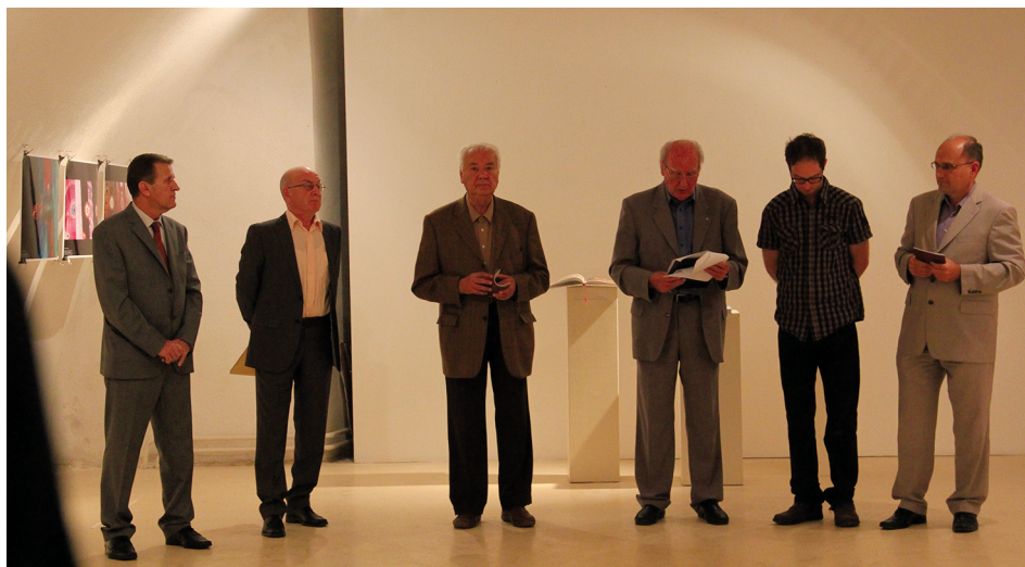
Otvaranje izložbe Tri katedrale u Galeriji Kazamat