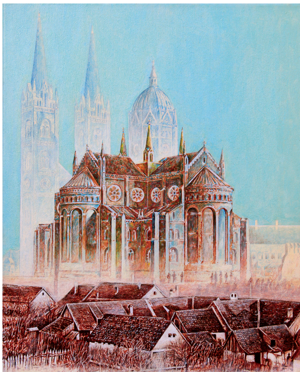
20. ĐAKOVAČKA KATEDRALA SV. PETRA, 2011. Slikarsko filtriranje foto-memorije iz 1981. g. Ulje na platnu; 40 x 50 cm.