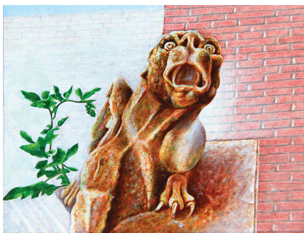
33. KONKATEDRALNI GARGULJ 2, 2011. Fraktalizacija foto memorije. Ulje na platnu; 30 x 24 cm.