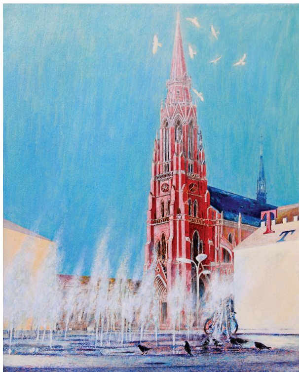
18. OSJEČKA KONKATEDRALA SV. PETRA I PAVLA, 2011. Dekolažirana slikarska memorija. Ulje na platnu; 40 x 50 cm.