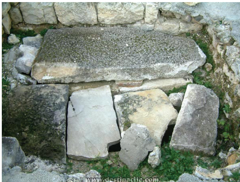
Slika 2. Grobovi u prostoru sjevernog tornja