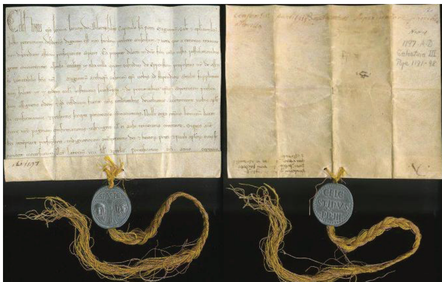
Slika 5. Lijep primjer bule – papinske isprave izdane 1192. za vrijeme pape Celestina III.