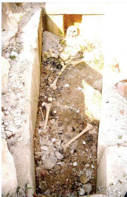
Slika 3. Južni grob – mjesto nalaza bule u listopadu 2003. godine

strane noge. Kamene kuglice nađene su kao grobni prilozi, a služile su za biranje opata (Sokač-Štimac, 2001., str. 92). Bula je dakle pronađena u južnoj grobnici nakon arheoloških iskapanja 2000. godine kao slučajan nalaz. Poslije istraživanja 2000. godine grob je pokriven četirima kamenim pločama, a čitav kostur ostavljen je u grobnici (sl. 3). Uslijed djelovanja atmosferilija gornja se ploča raspuknula, čime je grobnica postala staništem divljih životinja, a kostur je postao predmet pažnje nerijetkim posjetiteljima Rudine. Bulu je pronašao ujesen 2003. godine autor ovoga članka, u gornjem dijelu groba, što bi odgovaralo predodžbi da je postavljena pokojniku na prsa. Bila je na površini među razbacanim kostima, ali maskirana, prekrivena nakupinama kvarcnog pijeska i vapnenca koji su u tamošnjem tlu prisutni, te je vrlo lako da je na površinu isplivala iz prvog sloja zemlje, uslijed djelovanja atmosferilija ili životinja koje su tamo obitavale. 2 U ljeto 2004. godine, netom poslije slučajnog pronalaska bule, za potrebe snimanja dokumentarnog filma Hrvatska kulturna bašti-