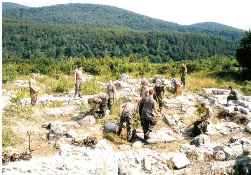
Slika 4. Fotografija iz kolovoza 2004. godine, kada je vojska čistila Rudinu