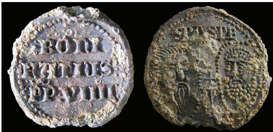
Slika 6. Bula pape Bonifacija IX. pronađena na Rudini

Rudinska bula s natpisom pape Bonifacija IX. izrađena je od olova. Kružnoga je oblika, sivozelene patine, s nešto površinskih oštećenja nastalih uslijed korozije metala. Bula je blago konkavna, a s gornje i donje strane vide se rupice kroz koje je prolazila nit kojom se vezivala za dokument ili ispravu. Promjer je bule 37 x 41 mm, debljina 5 mm, a težina 47,6 grama. Prikazi likova i natpisi na njoj mogu se potpuno uočiti. Na aversu je stilski en face prikaz dvaju likova s bradom, a ponad njih natpis SPASPE, što se dovodi u vezu s imenima sv. Pavla i sv. Petra – S[ anctus ] PA[ vlus ] S[ anctus ] PE[ trus ]. Između njih stoji trostruki papinski križ. Natpis na reversu teče u tri reda: BONI / FATIUS / PP:VIII, sa stiliziranim znakom papinske kape iznad slova PP. Ovdje se navodi ime vladajućeg pape Bonifacija IX. (1389. – 1404.), a akronim PP označava latinsku izvedenicu Pastor Pastorum , što u prijevodu znači „pastir nad pastirima“, dakle alegorijski opis papinske službe. Prikaz na aversu i prikaz na reversu zaokružen je točkastom kružnicom udaljenom tri milimetra od ruba. Prikaz desnoga lika na aversu te obrisi lica i brade ocrtani su točkicama, a lika na lijevoj strani linijama. Slova na reversu izrazito su velika (oko 5 mm) i tipična su gotica koja se rabi u kasnom srednjem vijeku, čija preciznost potpuno odudara od loše izvedbe natpisa na ugarskom i srednjovjekovnom novcu toga vremena (Margetić, Margetić, 2005., str. 290) (sl. 6).