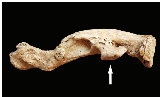
Slika 5. Antemortalna loše zarasla fraktura desne ključne kosti (posteriorni pogled). Grob 1, osoba B, muškarac, 51 – 60 godina.

lubanje, učestalost trauma dugih kostiju iznimno je visoka – ta vrsta trauma zabilježena je na čak 7,4% (17/231) analiziranih dugih kostiju. Frakture dugih kostiju na Rudini se najčešće javljaju na gornjim ekstremitetima, tj. na palčanim i ključnim (sl. 5) kostima. Potrebno je napomenuti da su u analiziranom uzorku registrirana i četiri kostura s višestrukim frakturama: 1) gr. 46, žena, fraktura lijevog rebra, desne