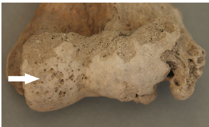
Slika 3. Jaki degenerativni osteoartritis (eburnacija i poroznost) na desnom laktu (anteriorni pogled). Grob 1, osoba A, muškarac, više od 50 godina.

Degenerativne promjene u smislu osteoartritisa na kralješcima i velikim zglobovima u uzorku s Rudine zabilježene su u relativno visokom postotku: na kralješcima je osteoartritis uočen na 16,3% analiziranih kralježaka (43/264), dok je na velikim zglobovima ta promjena uočena na čak jednoj četvrtini analiziranih zglobova (25,0% ili 22/88; sl. 3). U velikoj većini slučajeva zabilježeni osteoartritis na Rudini manife-