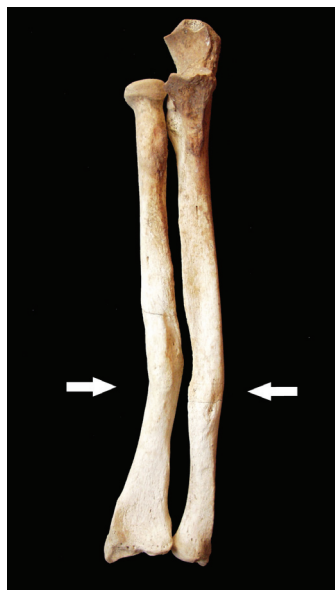
Slika 6. Antemortalna loše zarasla fraktura desne lakatne i palčane kosti (anteriorni pogled). Grob 46, žena, 31 – 35 godina.