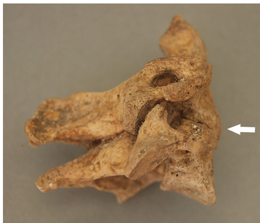
Slika 7. Ankiлоza 2. i 3. vratnog kralješka (lateralni pogled). Grob 27, osoba B, muškarac, 51 – 60 godina.

lakatne i palčane kosti (sl. 6); 2) gr. 32, muškarac, fraktura lijeve ključne kosti, lijeve palčane kosti i desne lisne kosti; 3) gr. 53, osoba A, muškarac, fraktura desne lakatne kosti, desne bedrene kosti i lijeve goljenične kosti; 4) gr. 53, osoba B, muškarac, fraktura lijeve ključne kosti i desne lakatne kosti.