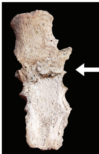
Slika 4. Antemortalna loše zarasla fraktura prsne kosti (anteriorni pogled). Grob 8, osoba C, muškarac, 51 – 55 godina.

Traume su vjerojatno najdramatičnije patološke promjene koje su registrirane na koštanim ostacima srednjovjekovnih stanovnika Rudine – zabilježene su kod 12 osoba (10 muškaraca i 2 žene). Bitno je naglasiti da su sve koštane traume s Rudine antemortalne, tj. nastale su davno prije smrti i nemaju veze s uzrokom smrti osoba kod kojih su uočene. S obzirom na položaj, registrirane traume mogu se podijeliti u tri skupine: frakture sitnih kostiju, frakture dugih kostiju i frakture lubanje. Među frakture sitnih kostiju mogu se ubrojiti fraktura drugog lijevog rebra koja je zabilježena na kosturu odrasle žene iz groba 46 i fraktura prsne kosti zabilježena na kosturu starijeg muškarca iz groba 8 (osoba C) (sl. 4). Registrirana je samo jedna depresijska, dobro zarasla, trauma lubanje, i to kod odraslog muškarca iz groba 5 (osoba B), što rezultira iznimno niskom učestalošću od svega 5,5% (1/18). Za razliku od fraktura