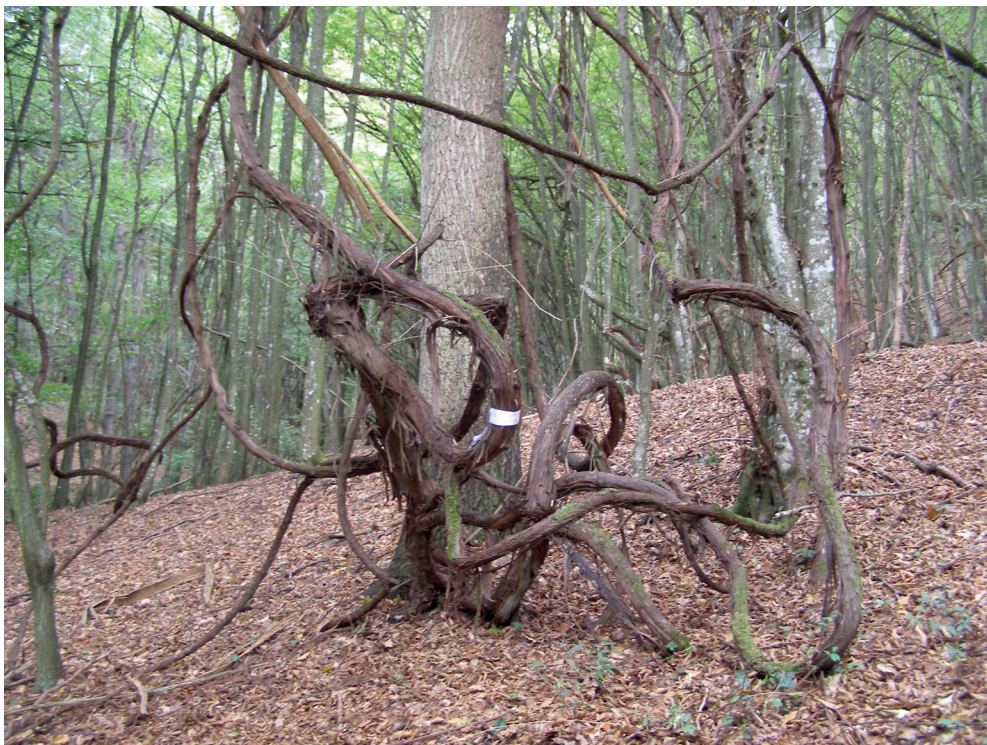
Slika 1. Primjerci starih loza na lokalitetu Rudina (Psunj) odlikuju se velikom starošću i neobičnom veličinom i rastu u konsocijaciji sa šumskim biljem

sobno su se razlikovali u genotipu, iako su neki bili fenotipski slični. Time je isključeno da su neki od uzoraka bili vegetativno razmnoženi od zajedničke roditeljske biljke (sorte). Kako prema dostupnim informacijama navedeni prostor više od 100 godina nije naseljen i u sustavu poljoprivrede (možda čak od vremena odlaska Turaka), jasno je da dugo vrijeme tamo nije bilo razmnožavanja loze rukom čovjeka. Ta bi spoznaja mogla dovesti do toga da su pronađene biljke samonikli sjemenjaci porijeklom od sorata uzgajanih prije više stoljeća. U ovom slučaju uzorkovane biljke ne bi bile klonski potomci starih sorata i ne bi predstavljale originalne genotipe iz vremena uzgoja već njihove potomke koji su prošli određenu prirodnu selekciju. To može biti iznimno važno iz perspektive oplemenjivanja vinove loze jer bi – kao posljedica prirodne selekcije – pronađene biljke mogle biti vrijedan izvor gena otpornosti prema biotskim i abiotskim čimbenicima. Za dobivanje preciznijeg odgovora o genetskom statusu tog materijala bilo bi potrebno uzeti znatno veći uzorak i u analizi povećati broj DNA markera.