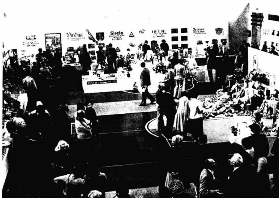
Sa izložbe mlječnih proizvoda u toku 6. susreta mljekarskih radnika

Impozantna višesadržajna izložba »MLJEKARSKA INDUSTRIJA SRH '81 u organizaciji Udruženja mljekarskih radnika SRH, radne organizacije »Mla