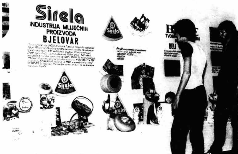
Detalj sa izložbe mlječnih proizvoda

dost« iz Zagreba i drugih suorganizatora, bila je samo još jedna posebno doživljajna prilika, da posjetioци uoče velik korak napretka u mljekarstvu, a posebno da se najpozitivnije izraze o prostoru, što ga je zauzimalo niz vrijednih amaterskih radova radnika mljekarske industrije.