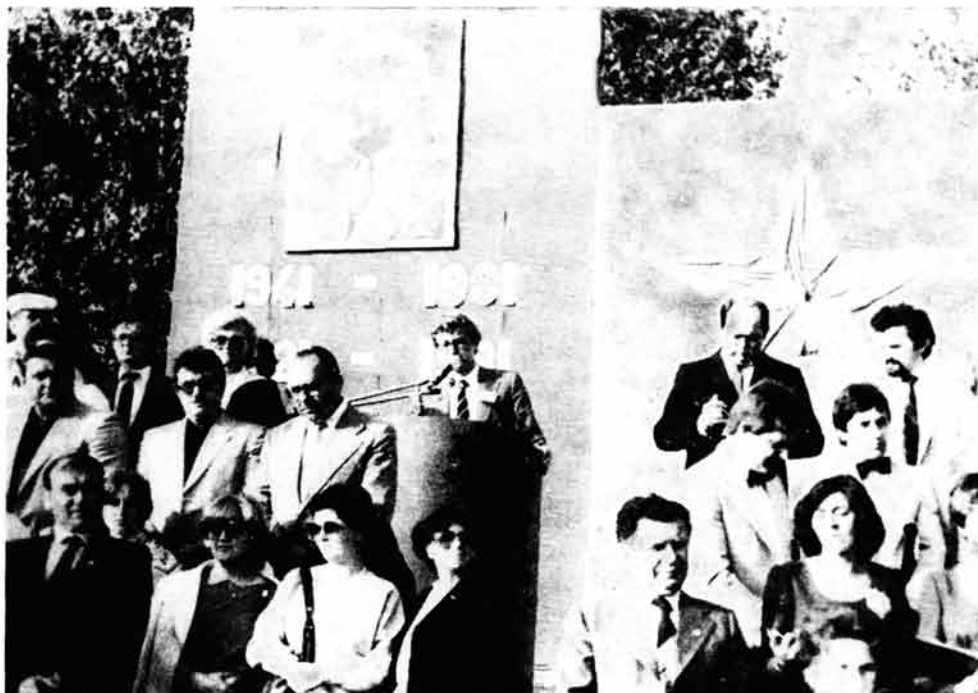
Svečano otvorenje VI susreta mljekarskih radnika u Velikim Zdencima

U petak, dvadeset i devetog maja započela su glavna natjecanja u nizu sportskih disciplina, koja su nastavljena sve do subotnje večeri tridesetog maja.