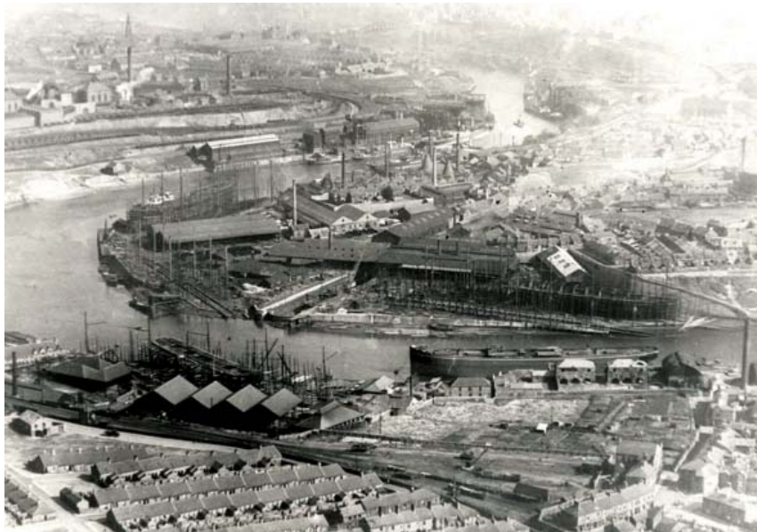
Brodogradilište Sunderland početkom 19. stoljeća Shipyards Sunderland beginning of the 19 th century

Iz navedenog popisa imena karatista parobroda „Napried“, vidljivo je da su osim par imena talijanskoga