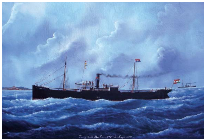
P/B „Predsjednik Becher“, ulje na platnu najvjerojatnije E. Adama (sina) S/S „Predsjednik Becher“, oil on canvas, most probably by E. Adam (son)

Parobrod „Predsjednik Becher“ pozivnog znaka „H Q G V“, izgrađen je 1900. g. u Stockton on Teasu. Imao je 2.319 brt (1.445 nrt) i jačinu parostroja od