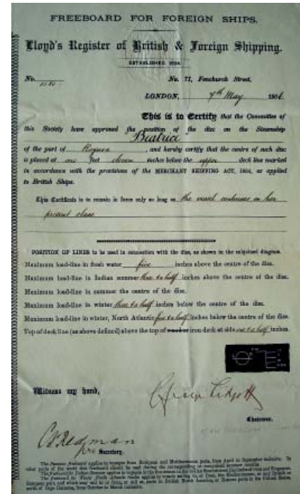
Potvrda o oznaci nadvođa parobroda „Beatrice“ Certificate on position of freeboard lines for s/s „Beatrice“