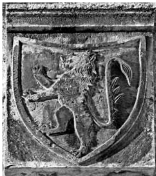
Slika 4. Grb Ciprianis s kuće iznad svoda