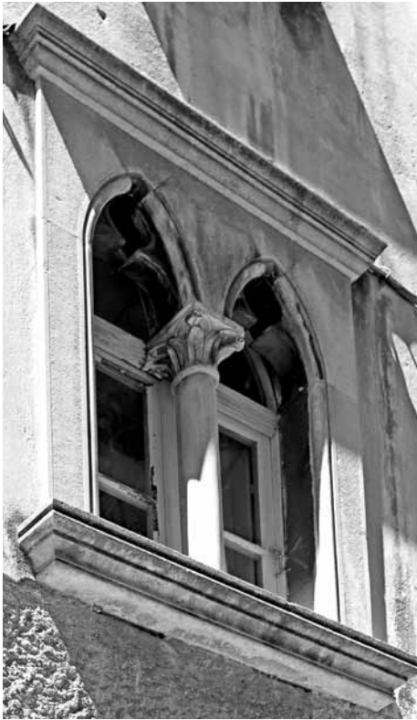
Slika 6. Gotska bifora, današnje stanje