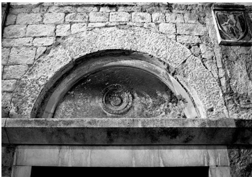
Slika 5. Romanička luneta s novim vijencem i grbom Ciprianis