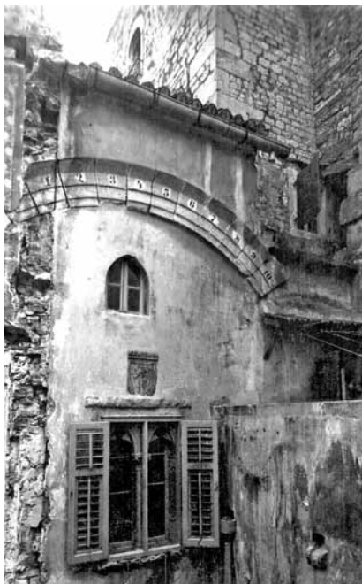
Slika 3. Kuća Ciprianis (tada Marini) uoči rušenja 1928.