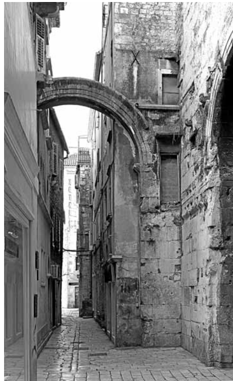
Slika 7. Današnje stanje uz Željezna vrata