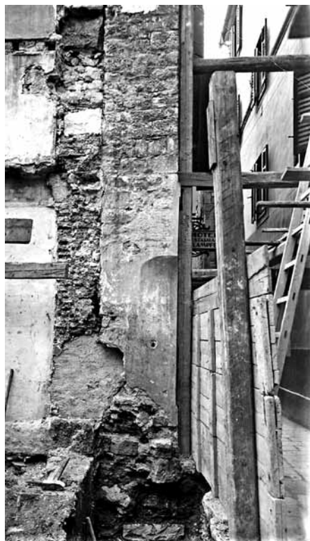
Slike 8 i 9. Ostaci antičkih zidova nađeni prigodom rušenja stare kuće Božić