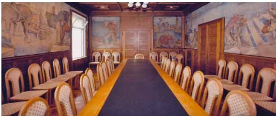
Slika 4. Freske u dvorani za sastanke u zgradi Lučke kapetanije u Splitu (danas je koristi tvrtka Plovput)