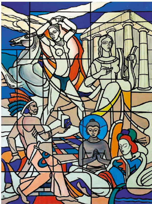
Slika 3. Vitraj nad stubištem u nekadašnjem kinu Tesla u Splitu