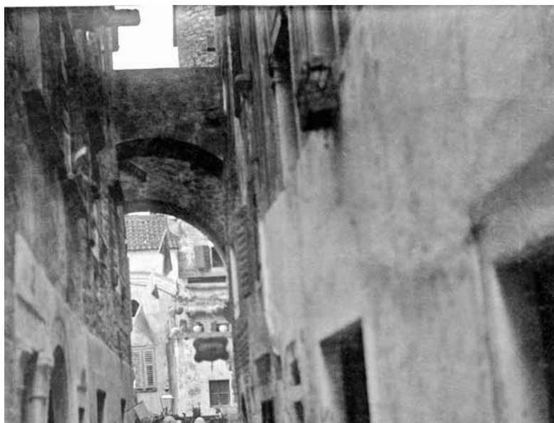
Slika 2. Pejsaž (ulje na platnu)