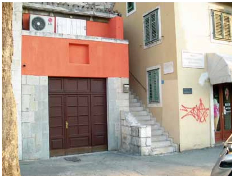
Slika 2. Ulaz u Podrume, nakon sanacije