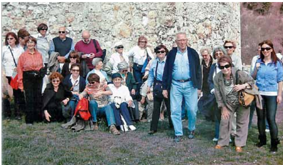
Slika 4. Članovi Društva na izletu u Srednjoj Bosni, travanj 2011.