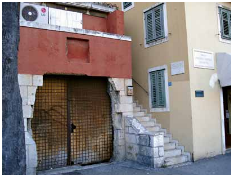
Slika 1. Ulaz u Podrume, prije sanacije