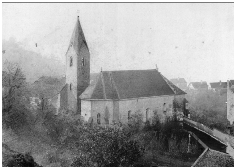
2. Gjuro Szabo: Franjevačka crkva u Šarengradu oko 1912. – 1914., s još uvijek cjelovito sačuvanim kontraforom uz glavno pročelje (Ministarstvo kulture Republike Hrvatske, Uprava za zaštitu kulturne baštine, ostavština Gjure Szabe)