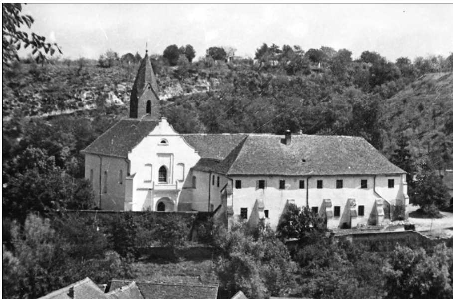
5. Šaregradska franjevačka crkva i samostan sredinom 20 st., nakon Frankovićevog zahvata