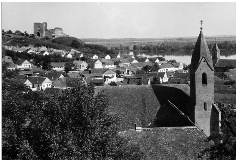
1. Zvonik šarengradске franjevačke crkve i samostanske zgrade; u pozadini šarengradski burg i pravoslavna crkva