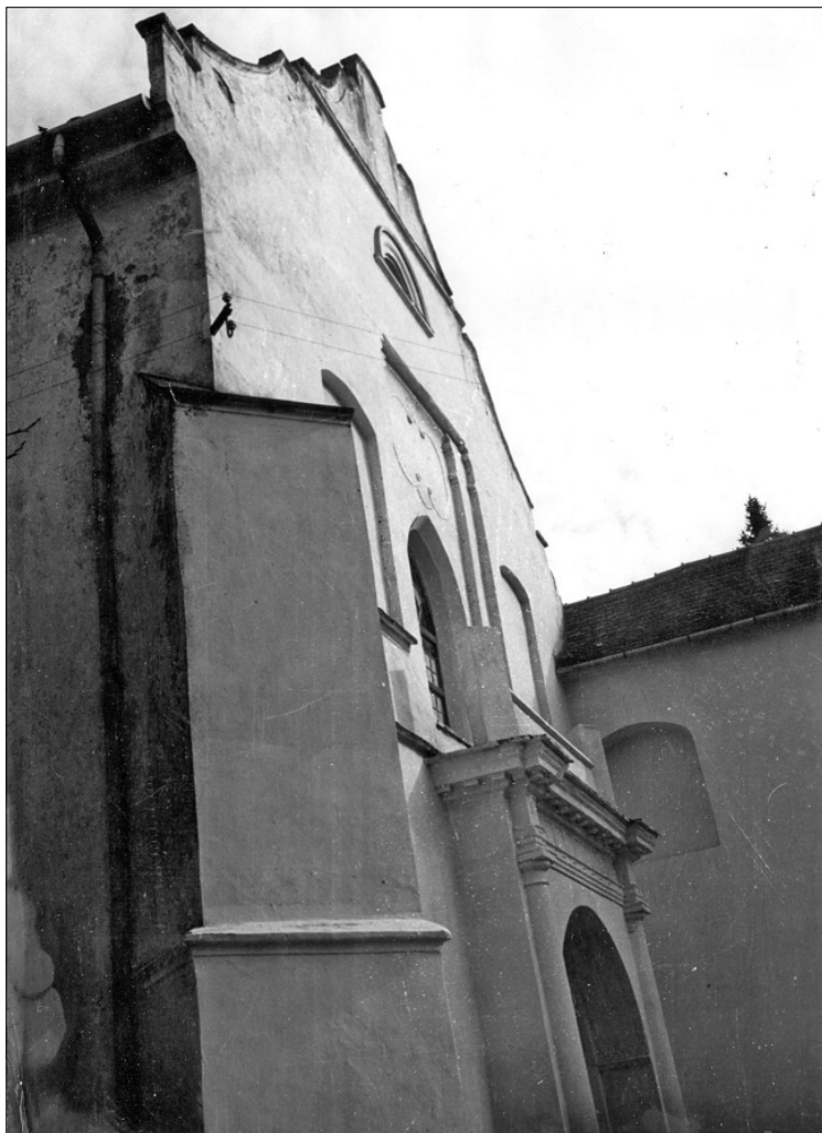
7. Nino Vranić: Glavno pročelje župne crkve svetih Petra i Pavla 1956. godine