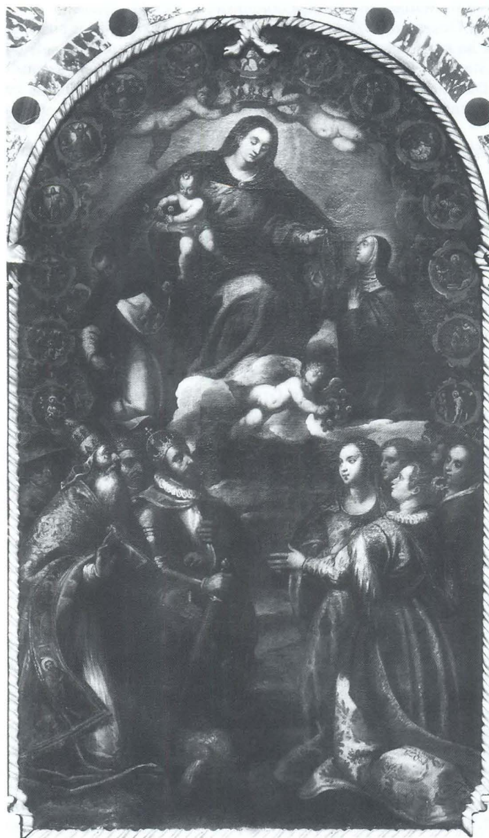
Oltarna pala Gospe od Ružarija