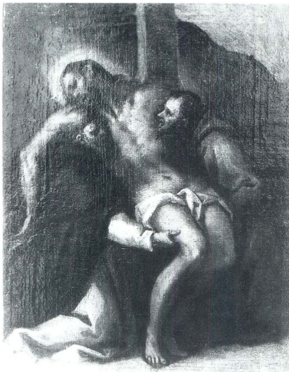
J. Palma Ml., Skidanje s križa