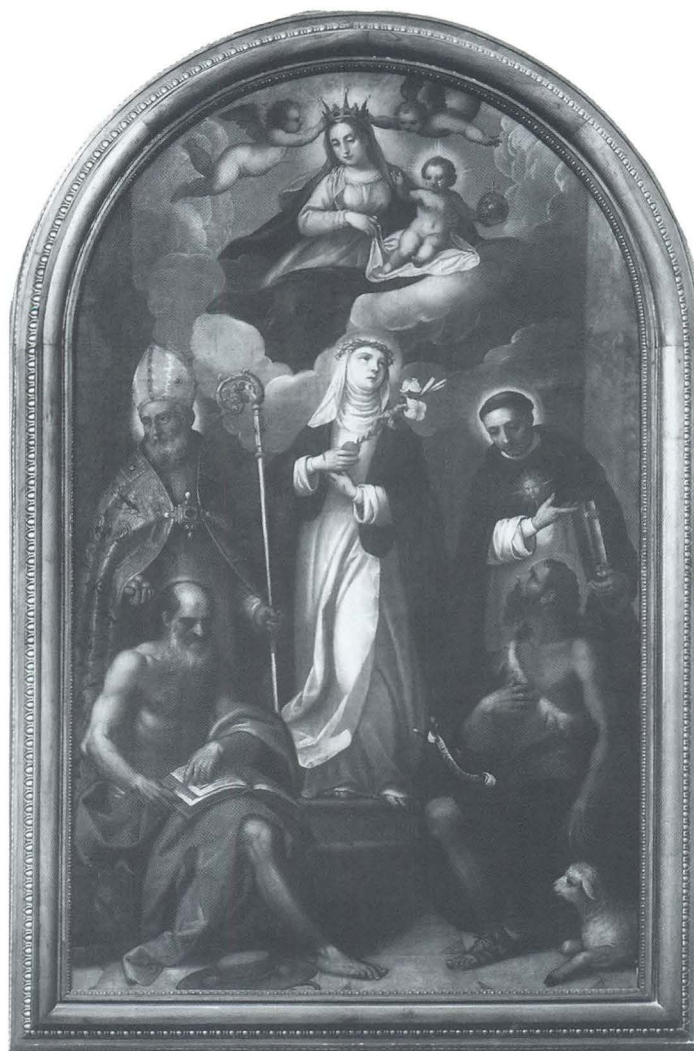
Baldassare D'Anna, Sv. Katarina Sienska s likovima sv. Nikole, sv. Tome Akvinskoga, sv. Jeronima i sv. Ivana Krstitelja

kao na primjer nova pokaznica i tri zastave koje su se, uz pratnju u bijelo odjevenih djevojčica, na Gospine blagdane nosile u svečanom ophodu, 111 nabavljene su nove klupe, 112 g. 1914. svotom od 567,28 kruna nabavljeno je 10 svijećnjaka i jedan križ od bijele kovine itd. 113