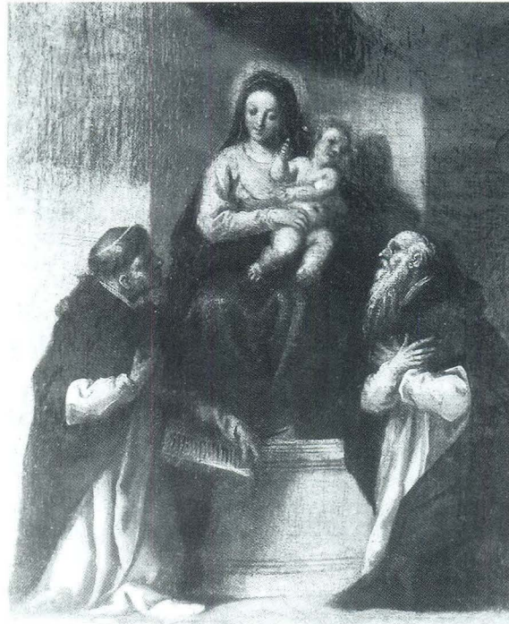
J. Palma Ml., Bogorodica s Djetetom i svecima

zavjeta, naročito siromaštva 56 - što su radili i nereformirani - naročito pozornost posvećivali opsluživanju muka, klauzure, sabranosti, zatim crkvenim obredima, liturgijskom i koralnom životu, intenzivnijem učenju, propovijedanju i općenito radu u svim njegovim oblicima. U posjedu smo prilično opširna izvještaja o životu