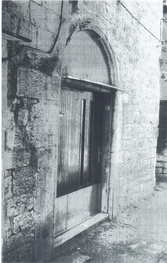
Kuće uz glavnu ulicu u Pasikama, s lučnim vratima i ugaonim štapom (XIII/XIV. stoljeće)

tiji crkve sv. Dominika. 105 Na jednoj skromnoj jednokatnici nalaze se lučna, romanička vrata pred kojima je kao podest stepenica kamena ploča romaničkih profilacija (kat. čest. 1001). Iako je ta kuća veoma stara, s pragom vrata prizemlja