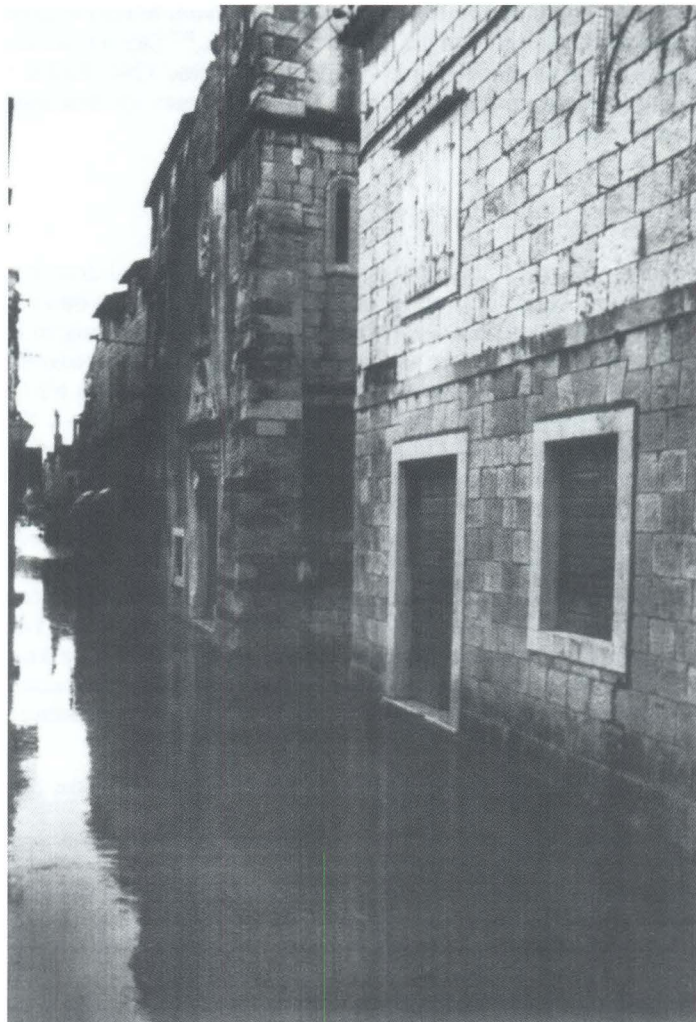
Ulica koja razdvaja Pasike od Obrova za vrijeme plime 7. siječnja 2003.

Splita izrijekom zabranjuje podizanje takvih kuća uz zidine predgrađa. 85 Prema Splitskom statutu kamena kuća ima prednost nad drvenom. 86