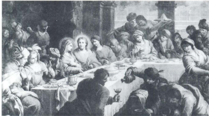
Francesco Maggiotto, slika Večere u Kani, Padova, Oratorio delle dimesse

štovani kult ranjenog srca, koje je oduvijek bilo simbol ljubavi, naslijedio je ranije srednjovjekovne kultove Kristovih rana. 17 No tipologija Bevilacqua Krista ponešto je drugačija je od one Batonijeve gdje Isus lijevom rukom pridržava svoje plamteće srce okrunjeno trnovom krunom i probijeno čavlima. On ovdje objema rukama razdire haljine i pokazuje svoje levitirajuće plamteće srce.