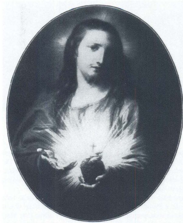
Pompeo Batoni, slika Srca Isusovog, Lisabon, crkva Srca Isusovog

Isto bočno svjetlo rasvjetljava i lica krilatih anđela koji lebdeći okružuju Isusa. Inkarnat im je svijetao i ružičast, forme okrugle i prenaglašene. Središte kompozicije je statični Isusov lik koji ispunja cijeli kadar, dok određeni dinamizam kompoziciji daju upravo te krilate glavice u ispunama između Isusove glave i kutova slike. Na slici dominira ružičasti inkarnat, uz naglašeni kromatski kontrast tople blijedocrvene Isusove haljine i plavog plašta preko ramena, koji se ističu na monokromnoj smeđe-zelenoj pozadini.