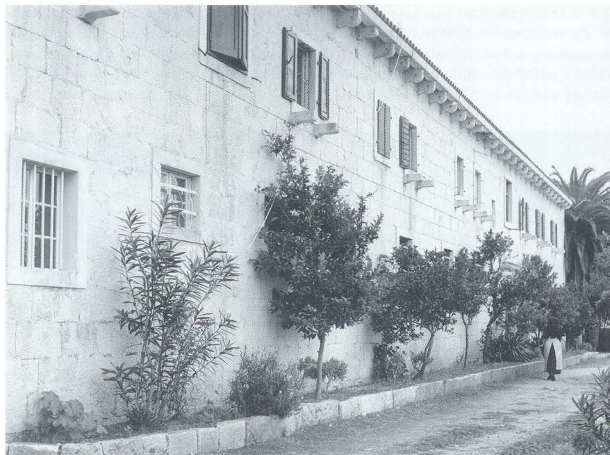
Pogled na franjevački samostan u Sumartinu

Hvaru, u neposrednoj blizini kopna tek sad udaljenog brodicom, da bi mogli povremeno tamo odlaziti i donositi plijen. Spominje da su bili ratnički nastrojeni i da su u svoje pljačkaške pohode odlazili svakih petnaestak dana jer drukčije nisu mogli živjeti. 7