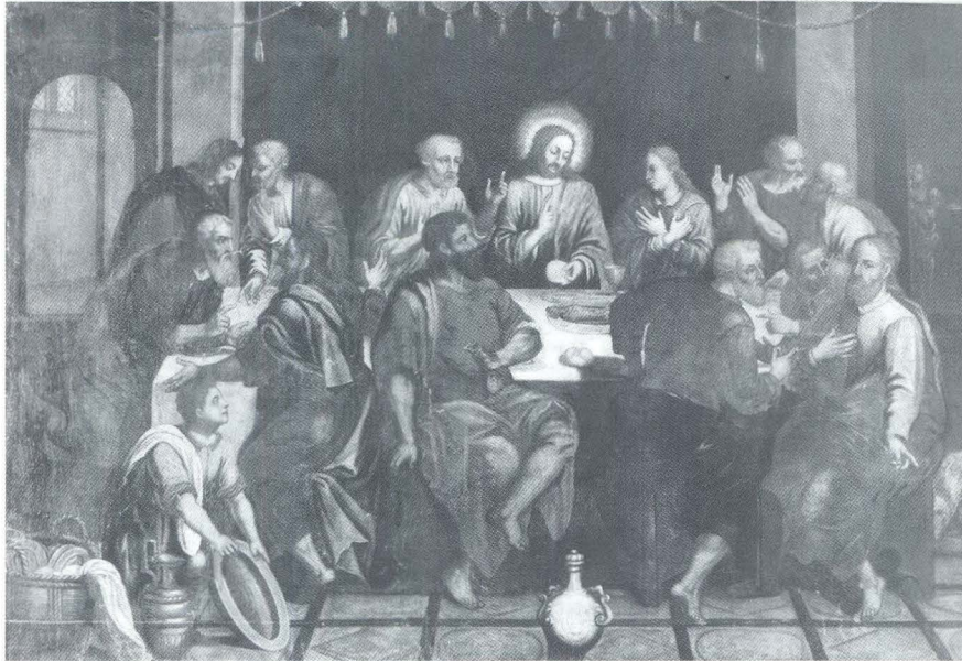
Nepoznati slikar, Posljednja večera, 17. st.

Uz sve to treba spomenuti sačuvane umjetnine koje su se sakupile tijekom stoljeća u sumartinskom samostanu i crkvi koje su sada izložene u samostanskoj zbirci. One pokazuju domet i nastojanje redovnika da ukrase i obogate samostan. Pokaznica, jedan kalež, piksida i kadionica pripadaju 17. stoljeću, dok su dva kaleža, srebrni viseći svijećnjak i pax s prikazom Žalosne Gospe iz 18. stoljeća. Isto tako i slike pripadaju tim stoljećima, među kojima treba istaknuti Posljednju večeru koja je sigurno bila namijenjena blagovaonici, te sliku sv. Ante s portretom fra Šimuna Ribarevića iz 1686. godine, a po vrijednosti one sv. Magdalene i slikana vratašca svetohraništa. Iz baroknog je vremena i drveno raspelo, sada izloženo uz glavni oltar.