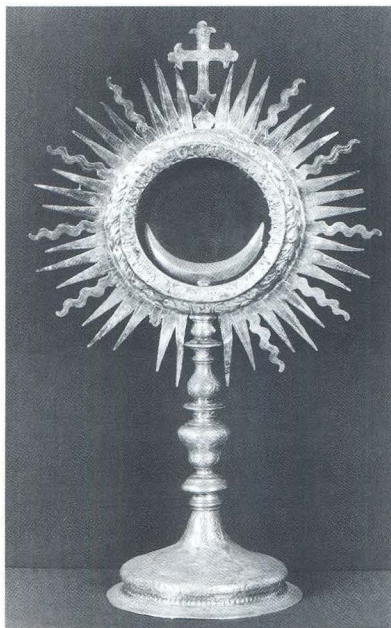
Srebrna pokaznica iz 17. st.