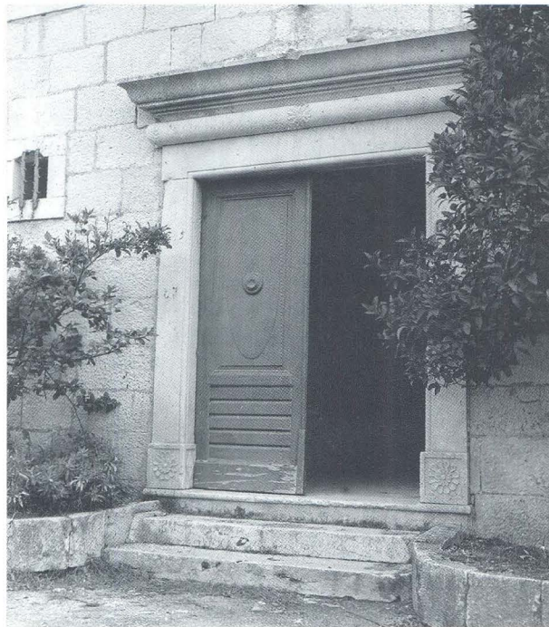
Glavni ulaz na južnom pročelju samostana

U boravišnom dijelu na zapadnoj strani redom su smješteni od ulaza: stubište uzlaza na kat s lučnim otvorom, konoba, sprema za vino, koja je po običaju povezana vratima s blagovaonicom, refektorijem, a imala je i neposredan ulaz iz hodnika i sprema pod stubištem. Slijedi samostanska blagovaonica, sa središnjim vratima s barokno ukrašenim nadvratnikom, s još dva prozorčića prema hodniku, te konačno kuhinja s kominom na zapadnom zidu, s vratima prema hodniku i prema dvorištu i prozorčićem za predaju hrane prema blagovaonici. Svi ti prostori imaju četvrtaste prozore s glatkim kamenim okvirima, nešto veće od onih na gospodarskom dijelu, i simetrično su raspoređeni uokolo tih prostora. Od glavnog ulaza