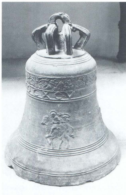
Zvono iz 1695. godine

Nakon što je sagrađena crkva, razmišljalo se i o gradnji samostana za udobniji boravak redovnika. Tu je nakanu pokrenuo fra Andrija Kačić Miošić kad je nastupio 1747. godine kao gvardijan sumartinskog samostana, došavši u tu zajednicu dvije godine prije. 10 Očito je u Sumartin došao pun znanja, žara i pronicljivosti nakon studija filozofije i teologije u Budimu i Osijeku, a studirao je vjerojatno i u Italiji. Imenovan je profesorom filozofije i moralke u franjevačkom samostanu u Zaostrogu i Šibeniku, s položenim ispitom generalnog profesora teologije u Mlecima, te konačno stekao časni naslov »jubilarnog lektora«. 11