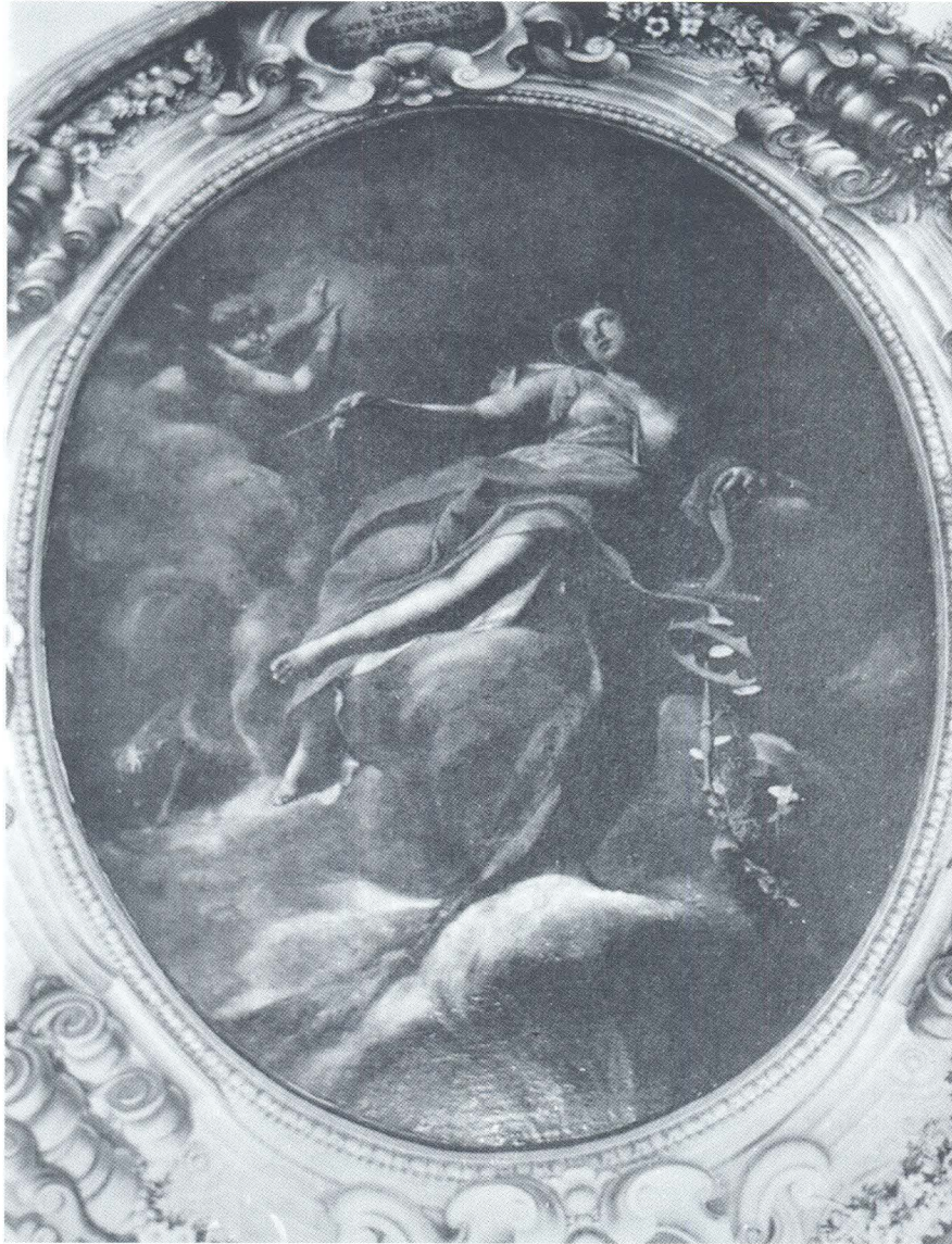
Federico Benković, Junona, 1707, Forli, Palazzo Orselli Foschi

jatelji. 4 Orettiev rukopis zanimljiv je kao svjedočanstvo suvremenika o osam Benkovićevih djela u Bolonji, Forliu, Veneciji i Milanu, od kojih su tek tri sada poznata, a samo dva in situ.