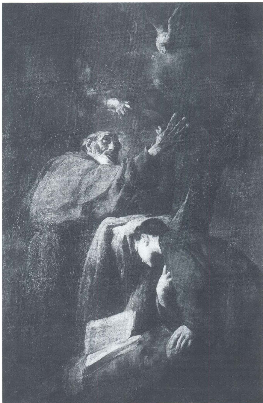
Federico Benković, Bl. Pietro Gambacorti, 1725/1728, Venecija, Crkva sv. Sebastijana