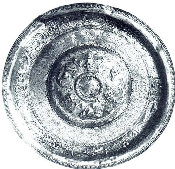
Srebrni tanjur, 17. stoljeće, Zadar, Crkva sv. Šimuna

Podovi u sobama bili su pokriveni sagovima, a stepenice sturama. Ulazna vrata s nutarnje strane bila su pokrivena zastorima poznatima pod imenom »portiere« od vunenog sukna ili kože; obitelj Soppe ima pet zastora od crvenog sukna s obiteljskim grbom i jedan s bijelim križem, te jedan od zlatom obojene kože, a obitelj Detrico šest zastora s obiteljskim grbom i dva od zlatne kože. Udobnost i toplinu doma stvarali su razni sitni predmeti kao što su jastuci od svile, obrađene i obojene kože, urešeni vezom, vrpčama i svilenim resama. U kući Soppe zabilježene su posude sa cvijećem, a posebno se spominje mirisni jasmin cijenjen stoljećima u Dalmaciji, a u kući Detrico krletke sa pticama, što na određeni način zaokružuje sliku o čovjeku 17. stoljeća. 32