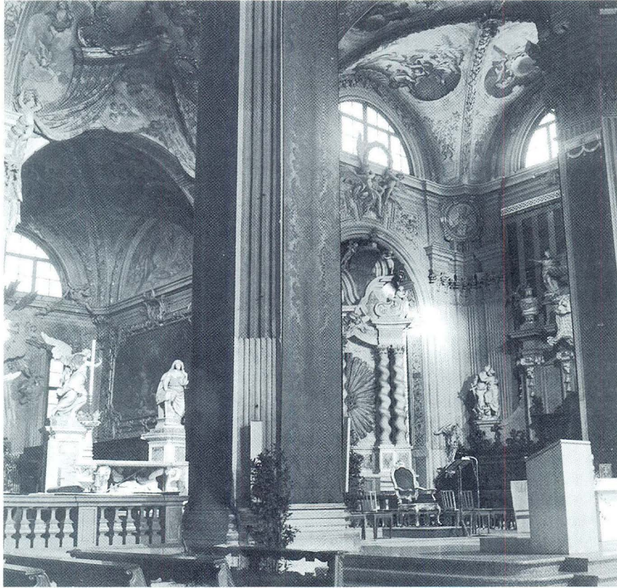
Udine, Duomo, glavni i bočni oltar

primjer, gradeći Duomo u San Daniele del Friuli (1700-1725) ili Francesco Maria Preti u projektu Duoma u Trevisu (1742 - 1755) 6