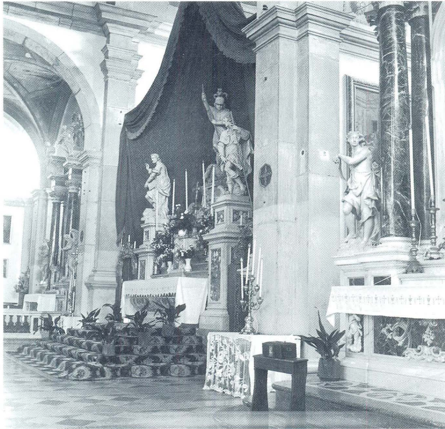
Rovinj, Sv. Eufemija, glavni i bočni oltari

svetišni prostor iste širine kao što je cijela trobrodna unutrašnjost crkve. U udinskom Duomu svetište uključuje spomenike obitelji Manin, postavljene uz oba bočna zida i ispred klupe u kojima su članovi iste obitelji prisustvovali crkvenim obredima, odvojeni od ostalih vjernika. Bogata štuko-dekoracija naglašava izdvojeno značenje svetišta i prostora koji pripada Maninima.