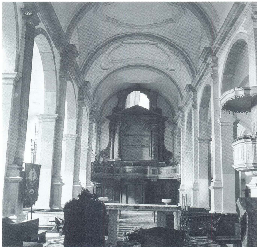
Rovinj, Sv. Eufemija, glavni brod, pogled prema ulazu

Benussiev opis crkve sv. Eufemije nije važan samo stoga što donosi imena sudionika i datume početka gradnje i dovršenja pojedinih njezinih dijelova. Za tumačenja njezine arhitekture također su korisne napomene o promjenama koje su uslijedile tokom izgradnje crkve. Ali prije nego što pokušamo protumačiti što se krije iza Benussievog pomalo zagonetnog zaključka da je Dozzi morao učiniti ustupke »ponešto na štetu arhitektonskih pravila«, opišimo ukratko izgled crkve. Crkva je trobrodna građevina s nizom kapela uz bočne brodove. Srednji brod nije toliko viši od bočnih da bi crkva mogla biti bazilikalno osvijetljena, nego je rasvijeta njezine unutrašnjosti svedena samo na prozore kapela. Brodovi su dugi šest travaja. U glavnom se brodu izmjenjuju travaji nadsvodeni bačvastim svodom i češkom kapom, a u bočnima, križnim svodom i tako stiješnjem kupolastim, da je zapravo na sferne trokute položena mala stropna površina. Izmjenom se svodnih oblika - osobito u glavnom brodu bačvastog i češkog, dakle kupolastog - pokazuju srodnosti sa shemom koja proizlazi iz venecijanske bizantsko-romaničke crkvene građevine. Spomenuta shema koristila se u 11. i 12. stoljeću u gradnji župnih crkava grada Venecije. Njihova je osnova grčki