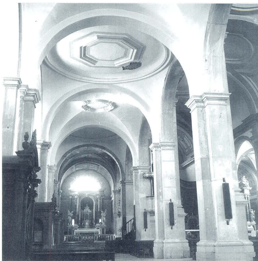
Rovinj, Sv. Eufemija, bočni brod, pogled prema apsidi

križ upisan u pravokutnik s kupolama na križištu i u uglovima između krakova grčkog križa. Umnožena, ona se ponavlja i u crkvi S. Marco, zaštitnika grada. U renesansni isti tlocrtni oblik - već u 16. stoljeću nazvan »la forma della cuba di mezzo di San Marco« 4 - ponovno u venecijansku arhitekturu uvodi Mauro Codussi crkvom S. Giovanni Crisostomo. 5 Odmah potom Giorgio Spavento, 1506. godine, u rješenju crkve S. Salvatore umnaža »cuba di S. Marco« u dužinu od šest traveja, jednako kao i kod S. Marca. Izduženi oblik crkve umnažanjem takvog »cuba« obnavljaju venetski arhitekti 18. stoljeća Domenico Rossi na