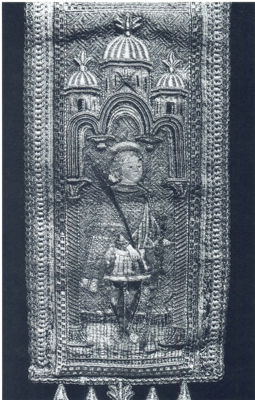
Antun Hamzić, Misnica u Crkvenom muzeju u Korčuli (stražnja strana misnice)