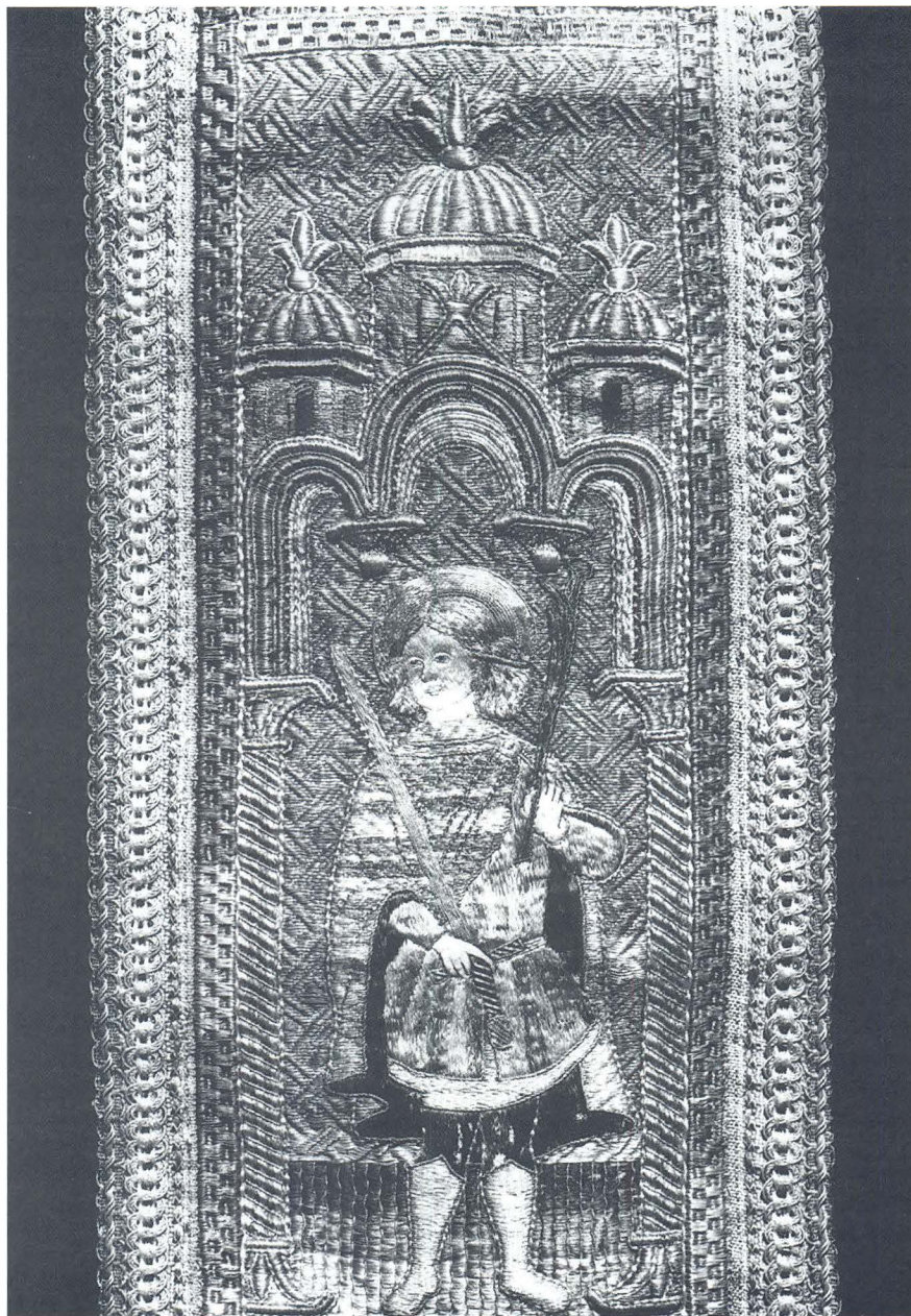
Antun Hamzić, Misnica u Crkvenom muzeju u Korčuli (stražnja strana misnice)

ka i sve hrvatske primorske umjetnosti 15. stoljeća, pripadnost kojoj im se ne može zatajiti. Usporedi li se detaljnije izvezene likovne ukrase i građevinske okvire s onima na ruhu navlastito s misnicama koje potječu s kraja 15. i početka