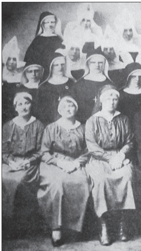
Slika 2. Sestre pomoćnice ranih 1920-ih s pokrivalima za glavu koja su nalikovala pokrivalima časnih sestara (privatno vlasništvo).

Figure 2 - Auxiliary nurses in the early 1920s, wearing bonnets similar to nuns' (private collection)