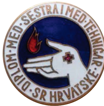
Slika 14. Službena značka, emajlirana s natpisom: DIPLOM. MED. SESTRA I MED. TEHNIČAR SR HRVATSKE, nakon 1950. (privatno vlasništvo)

Figure 13 – Enamelled badge with the inscription GRAD NURSE PR CROATIA after 1945 (private collection)