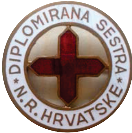
Slika 13. Službena značka, emajlirana s natpisom: DIPLOMIRANA SESTRA N.R. HRVATSKE, nakon 1945. (privatno vlasništvo)

Figure 13 – Enamelled badge with the inscription GRAD NURSE PR CROATIA after 1945 (private collection)