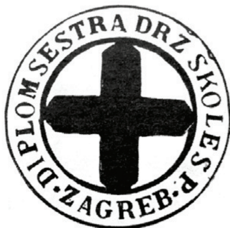
Slika 10. Nacrt službene značke diplomiranih sestara pomoćnica u međuratnom razdoblju s natpisom: DIPLOM SESTRA DRŽ. ŠKOLE S. P. ZAGREB (privatno vlasništvo)

Figure 10 – Design of graduate auxiliary nurse badge between the world wars saying: GRAD NURSE NAT AUX NURSE SCHOOL ZAGREB (private collection)