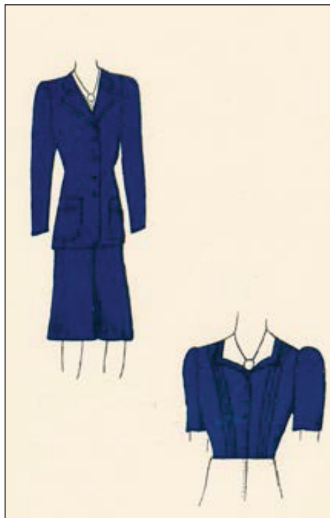
Slika 9. Nacrt proljetnog i jesenskog kostima i bluzice, početak 1940-ih (HR-DAZG-237, sign. 35/3)

Figure 8 – Design of a winter coat from the early 1940s (State Archives in Zagreb, HR-DAZG-237, sign. 35/3)