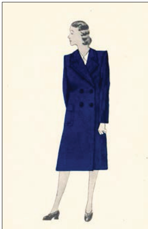
Slika 8. Nacrt zimskog kaputa, početak 1940-ih (HR-DAZG-237, sign. 35/3)

Figure 8 – Design of a winter coat from the early 1940s (State Archives in Zagreb, HR-DAZG-237, sign. 35/3)