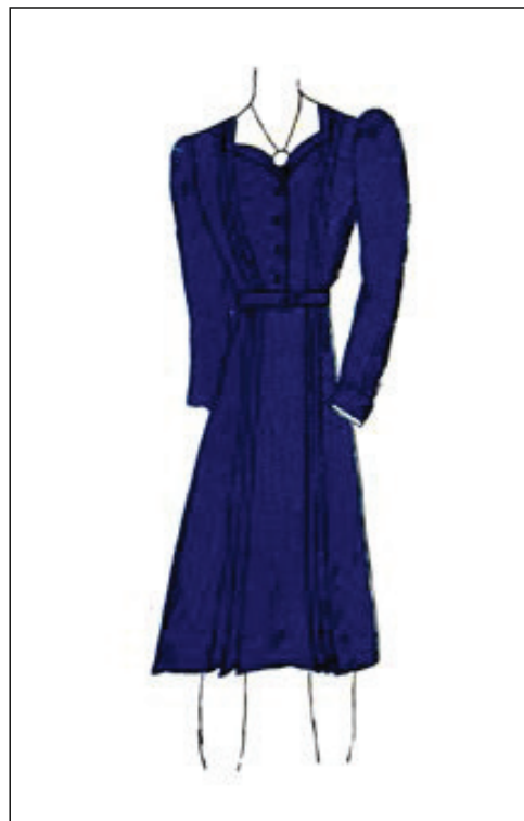
Slika 7. Nacrt haljine za terenski rad, početak 1940-ih (HR-DAZG-237, sign. 35/3)

Figure 6 – Design of an indoor working dress from the early 1940s (State Archives in Zagreb, HR-DAZG-237, sign. 35/3)