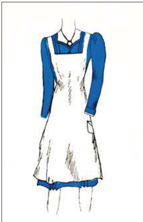
Slika 6. Nacrt haljine za unutarnji rad, početak 1940-ih (Državni arhiv u Zagrebu, HR-DAZG-237, sign. 35/3)

Figure 6 – Design of an indoor working dress from the early 1940s (State Archives in Zagreb, HR-DAZG-237, sign. 35/3)