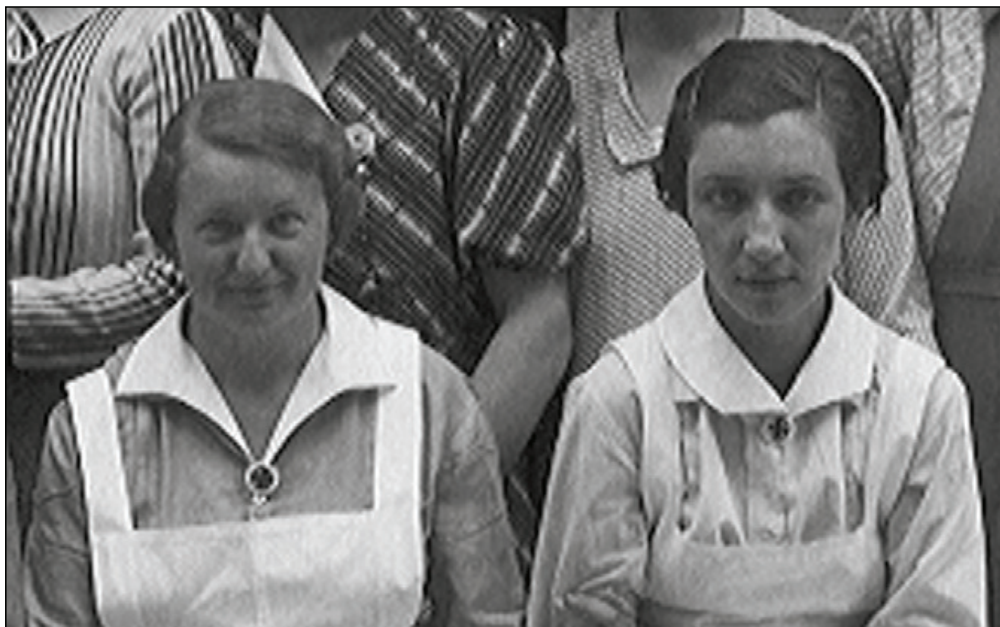
Slika 4. Značke sestara pomoćnica propisno postavljene na spoju kragne, 1930-ih (privatno vlasništvo).

Figure 4 – Auxiliary nurse collar pins, 1930s (private collection)