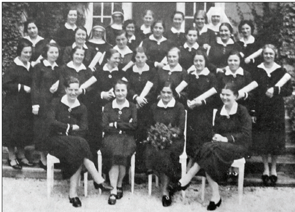
Slika 3. Diplomirane sestre pomoćnice u uniformama, 1930-ih (Iz knjige: Lalić S. ur. Spomen knjiga Škole za medicinske sestre Zagreb)

predmet. Tako je ogrtač za ulicu tamnomodre boje izrađen od sukna, dužine 30 cm od poda. Na lijevoj strani ima ušiven znak crvenog križa. Tamnomodre je boje bila i pelerina za rad vani, jednakoga ušivenog znaka i dužine, jedino što je bila sašivena od lakšeg sukna. Šešir za vanjski rad bio je tamnoplave boje, za ljeto slamnati, za zimu pusteni. I šeširi su imali ušiven znak crvenog križa na vrpci sprijeda. Za unutarnji rad sestre su nosile bijele kape, propisane prema uzorku zagrebačke škole. Cipele su trebale biti crne ili bijele, pete niske, s gumom. 24 Za čarape se navodi da moraju biti crne za vanjski rad, a za unutarnji su se uz crne propisivale i bijele. Navodi se da ne smiju biti svilene. Haljina za vanjski rad je, kao i pelerina, morala biti dužine 30 cm od poda, tamnomodra. Zimska je trebala biti od sukna, ljetna od listera. Haljine su imale dugačke rukave i dvostruke manžete. Propisuje se da bijela manžeta viri 1 cm. Ovratnik je također dvostruki. Bijeli ovratnik izviruje 3 cm ispod plavog. Puceta na haljinama su tamnomodra, a značka škole nosi se ispod