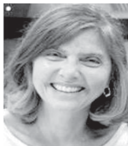
SLIKA [5] Dr. Pamela Hinds.

ty Press, 1999). U knjizi „Loss, Trauma and Resilience“ [Norton, 2006], predstavlja šest terapijskih smjernica za liječenje kada se gubitak iskomplicira u dvosmislenost. Ove smjernice temeljene su u godinama rada s obiteljima nestalih tijekom Vijetnamskog rata, rata na Kosovu, kao i u kliničkom radu s obiteljima kojima su bližnji „nestali psihički“ od Alzheimerove bolesti i drugih demencija, kao i od traumatskih ozljeda mozga. Najnovija knjiga dr. Boss, „Loving Someone Who Has Dementia“ (Jossey-Bass, 2011), govori o načinu upravljanja tijekom stresa i tuge dok se brinemo o nekome i nudi nadu za rješavanje „dvosmislenog gubitka“ demencije; imati voljenu osobu kraj sebe, a opet je nemati, fizički je prisutna, ali psihički odsutna.