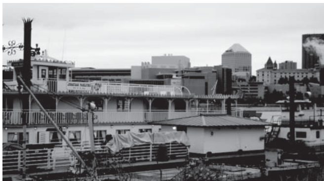
SLIKA [2] Brod na Mississippiju.

Ad 3] Ispitati modele za provođenje istraživanja u obitelji kroz evidence-based (istraživanja temeljena na dokazima) model skrbi;