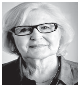
SLIKA [4] Dr. Pauline Boss.

Dr. Pauline Boss , profesor emeritus na Sveučilištu u Minnesoti, suradnica u American Psychological Associationu i American Associationu za brak i obiteljske terapije, bivša predsjednica National Councila on Family i obiteljska terapeutkinja u privatnoj praksi. Svojim revolucionarnim radom, kao znanstvenik-praktičar, dr. Boss je glavni teoretičar u studij „dvosmislenog gubitka“ [ ambiguous loss ], a termin je uporabila 1970. godine. Otada je istraživala različite vrste gubitka, sumirajući svoj rad u knjizi „Ambiguous Loss: Learning to Live with Unresolved Grief“ [Harvard Universi-