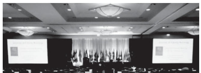
SLIKA [1] Konferencijska dvorana.