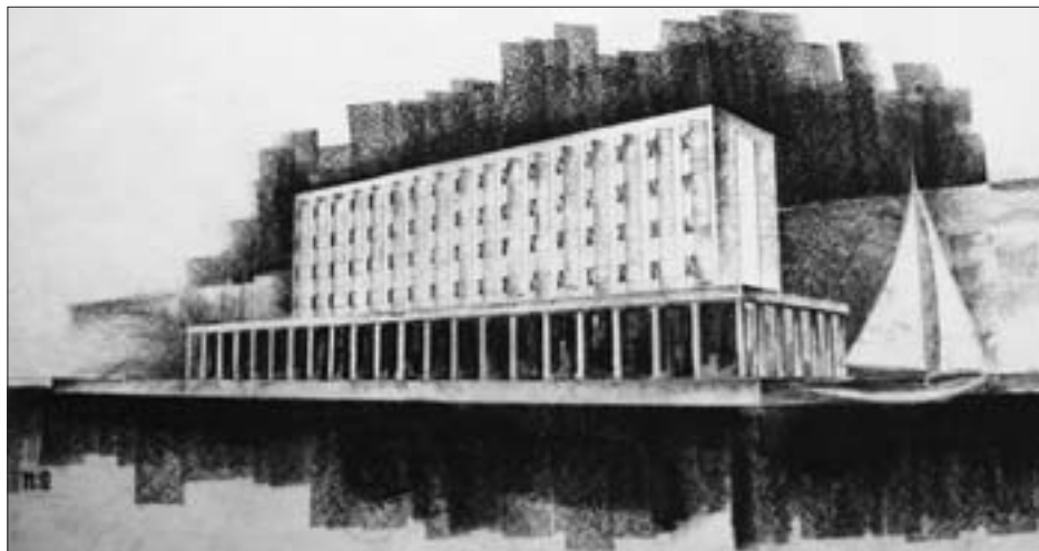
SL. 9. L. HORVAT: HOTEL U SPLITU, NATJEČAJNI PROJEKT, 1933. FIG. 9 L. HORVAT: HOTEL IN SPLIT, COMPETITION PROJECT, 1933

jekt je koherentan jer se u prostoru prije svega uočavaju dva glatka, ostakljena, paralelna korpusa koji čistocom forme dominiraju prostorom. Objekt svojom formom ničim nije ukazivao na unutrašnju organizaciju prostora ili sadržaja. 71