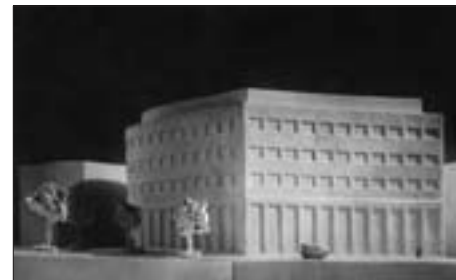
SL. 2. L. HORVAT: OKRUŽNI URED ZA OSIGURANJE RADNIKA U BEOGRADU, NATJEČAJNI PROJEKT, 1929.

Gostovanje većega broja arhitekata ostvareno je tek na Trećoj izložbi „Zemlje”, 23 održanoj u