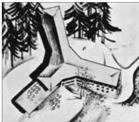
FIG. 10 L. HORVAT AND STJEPAN PLANIĆ: CLIMBERS' LODGE ON SLJEMEN, COMPETITION PROJECT, 1934