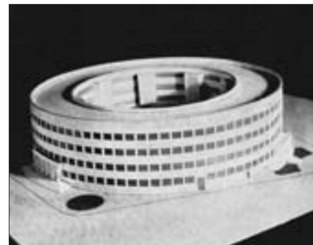
FIG. 3. L. HORVAT: BANSKA PALAČA (GOVERNOR'S PALACE) IN NOVI SAD, COMPETITION PROJECT, 1930