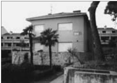
SL. 7. L. HORVAT: KUĆA KORLAET U SPLITU, 1932., FOTO PRIJE RUŠENJA 2004. GODINE FIG. 7 L. HORVAT: KORLAET HOUSE IN SPLIT, 1932, PHOTOGRAPHS TAKEN BEFORE DEMOLITION IN 2004

katalogu izložbe objavljeni su i Horvatovi, Iblerovi te Planićevi crteži obiteljskih kuća. 44