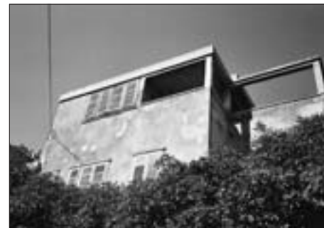
SL. 8. L. HORVAT: KUĆA ČIČIN-ŠAIN U SPLITU, 1932., FOTO: PRIJE REKONSTRUKCIJE 2005. GODINE FIG. 8. L. HORVAT: ČIČIN-ŠAIN HOUSE IN SPLIT, 1932, PHOTOGRAPHS TAKEN BEFORE RECONSTRUCTION IN 2004

Na istoj je izložbi Ibler predstavio i projekt s natječaja iz 1933. godine za zgradu Državne stamparije u Beogradu , na kojemu su među brojnim arhitektima u koautorstvu sudjelovali Horvat i Planić. 68 Na pravokutnoj parceli, omeđenoj prometnicama, 69 predvidjeli su samostojeci dvodijelni objekt „H” tlocrta. Dva ostakljena, paralelna kubusa pravokutnih baza i različitim visina spojena su na razini prizemlja i trokatnom servisnom „spojnicom”. 70 Viši, trokatni kubus, u kojemu su smješteni pogoni tiskare i stanovi, smješten je do same prometnice, čime je pred ulaznim pročeljem formirana slobodna ozelenjena površina kojom se prilazi u niži, dvoetažni kubus uredskih prostorija, koji završava terasom u razini trećega kata. Unatoč razvedenoj tlocrtnoj osnovi ob-