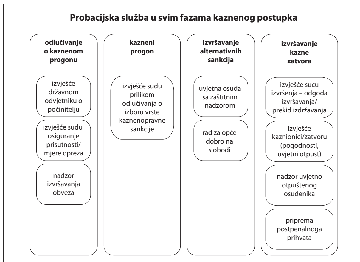
Sl. 1. Probacijska služba u svim fazama kaznenog postupka

informacija, a između ostalog i podatke o stavu žrtve i počinitelja prema kaznenom djelu, procjenu kriminogenih rizika i tretmanskim potreba te mišljenje o mogućoj primjeni mjera opreza.