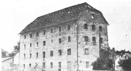
Sl. 3 Posljednja fotografija nekadašnje svilane, pred rušenje 1954. godine