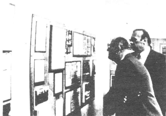
Otvorenje postava