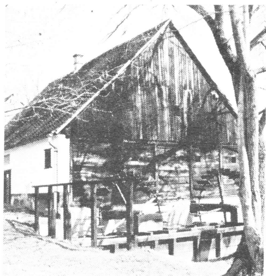
Vidović mlin – jugozapadna strana

grednik. S druge strane nalaze se dva mlinska postrojenja, a s lijeve su tri prostorije, od kojih svaka ima zaseban ulaz. Prva prostorija s lijeve strane je soba ili »hiža« u kojoj je nekada živjela obitelj Vidović, a sada je uređena kao spomen-soba. Namještena je