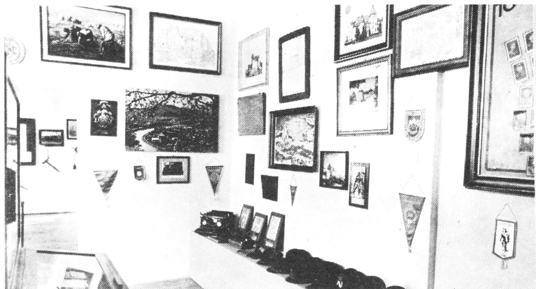
Snimak iz postava zbirke

gasili su požare i izvan Varaždina. Vatrogasci su bili prisutni i kod svih javnih priredbi u Kazalištu pa su za to izradili i posebna pravila.