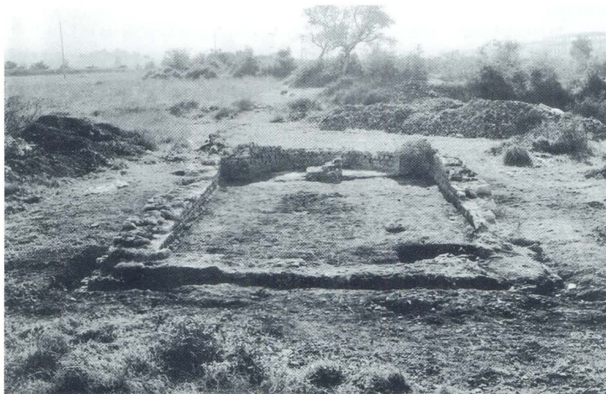
Pogled na crkvu sv. Marine

S jedne strane literarni izvori koji se odnose na prijenos relikvija i kulta sv. Marine u Veneciju identificiraju ovu s Marinom (Marin-redovnik), dok s druge strane neka svjedočanstva kulta, u prvom redu relikvije sv. Marine (danas Museo Correr u Veneciji) iz 13. st., znači blizu vremena prijenosa relikvija, nedvojbeno dokazuju da se radi o Marini mučenici, kako kaže J. M. Sauget. 27