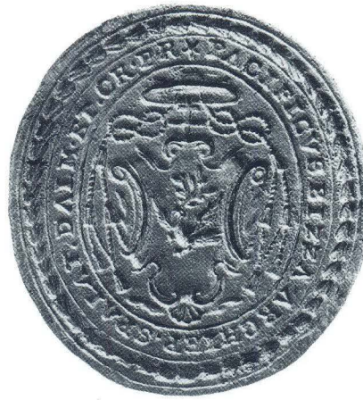
Pečatnjak splitskog nadbiskupa Pacifika Bize

1767, sačuvan je u dvije inačice. Jedna je s papirićem prevučenim preko voska, 11 dok je druga izrađena direktnim utiskivanjem u crveni pečatni vosak. 12