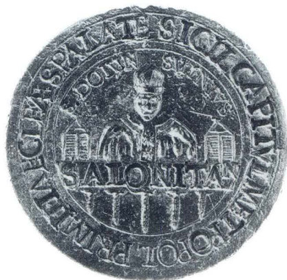
Pečatnjak splitskog kaptola iz Arheološkog muzeja

U niz objavljenih pečata spadaju tri kaptolska čije je vremensko određenje relativno široko. Prvi je veliki pečatnjak s istim natpisom i prikazom kao na onom koji je objavio Carrara, ali je očito mlađi od njega. Loše je izrade, puknut je i nedostaje mu jedan dio. 13 Drugi je mali pečat s natpisom: * SIGIL. CAPITVL. METROPOL. ECCLES. SPALAT, sa strana sv. Dujma: SDOM NIVS, a na gredi: SALONITAN. I njega je donio Carrara. 14 Oba pečata nastala su prije 1828. jer je te godine bulom "Locum Beati Petri" ukinuta splitska metropolija, a nadbiskupija svedena na biskupiju. 15 Treći je sigurno najmlađi i nastao je nakon 1828. Na njemu je natpis: CATHEDRALE CAPITULUM ECCLESIAE SPALATENSIS, a uz sv. Dujma: SDO MNIVS. 16