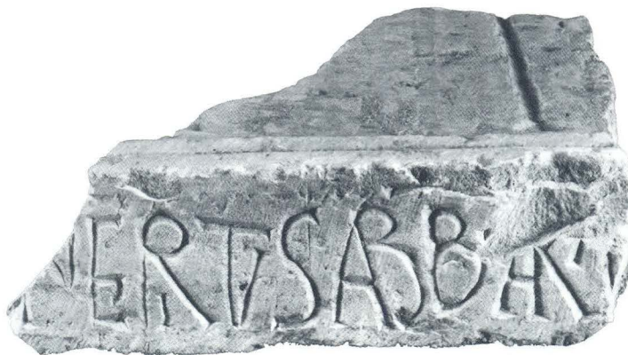
Dio oltarne menze s natpisom iz crkve sv. Martina u Lepurima (7)

od dva do tri grafema kojima se ne može točno utvrditi oblik zbog oštećenja kamena u gornjim dijelovima slova. Neoštećene, međutim, donje haste sugeriraju ligaturu slova a i r sa sačuvanim znakom pokrate. Mogućnost da ista slova u nastavku indiciraju opatovo ime, možda Martinus , može se tek naslutiti na temelju škratih epigrafičkih tragova. Zamjetno korištenje spomenutih ligatura i pokrata u odnosnim epigrafičkim fragmentima upravo je znak da je natpis, u postupku njegova transponiranja s pisanog predloška u kamen oltarne mense, prethodno ordiniran na zadanoj natpisnoj plohi, što ostavlja dojam promišljeno sročena teksta i vještije zanatske izvedbe.