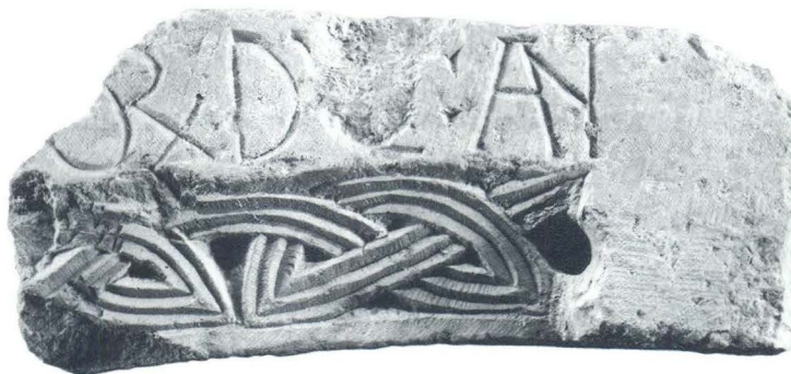
Dio cibonija (?) iz sv. Martina u Lepurima (3)

slova u natpisu, što govori u prilog njihovoj istovremenosti, štoviše pripadnosti istoj funkcionalnoj i tipološkoj cjelini. Na jednom od ulomaka (sl. 2) jasno se čita [...t (c?)]E IN DECORE D[...], odnoseći se zacijelo na ures ( decus, -oris, n. ) kojim je crkva opremljena. Natpis na drugom fragmentu (sl. 3) tekstovno je krnj uslijed oštećenja u sredini natpisne plohe pod kojim se tekst tek nejasno razaznaje. Prateći duktus sačuvanih grafijskih ostataka na rubovima oštećenja, iza slova d nazrijevamo grafemsku skupinu ux , pretpostavljajući da krnji grafemi na otučenom dijelu teksta izvorno čine slova riječi dux (= vojvoda, knez), tj. uobičajeni i najčešći latinski naslov hrvatskih vladara u ranom srednjem vijeku (9.-11. st.), dok dočetak prethodne skupine ... OR(um) ... razrješujemo kao suspenziju riječi u etnonimu [ Chroat ] OR(um) . Prema tomu, prikazani dio natpisa hipotetički razrješujemo sintagmom [... Chroat ] OR(um) D[ux] A(me) N . Takva