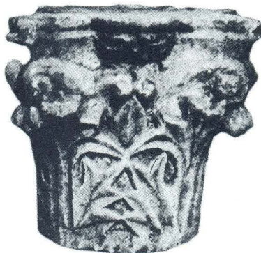
Kapitel iz crkve sv. Martina u Lepurima (11)

međutim, većeg akantus kapitela (sl. 11), s ornamentalnim oblikovanjem donjeg trupa svojstvenim stilu kasnoantičke arhitektonske skulpture 5. - 6. st. 20 , također upozorava i na neki raniji, možda starokršćanski objekt na tom položaju koji bi prethodio predromaničkoj graditeljskoj fazi. No, ispravnost potonjih naslućivanja moguće je provjeriti samo provođenjem arheoloških iskopavanja na lokalitetu.