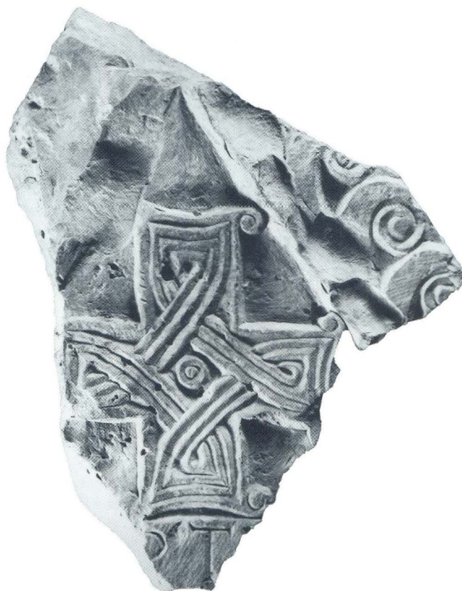
Dio zabata iz crkve sv. Martina u Lepurima (1)

stilsku razradu kao zabat s natpisom ...pastor o... koji se danas čuva u splitskom Arheološkom muzeju, pobliže neutvrđena podrijetla, vjerojatno iz Splita. 37 Općim likovnim rukopisom, ali i u detalju raspoznatljivom u oblikovanju središnjeg križa s akcentiranim okulusom, ili, pak, u istaknutim voluticama na krakovima križa lepurski ulomak u potpunosti odgovara splitskom primjeru.