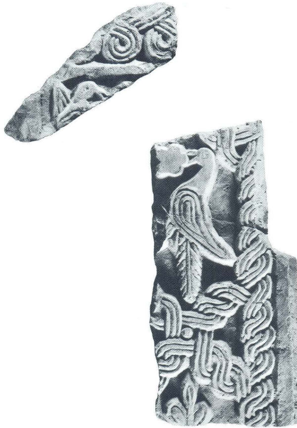
Ulomci pluteja iz crkve sv. Martina u Lepurima (9,8)

pluteja, premda likovni elementi sugeriraju obje mogućnosti. Likovno rješenje najvećeg sačuvanog dijela pluteja (sl. 8) i jednog manjeg ulomka gornjeg rubnog pojasa (letve) pluteja monolitnog s pločom (sl. 9) (dim. 34 x 11 x 14 cm) što nosi ostatak prikaza ptičje glave, govore da se radi o prilično razrađenoj dekorativnoj kompoziciji gdje se u standardnu, troprutu geometrijsku osnovu unose simbolični, liturgijski zoomorfni i florealni motivi, ili se sudeći po ukrasu troprute osmice prilazi motivskim varijacijama geometrijskog ornamenta. Podsjetimo na zamjetnu pojavu potonjeg motiva upravo na predromaničkim reljefima Splita i okolice (Putalj, Gradina) i kninskog Kapitula. 38