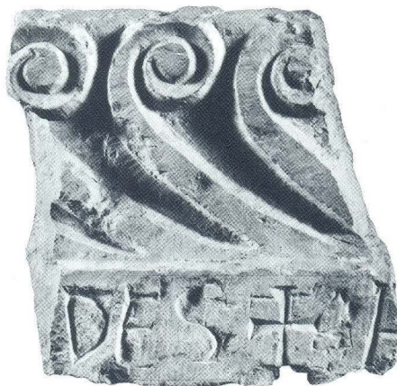
Ulomak arhitrava iz crkve sv. Martina u Lepurima (5)

Od više komada skulptiranog kamenog namještaja, za koje se sa sigurnošću može reći da su činili dijelove septuma pred crkvenim oltarom, prepoznatljiviji su elementi gornje i donje zone oltarne ograde, dok ostaci njezina središnjeg dijela s uobičajenim stupovima i kapitelima zasad nisu pronađeni. Iz donjega dijela septuma mogu se identificirati tri ulomka dekorirane ploče pluteja (sl. 8, 9, 10), manji dio pilastra (sl. 12), a od gornjih elemenata dio zabata (sl.1) i dva ulomka arhitrava (sl. 4, 5). Odnosni arhitravi javljaju se u dvije formalne inačice: u tropojasnoj i dvopojasnoj ukrasnoj shemi. Dvopojasni arhitrav (sl. 5) (dim. 20 x 21 x 10 cm), premda isklesan od iste vrste lokalnog kamena, odudara užim stilskim tretmanom od ostalih elemenata trabeacije. Može se tumačiti