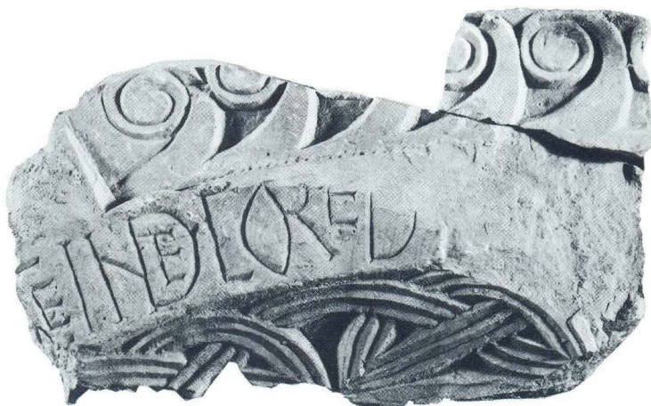
Dio ciborija (?) iz crkve sv. Martina u Lepurima (2)

opreme: arhitravima, zabatima, ciboriju(?!), jest svakako ornament kukâ. Niskih, punih i glatkih drški te naglašene volute, kvalitetan su klesarski rad istovjetan obradi kukâ na trabeaciji predromaničke bazilike na Stupovima u Biskupiji 32 i crkvi u Otresu kod Bribira 33 te gredi s dedikacijskim natpisom donatorice