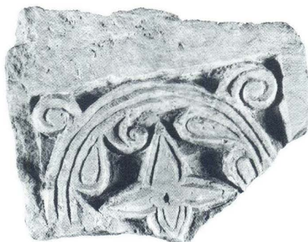
Ulomak pilastra iz crkve sv. Martina u Lepurima (12)

U takav motivski repertoar spada i manji ulomak, preostao od donjeg dijela kamenog pilastra, bez izvorno sačuvane debljine, s dijelom klina za usađivanje na stipes oltarne ograde (sl. 12) (dim. 28 x 22,5 x 7,5 cm). Na njemu je ukras troprute kružnice s lisnatim unutarnjim izdancima i četverolatičnim cvijetom u sredini, te po jednom zavojnicom u praznim ugaonim poljima na vanjskoj strani kružnice. Zasebno promatran, motiv je u osnovi derivat florealne sheme kakva se susreće na plutejima predromaničkih crkava u kninskom kraju: na Kapitulu 43 , Violi-Vrpolju i Plavnu 44 , ili pak reljefima Splita. 45 Izuzevši splitske analogije, svi spomenuti primjeri s hrvatskog prostora u zaleđu datirani su reljefima Trpimirova doba iz Rižinica, odnosno kapitulskom skulpturom prve faze, iz sredine i početak 2. pol. 9. st. 46 Obrada, čak, cvjetnog ornamenta na ostatku pilastra iz Lepura, kao sitan detalj u ukupnoj kompoziciji, nalik je stilizaciji istovrsnog motiva na predromaničkim reljefima Splita (zabat s natpisom ...pastor o... i plutej s pticom), prije spomenutih u kontekstu njihove podudarnosti s likovnim oblikovanjem pluteja i zabata iz Lepura. 47