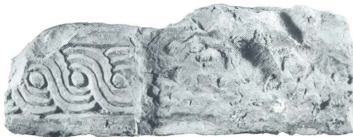
Dio dovratnika (pilastra?) iz crkve sv. Martina u Lepurima (13)

Uglavnom su to ulomci liturgijsko-dekorativnih obilježja koji očituju jasna stilska rješenja. Motivi i ukrasne kompozicije kojima su providene njihove kamene plohe, makar i fragmentarno očuvane u odnosu na izvorni izgled cjeline, dobro su poznati u klasičnom repertoaru predromaničke skulpture i epigrafike