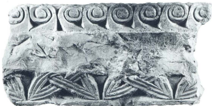
Ulomak arhitrava iz crkve sv. Martina u Lepurima (4)

Ulomak druge kamene grede (sl. 4) (dim. 42 x 21 x 8 cm) pokazuje stilsku pripadnost grupi predromaničkih arhitrava kojima glavne odlike daje tropojasni dekorativni slog kuka u gornjem polju, niz neprekinutih troprutih petlji, tzv. pereca po sredini i natpisno polje u donjem pojasu. Iako se motiv pereca i natpisnog polja različito raspoređuje unutar dekorativne cjeline na lepurskom arhitravu, radi se tek o varijaciji na isti motivsko-kompozicijski predložak kakav očituju arhitravi unutar dvije prostorne grupe lokaliteta: Zadra i zadarskog zaleđa (Otres, Kula Atlagića, Nin), te Splita i srednjodalmatinskog zaleđa (Stupovi, Blizna, Muć Gornji). Sve poznate analogije donose rješenje s natpisnim poljem u donjem uzdužnom pojasu, što uz dijelove ansambla sa Stupova 26 ,