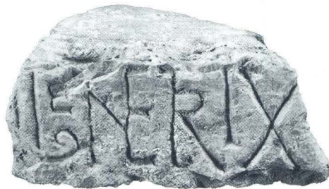
Dio oltarne menze s natpisom iz crkve sv. Martina u Lepurima (6)

danas dostupnim arhivskim vrelima, moglo bi se promišljati da spomen Bogorodice u predromanici u sklopu posvete crkvenog oltara, upućuje na ranosrednjovjekovni titular crkve ili otkriva jednog od više štovanih naslovnika. Smijemo li možda tu posvetu dovesti u vezu i s nekom od ranije postojećom tradicijom štovanja Marijine osobe ustanovljenom već u kasnoj antici, možda u krugu starijeg kršćanskog objekta na tom mjestu, o kojemu se zasad tek hipotetički razmišlja ili, pak, u njegovoj blizini, u arealu Asserija-Lepuri.