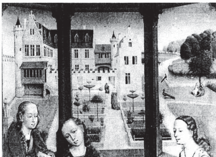
Slika 2. Hans Memling, 15. stoljeće

Talijanski renesansni vrt cvijeće ima u malom prostoru uz kuću: giardino segreto.