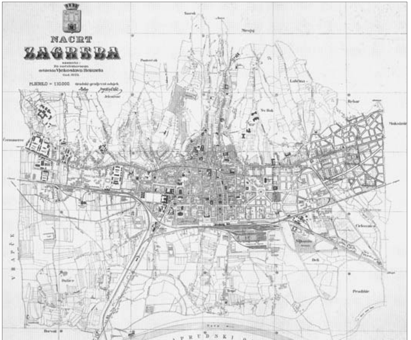
Sl. 1. Nacrt grada Zagreba (izvorno mjerilo 1:10 000), 1923. Fig. 1 Drawing of Zagreb (scale 1:10 000), 1923