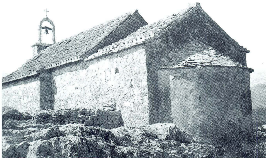
Crkva sv. Andrije na Čiovu

Sam naziv lokaliteta Balan upućuje na utvrđenje. Toponimi sa sufiksom an predslavenskog su podrijetla; česti su u neposrednoj okolici Trogira i Splita, za razliku, od obližnjeg Kaštelanskog polja gdje su slabiji tragovi predslavenskog toponomastičkog sloja. Naziv Balan blizak je imenu naselja Bale u Istri ( castrum Vallis ). 9 Srodan je toponimu Bol - lokalitetu u Splitskom polju (godine 1192. piše se a Ballo terra ) ili pak nazivu naselja Bol na Braču koji su, smatra se, u vezi s latinskom riječju vallum u značenju jarak, šanac. 10