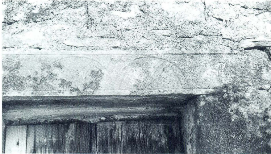
Kamena greda korištena za nadvratnik sjevernih vrata

Na sjevernoj strani starije jezgre crkve nad vratima u sekundarnoj upotrebi ugrađena je kamena greda duga 115 cm, visoka 22 cm, urešena motivom urezanih polukrugova unutar kojih su urezani šiljasti lukovi. Ovi unutrašnji oštri lukovi nastali su konstrukcijom polukrugova koji se međusobno presijecaju. Nadvratnik je već objavljen. 52 Moglo bi se pretpostaviti da je greda izvorno bila dio predoltarne pregrade.