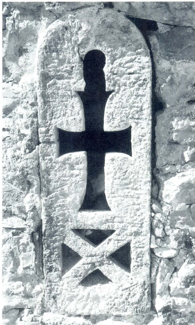
Tranzena na apsidi crkve sv. Andrije

Iako mogla puknuti, što se uostalom i dogodilo u gornjem dijelu. Prečke u obliku slova X nalaze se unutar dva kružna otvora kamene ploče prozorskog otvora što potječe iz crkve sv. Ciprijana u Splitu. 81 Dijagonale presijecaju i kružne otvore jedne tranzene na prozoru episkopija u Poreču. 82