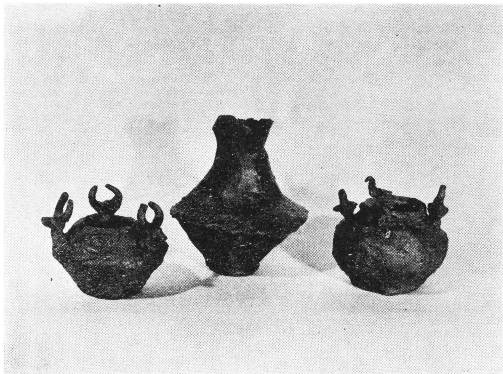
Sl. 2. — Keramičke posudice izrađene prema eksponatima izložbe

I još par riječi o jednoj drugoj vrsti suradnje ostvarene u vrijeme trajanja naše izložbe. Zajedno s nastavnicom likovnog odgoja o. š. »Božena Plazzeriano« organiziran je jedan oblik praktične nastave u našim izložbenim prostorima. Desetak zainteresiranih i talentiranih učenika ove škole provelo