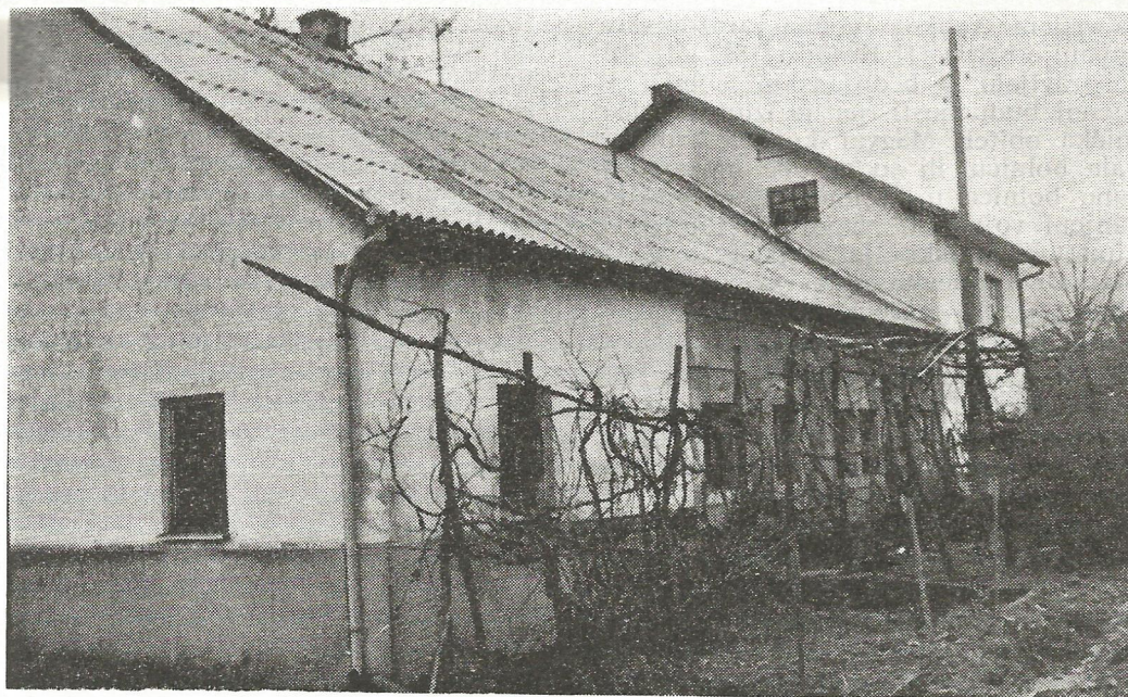
Sl. 1 — Sadašnji izgled zgrade u kojoj je 1890. osnovana bolnica »Saluti«. Južni dio zgrade je naknadno podignut na kat.

Uz bolnicu je postojala i ambulanta kamo su se mogli obraćati za pomoć okolni stanovnici. I ondje su imali besplatni pregled, lijekove i liječenja. U bolnicu se nisu primali oboljeli od zaraznih bolesti niti duševni bolesnici. Prema potrebi vršili su se i kirurški zahvati i kod hospitaliziranih i kod ambulantnih bolesnika. Bolnica je postojala do konca I. svjetskog rata odnosno do odlaska Erdödyja iz Novog Marofa nakon prodaje imanja. Zgrada je bolnice bila vlasništvo Erdödyja, a sagrađena je 1780. godine što se jasno vidjelo iz reljefnog natpisa na istočnoj strani zgrade. Ta kuća postoji i danas. Nalazi se uz početak ceste koja od benzinske stanice u Novom Marofu vodi prema Ljubeščici i Varaždinskim Toplicama. Južni je dio zgrade sada podignut na kat pri čemu je skinuta sa zida mramorna ploča na kojoj je pisalo »EX COGNITIONE SALUS MDCCCLXXXX«. Bolnica se zvala »Saluti« što je najvjerojatnije izvedenica iz riječi »salus« natpisa. Sjeverni je dio kuće i danas prizemnica. U zgradi bivše ambulante sada je gospodarska zgrada, a privatna kuća pokraj bolnice je ondašnja oružnička postaja. 1