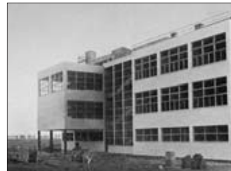
SL. 3. RGZ: PAVILJON TEHNOLOŠKO-VOCARSKIH ZAVODA POLJOPRIVREDNO-SUMARSKOG FAKULTETA, SVETOSIMUNSKA CESTA 25, 1933.-1934.

Trideset prijavljenih arhitekata 51 trebalo je objasniti svoj stručni rad od projektiranja do izvedbe, odnosno zahtjeve koje moraju ispu- niti s gledišta tehnike i ekonomije, higijene i pedagogije, ako žele suvremeno riješiti pro- blem stanovanja i gradnje uopće. Ako se ima- ju na umu gospodarske prilike, nakana iz- ložbe u potpunosti je razumljiva i opravdana, a radovi stoga nisu bili objedinjeni u temat- ske cjeline, već izloženi prema abecednom re- doslijedu izlagača. 52 Izostanak jasne, jedinst- vene ideologije svih izlagača, 53 programski utemeljenog koncepta i razilaženje u shva- canju osnovnih počela suvremenoga funkcio- nalnog i ekonomičnog građenja – bio je, me-