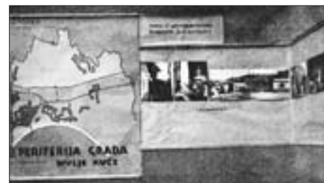
SL. 5. RGZ: IZLAGANJE „KUĆA I ŽIVOT”, IV. IZLOŽBA „ZEMLJE”, 1932.

Težište izlaganja Radne grupe Zagreb bio je upravo najveći urbanistički problem međuratnog Zagreba, surova stvarnost periferije napućene divljim kućama bez osnovnih higijenskih uvjeta, kategorija izgradnje koju grad prije Prvoga svjetskog rata gotovo i nije poznao. Strahote života u barakama i vagonima periferije, ali i onih podignutih u dvorištima donjogradskih blokova, te na njihovim tavanima i u podrumima, najzornije su predočile izložene fotografije Antituberkuloznoga di-