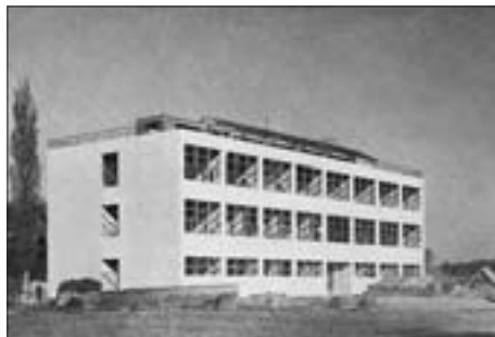
SL. 2. RGZ: PAVILJON TEHNOLOŠKO-VOĆARSKIH ZAVODA POLJOPRIVREDNO-SUMARSKOG FAKULTETA, SVETOSIMUNSKA CESTA 25, 1933.-1934.