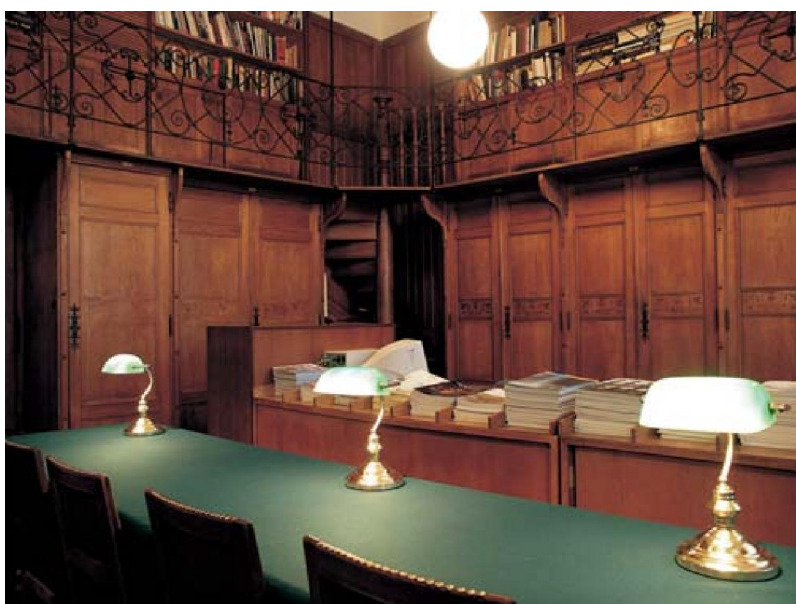
Slika 1. H. Bolle, Knjižnica Muzeja za umjetnost i obrt, snimljena 2005. kad je bila dio izložbe Skriveno blago

Knjižnice kao knjižne zbirke prenesene u novo institucionalno okruženje drugi su oblik knjižne baštine koju srećemo i kao takve velik su izazov za sve ustanove, pa i za muzeje. Prije svega, izazov su zbog svoje fizičke veličine. Smještamo li ih u prostor stalnog postava ili u čuvaonicu, stručne su odluke glede toga dodatno opterećene. Hrvatski školski muzej u Zagre-