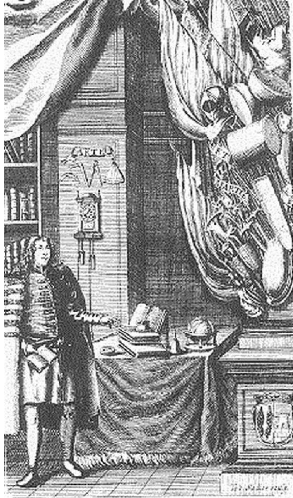
Slika 2. Ex-libris Adama Zrinskog, 17. st., prekrasnan primjer kasne uporabe renesansne teme Arte et marte , čuva se u HDA-u

Elementima nastalima zahvaljujući vanjskome (izvanknjižnom) djelovanju pripadaju različiti dodaci na knjizi i u njoj, koji su nastali zahvaljujući protoku vremena te imateljima i korisnicima kojima je knjiga prolazila kroz ruke. Pri tome mislimo na različite oblike oznaka, bilo da je riječ o signaturama ili o inventarnim brojevima. Nerijetko se događa da naiđemo na više takvih oznaka i identifikacijskih brojeva i njihovim odgonetavanjem možemo rekonstruirati zanimljiv život i put knjige. Toj grupi pripadaju i ex librisi kao posebne, katkad i umjetnički oblikovane oznake vlasništva. Njihovo otkrivanje, odgonetavanje i istraživanje pravo je kontekstualno i kulturno istraživanje. 5 (sl. 2.)