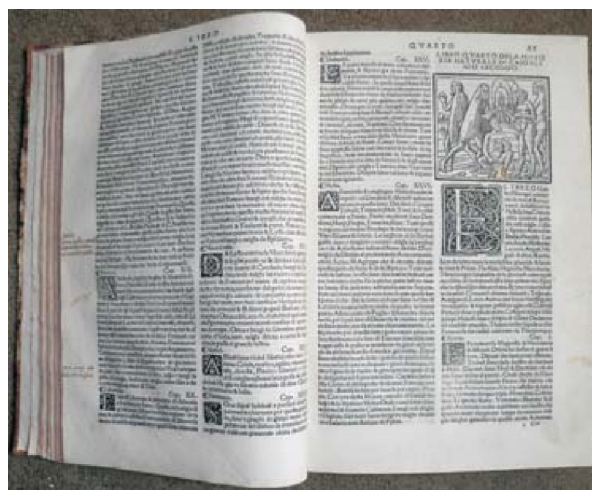
Slika 6. Caio Plinio Secondo, De la historia naturale... Venetia, 1534., foto Danka Radić

Građa Knjižnice Garagnin-Fanfogna raznovrsna je, pa su tako iz Knjižnice izdvojene i u glavnu inventarnu knjigu Muzeja grada Trogira i u M++ programu upisane grafike (ukupno 32 grafike, inv. br. MGT 377-385, 407-425, 447, 476, 1620, 1628). Napominjemo da je iz obiteljskog arhiva, koji je sačuvan kao dio Knjižnice Gara-