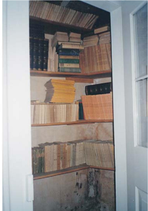
Slika 8. Knjižnica Lubin, foto Danka Radić

smo predstavili stare i rijetke knjige. Katalog izložbe bio je katalog knjiga koje smo do tada popisali. 29