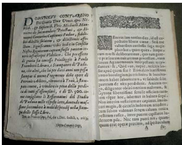
Slika 5. Petronii Arbitri fragmentum nuper Tragurij repertum, Padova, 1664.

Jednako tako, u stalni postav Muzeja grada Trogira izdvojene su i u njemu izložene pojedine knjige iz knjižnice Garagnin-Fanfogna koje nisu upisane u glavnu inventarnu knjigu Muzeja grada Trogira već samo u inventarnu knjigu Knjižnice Garagnin-Fanfogna, primjerice: