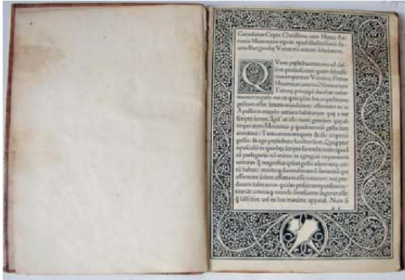
Slika 2. Koriolan Cipiko. Petri Mocenici imperatoris gestorum libri III., Venettis, 1477., foto: Danka Radić