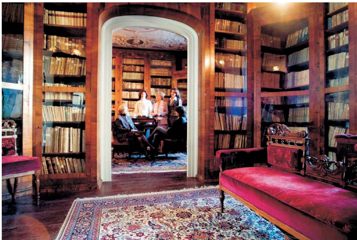
Slika 1. Knjižnica Garagnin-Fanfogna, foto: Ivo Pervan

te kao što su globus, planetarij, kompas, numizmatička zbirka itd., koji su izdvojeni iz knjižnice i inventarizirani, upisani u glavnu inventarnu knjigu Muzeja, a izloženi su u stalnom postavu Muzeja grada Trogira, u Zbirci novovjekovne kulturne povijesti. Napominjemo da je unutar knjižnice, u njezinu interijeru, u jednom ormaru (ormar XXIII.) sačuvana i prirodoslovna kolekcija.