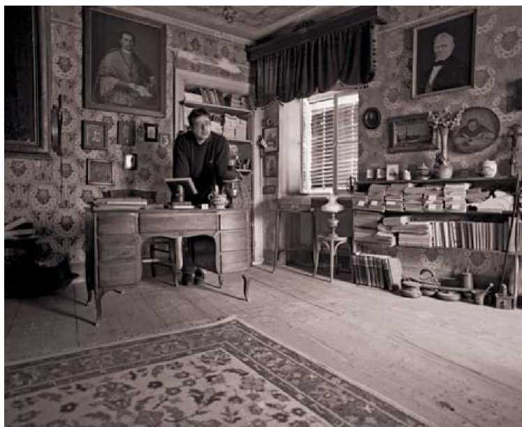
Slika 10. Knjižnica Slade-Šilović

g. 31 Knjige su upisane u inventarnu knjigu knjižnice Marka Perojevića (Muzeja grada Trogira). Izložene su u ormaru nekadašnje blagovaonice – danas uredu kustosa, a dostupne su i javnosti.