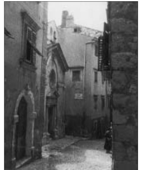
SL. 9. ULICA CALLE SAN SEBASTIANO, DANAS NJA ULICA MARKA MARULICA, S LIJEVE JE STRANE CRKVA SV. SEBASTIJANA

Regulacijski plan Staroga grada iz 1934. godine ipak nije rezultirao rušenjem kuća, niti je realiziran. Prekinuo ga je Drugi svjetski rat. Najveće rušenje kuće na Gomili zbilo se od kraja Drugoga svjetskog rata pa do kraja 50-ih godina 20. stoljeća. Godine 1957. izrađen je