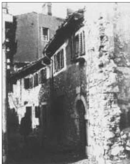
SL. 8. STAMBENE KUĆE U ULICI CALLE DEL FORTINO NEPOSREDNO NAKON II. SVJETSKOG RATA FIG. 8 RESIDENTIAL BUILDINGS IN CALLE DEL FORTINO AFTER WORLD WAR II

meričkih relacija određenim matematičkim zakonima.