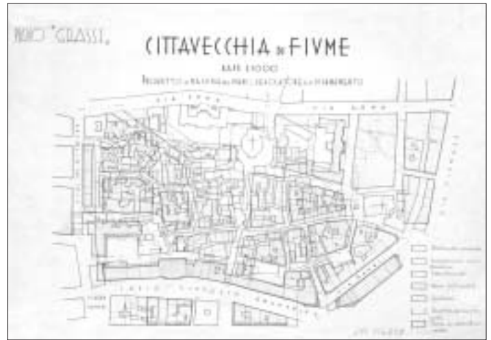
SL. 3. PAOLO GRASSI: PLAN STAROGA GRADA U SKLOPU REGULACIJSKOG PLANA SANACIJE, 1934. FIG. 3. PAOLO GRASSI: OLD TOWN IN A REHABILITATION PLAN, 1934

rubovima bilo još dosta slobodna prostora. Svatko tko se bavio trgovinom ili obrtom, nastojao je da bude što bliže obali, da smanji udaljenost između lade i svog magazina, uopće da što neposrednije sudjeluje u životu svog grada koji se odvija tu uz obalu, a ne na brijegu u zamku. 4