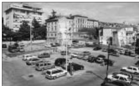
FIG. 13 GOMILA, 2002

Plan uređenja Staroga grada 17 autora Zdenka Sile i Zdenka Kolacija, u sklopu kojega su definirani spomenici: postojeća izgradnja, nova izgradnja, dvorišta i vrtovi, javno zelenilo, pješački promet i promet vozila. U sklopu toga plana razmišljalo se naročito o problemu Gomile. Dok je ostali dio grada ostao u svojim postojećim gabaritima, na Gomili su planirane velike promjene i potpuno nova izgradnja. Osim već porušenih objekata predviđeno je i rušenje niza kuća prema Supilovoj ulici, što bi omogućilo da se prostor Staroga grada otvori prema zapadu. Planirano je i rušenje kuća u današnjoj Ulici Slogin kula da bi se otvorio prolaz prema Ulici žrtava fašizma, te rušenje kuća u Ulici Šime Ljubica, što bi od Gomile stvorilo potpuno otvoren prostor, planiran u duhu tadašnje moderne. U toj namjeri planirana je rijetka izgradnja s puno zelenila i pješačkim ulicama, ali i prometom vozila. U središnjem dijelu bila je predviđena izgradnja nebodera i dogradnja zgrade Vojne policije s njene istočne strane. Taj plan nije nikada realiziran, tek je 1962. godine na Gomili izgrađena zgrada Socijalnog osiguranja.