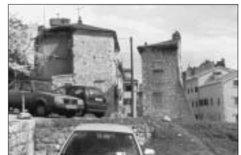
FIG. 7 GOMILA, DEMOLISHED STREET CALLE DEL BARBACANE, 2002

SL 7. GOMILA, PORUŠENA ULICA CALLE DEL BARBACANE, 2002.