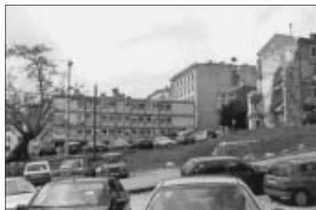
SL. 12. GOMILA, ZGRADA SOCIJALNOG OSIGURANJA, 2002.

FIG. 11 IGOR EMILI: ATTACHMENT TO THE REHABILITATION PLAN OF OLD TOWN, 1967-1971, RUINS IN 1955