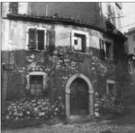
SL. 4. STAMBENA KUĆA U ULICI CALLE DEL FORTINO NEPOSREDNO NAKON II. SVJETSKOG RATA FIG. 4 RESIDENTIAL BUILDING IN CALLE DEL FORTINO AFTER WORLD WAR II

Na katastarskom planu Rijeke Ignazija Rossija iz 1841./42. godinu možemo na Gomili primijetiti istu urbanu strukturu kuća kao i na prijašnjem planu iz 1766. godine. Na tom su planu ucrtani i vrtovi koji su pripadali postojećim kućama. Tu se već mogu uočiti i nazivi ulica, npr.: Contrada della Polveriera , Contrada dei Pescatori , Contrada Nuova , Contrada dei cinque Vicoli , Contrada S. Sebastiano . Iz ovih naziva možemo uočiti da su se u prvoj polovici 19. stoljeća ulice u Starom gradu, pa i na Gomili, nazivale contrade . Na istom katastarskom planu, na sjeveroistočnom dijelu Gomile sa zapadne strane kaštela ucrtana je pogrebna kapela ( capella mortuaria ) s trgovom smještenim na svojoj južnoj strani. Ova je kapela pripadala sklopu riječkoga feudalnog kaštela koji je u doba gradnje kapele 1836. godine bio Vojna bolnica. S južne strane kaštela još su se uvijek nalazili vrtovi. Nešto južnije nalazio se Trg sv. Mihovila, ali bez istoimene crkvice jer je ona porušena 1833. Ucrtana je crkva sv. Fabijana i Sebastijana, koja postoji i danas i nalazi se u istoimenoj ulici. Crkva sv. Mihovila bila je također omanja jednobrodna crkva za koju Kobler piše da je imala glavno pročelje okrenuto prema zapadu, na