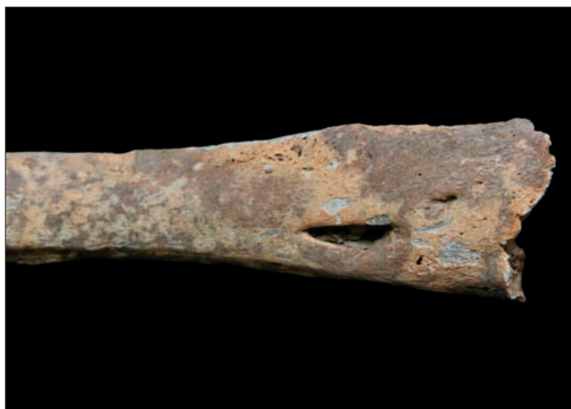
Sl. 7 Povećanje sternalnog kraja praćeno apscesom na unutrašnjoj strani osmoga lijevog rebra

In addition to the parts of the skeleton that were directly exposed to tuberculosis, changes were also documented that were indirectly caused by the presence of tuberculosis in this person. These changes are reflected in the deformed shape of almost all the ribs, especially on the left side, which