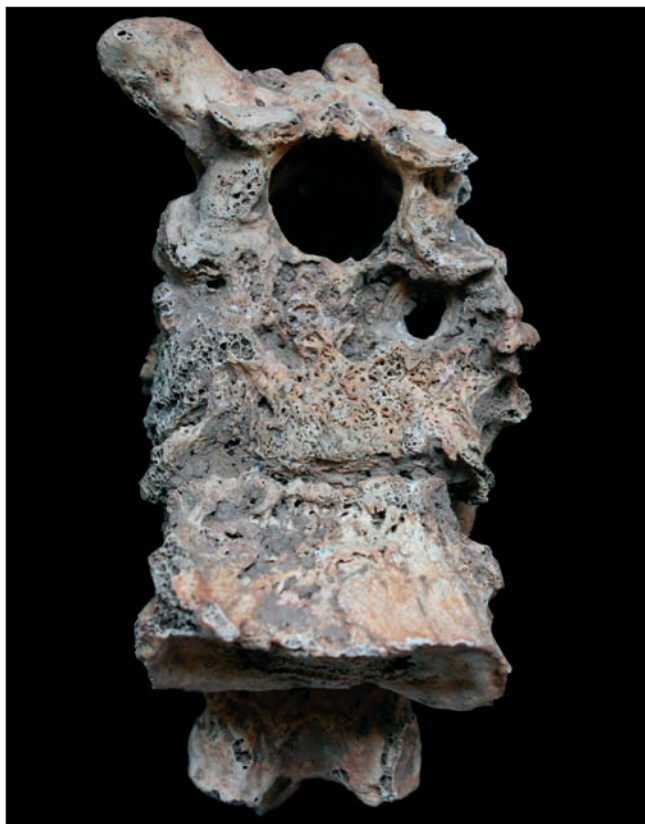
Sl. 6 Zarasli upalni proces praćen porozitetom na anteriornoj strani tijela drugoga slabinskog kralješka