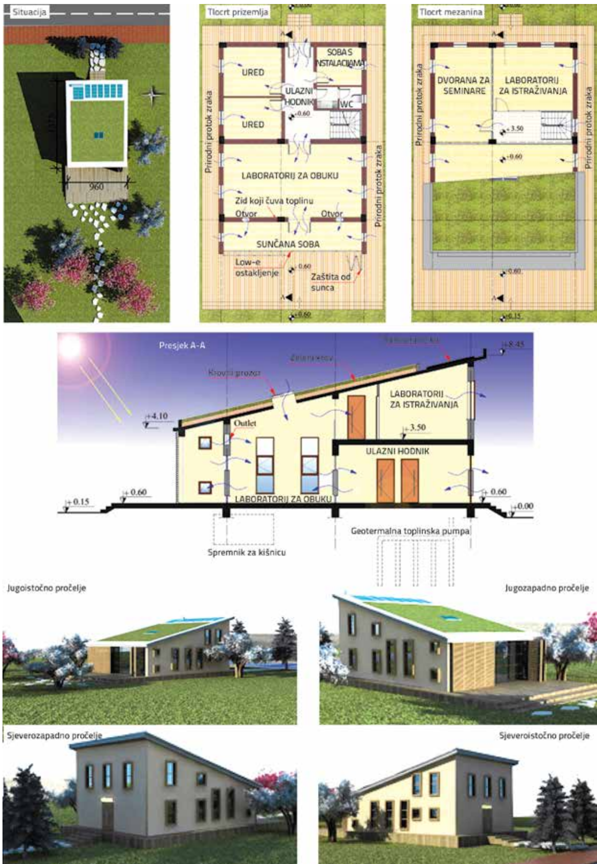
Slika 3. Idejni projekt Laboratorija za ekološka istraživanja i obuku Sveučilišta u Gazi (GUERTL)