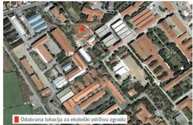
Slika 2. Satelitska snimka središnjeg kampusa Sveučilišta u Gazi [27]

Središnji kampus Sveučilišta u Gazi nalazi se u okrugu Yenimahalle grada Ankare. Na satelitskoj snimci na slici 2. crveno je označen neiskorišten, nefunkcionalan i zapostavljen prostor bez zelenih površina iza radionice Odjela za građevinarstvo Tehnološkog fakulteta Sveučilišta u Gazi na središnjem kampusu tog sveučilišta. Navedena lokacija je odabrana za primjenu ekološkog projektiranja zgrada, a odluka je temeljena na fizičkim uvjetima okoliša na tom području.