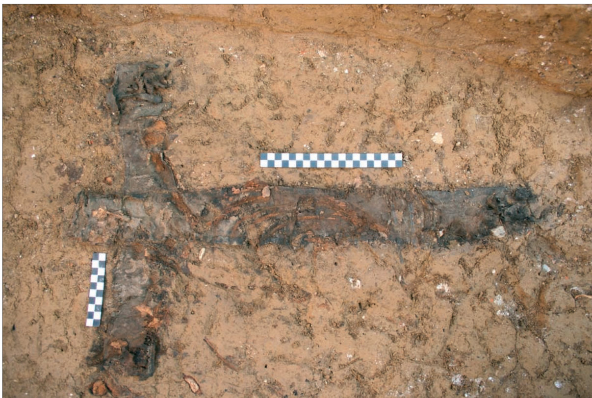
Sl. 4 Tkanina u obliku našivenog križa PN 167 ispod kostura G 497.

Fig. 4 Textile with a sewn-on cross SF 167 below skeleton G 497.