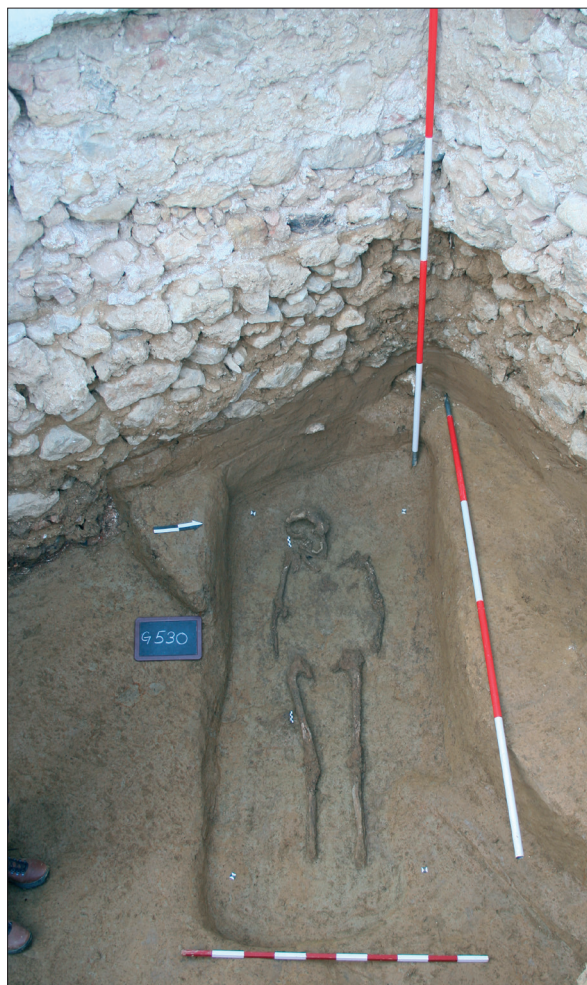
Sl. 2 Grob muškarca starog 30 do 35 godina – G 530, s označenim pozicijama srebrnog prstena (PN 193) i karičice (PN 194).

Čini se da će se na osnovi ukupnih rezultata istraživanja groblja oko crkve sv. Lovre u konačnici dobiti slična slika i za