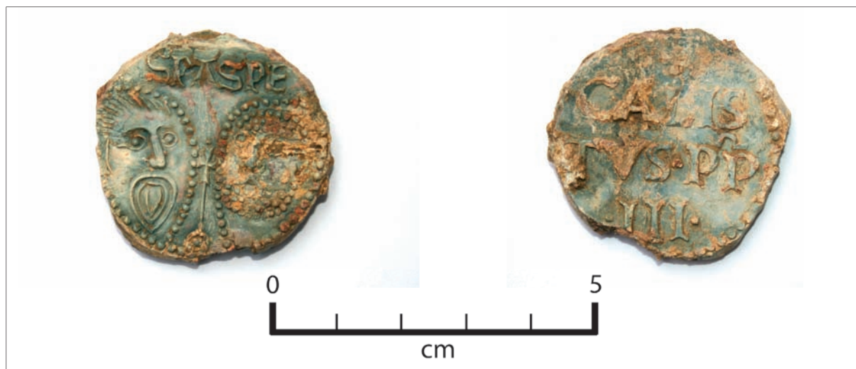
Sl. 5 Olovna bula pape Callistusa III. (Callixtus, Calistus) (1455. – 1458.) PN 200 iz groba žene G 541.

Fig. 4 Textile with a sewn-on cross SF 167 below skeleton G 497.