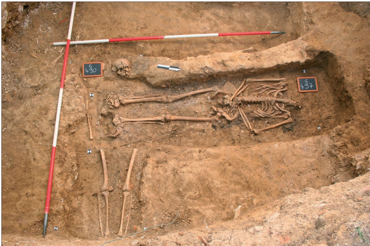
Sl. 3 Grobovi G 490 (lijevo) i G 497 (desno).

Ovu sakralnu građevinu s njezinih nekoliko srednjovjekovnih graditeljskih faza te zadnjom novovjekovnom, koja se, čini se, kroz srednji vijek može vezati i uz aktivnosti Nikole Konta Orahovičkog (Iločkog) i daljnjih članova velikaške obitelji Iločkih, Nikole i njegova sina Lovre, valja sagledati i u kon-