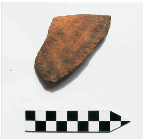
Sl. 5 Slavonski Brod, Galovo, ulomak zdjele slikane linearnim motivima.