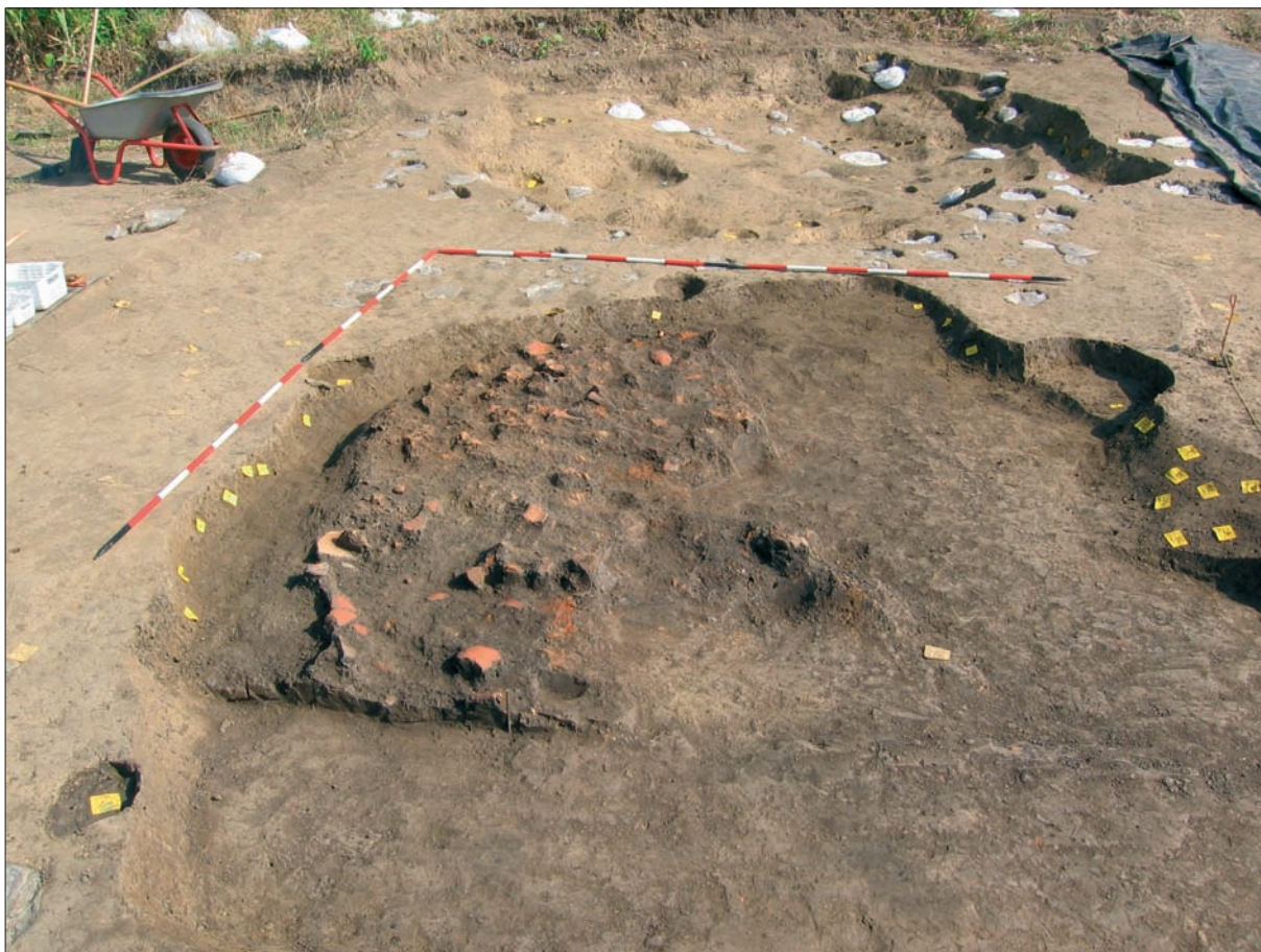
Sl. 3 Slavonski Brod, Galovo, grobna jama 2012/2013, zapadni prostor u jami iznad kostura prekriven ulomcima keramike.