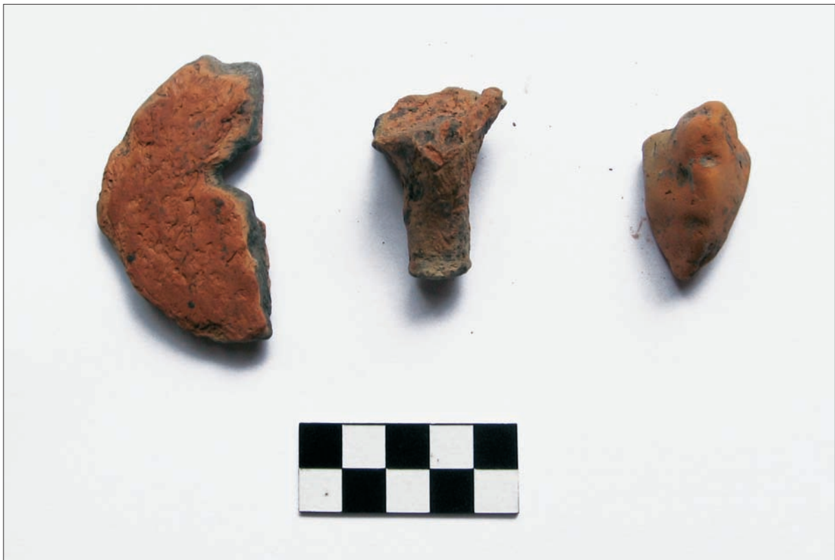
Sl. 6 Slavonski Brod, Galovo, dio priloga uz pokojnika.