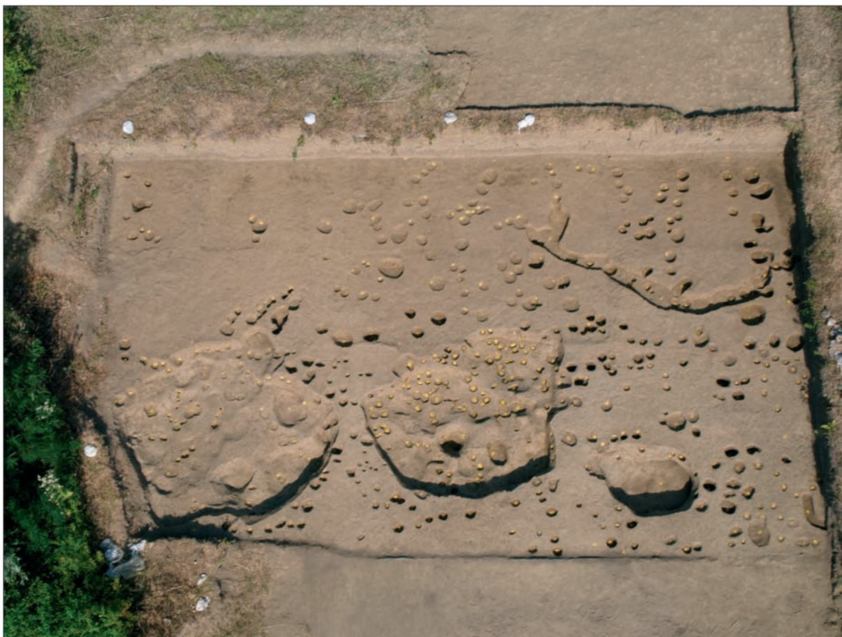
Sl. 1 Slavonki Brod, Galovo, istraženi teren 2012. godine.