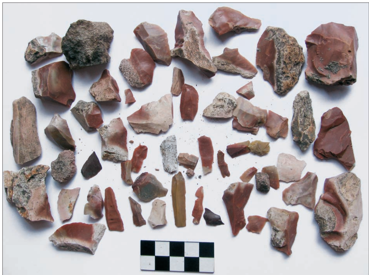
Sl. 7 Slavonski Brod, Galovo, dio kamenih izrađevina s kojima je pokojnik bio prekriven.