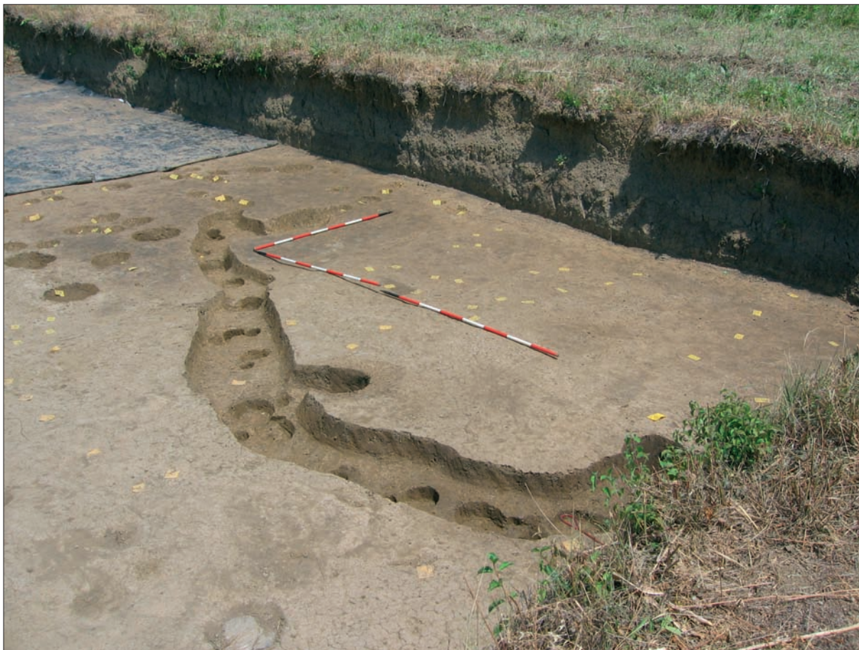
Sl. 4 Slavonski Brod, Galovo, jarak s rupama od stupova polukružne ograde 2194/2195.