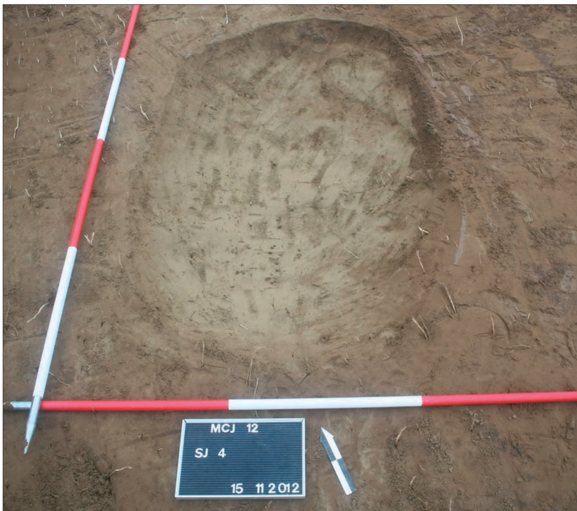
Sl. 2 Jama SJ 4.

Nalazište u Medincima uklapa se u sliku gusto naseljenoga slatinskog područja, osobito tijekom kasnoga brončanog doba i kasnoga srednjeg vijeka, što su potvrdila novija istraživanja prilikom izgradnje slatinske zaobilaznice tijekom 2009. i 2010. godine. Tada su istražena naselja Slatina Bobovište i Slatina – Veliko polje – Trnovača (Martinov 2010; Filipović 2010). Uz prije poznata naselja u okolici Medinaca (Ložnjak Dizdar 2005) i Novoj Bukovici (Kovačević 2001), istražena i novootkrivena naselja nude dobar uzorak za proučavanje modela naseljenosti na jednom mikrotopografskom prostoru, u ovom slučaju slatinske Podravine, u kasnom brončanom dobu.