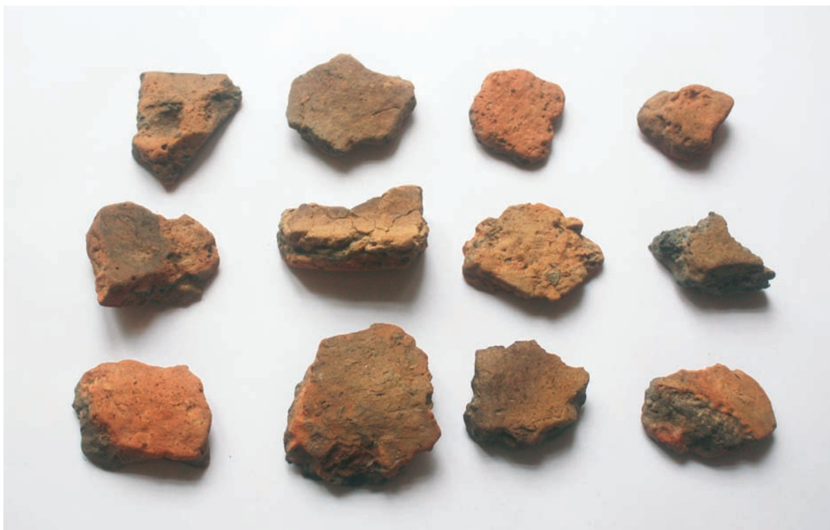
Sl. 3 Nalazi iz jame SJ 4.