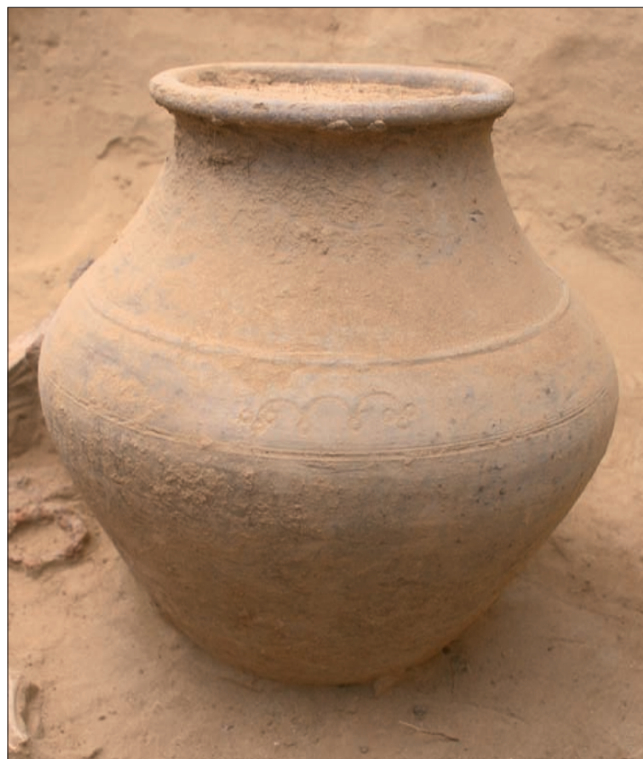
Sl. 6 Grob LT 96 – lonac ukrašen motivom koncentričnih kružnica. Fig. 6 Grave LT 96 – pot decorated with concentric circles.