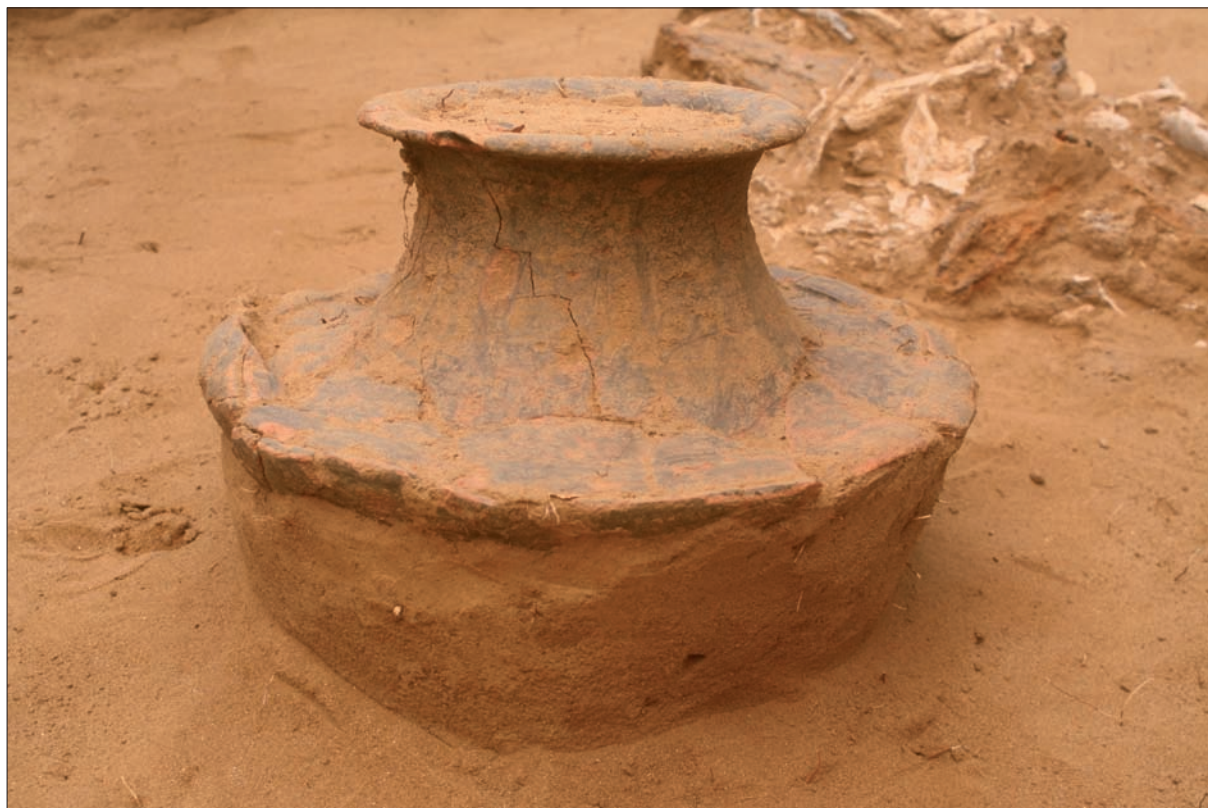
Sl. 3 Grob LT 95 – lonac.

Istraživanja provedena 2012. godine na središnjem dijelu uzvisine potvrdila su dosadašnje spoznaje iz istraživanja 1998. i 2011. godine kako je riječ o dijelu groblja s iznimnim brojem grobova latenske kulture. Preliminarna tipološko-kronološka