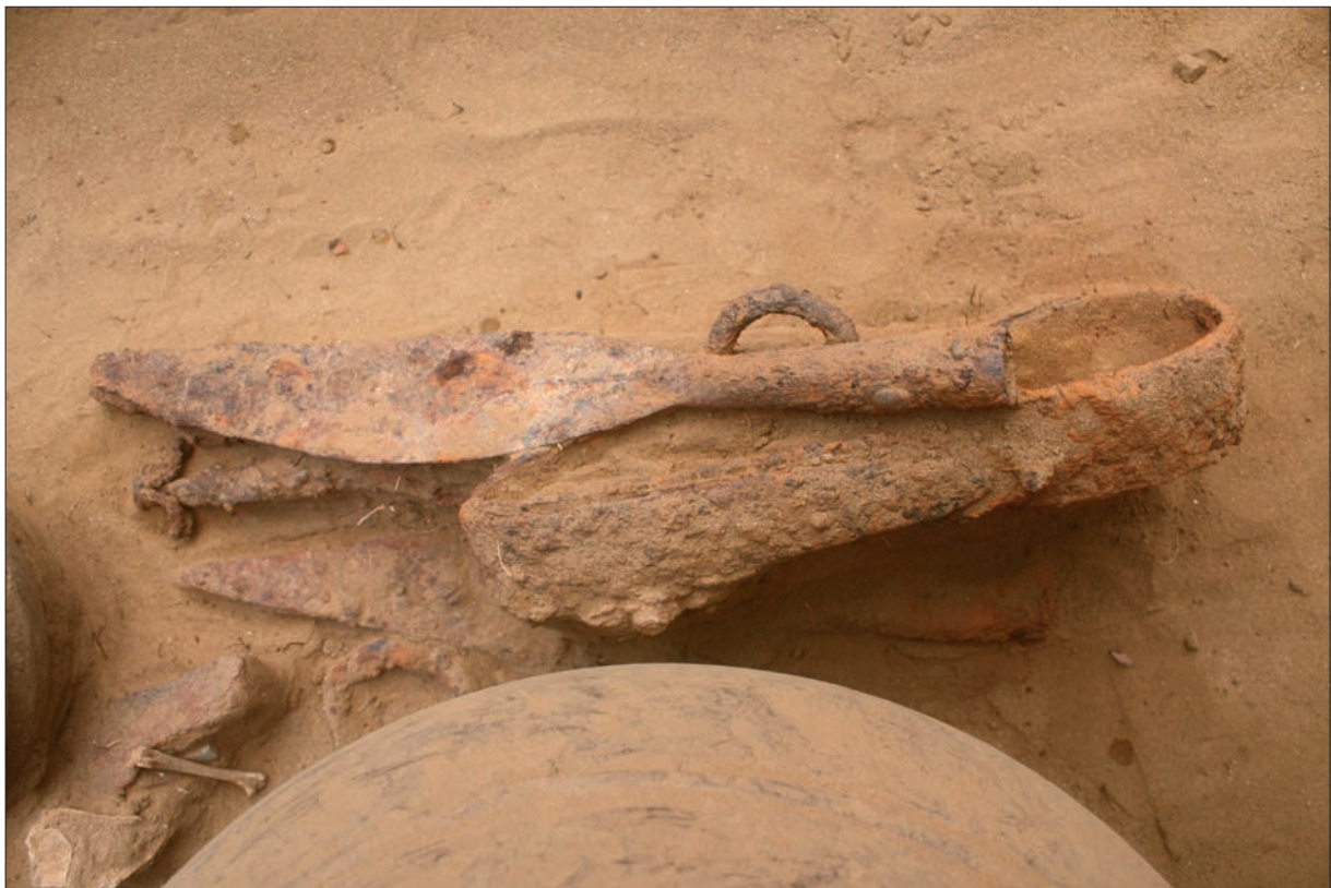
Sl. 5 Grob LT 96 – savijeni mač u koricama, dva koplja i obruči pojasne garniture. Fig. 5 Grave LT 96 – bent sword in a scabbard, two spears and rings from a belt set.