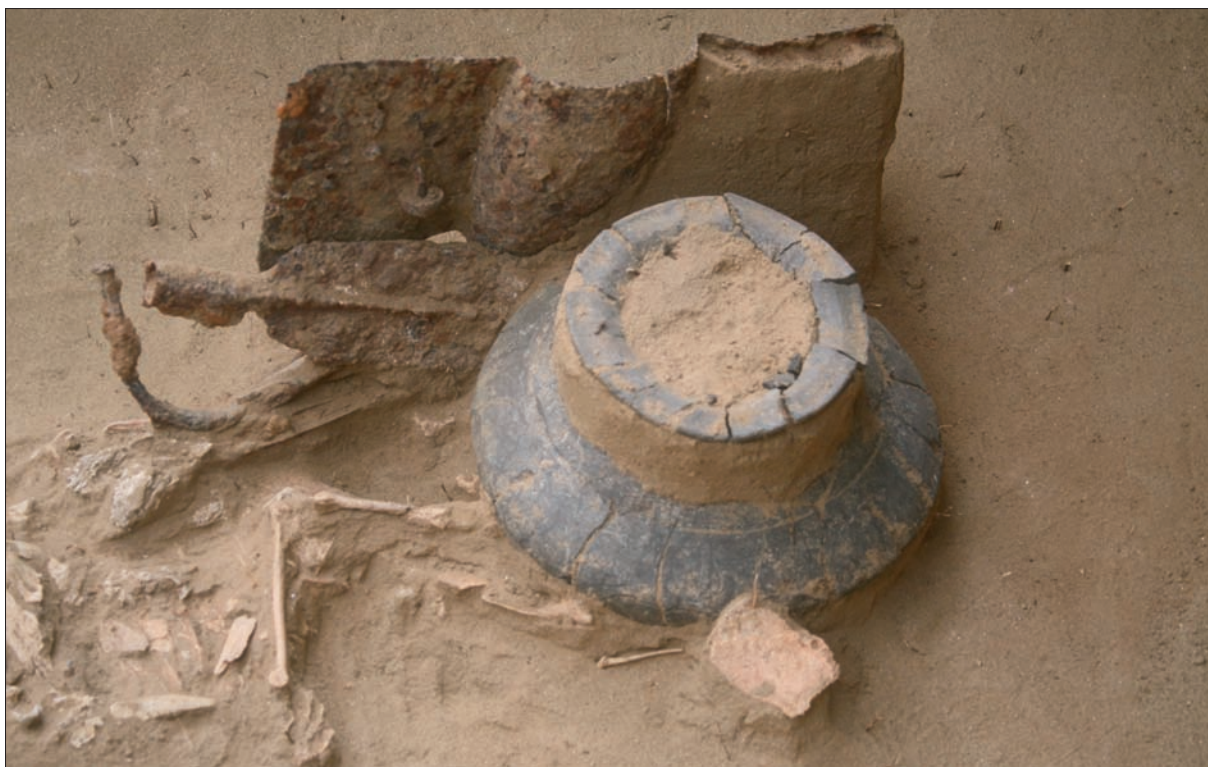
Sl. 7 Grob LT 97 – spaljeni ostaci pokojnika s loncem, savijenim mačem u koricama, kopljem i umbom.