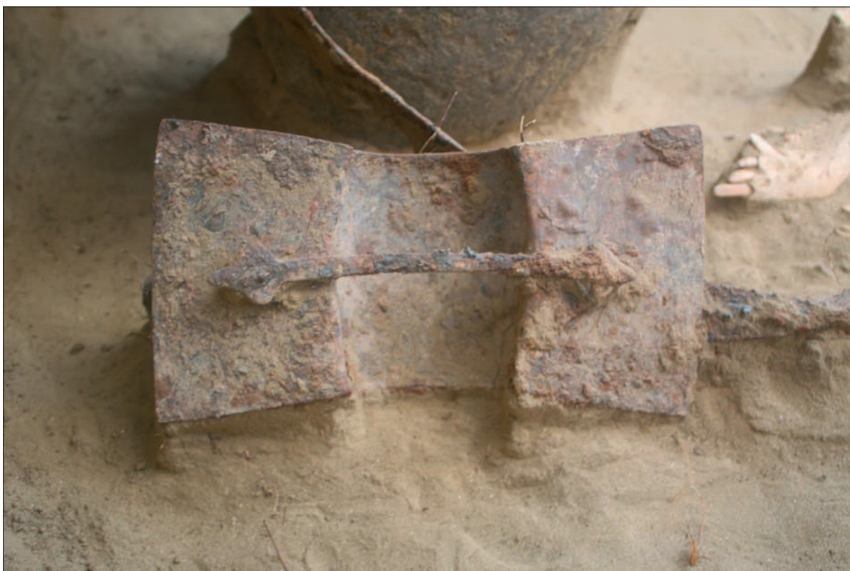
Sl. 2 Grob LT 94 – umbo s okovom ručke štita.