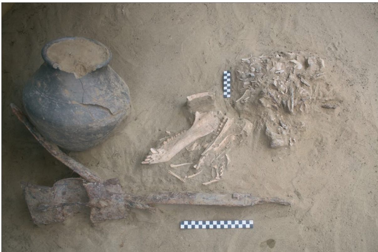
Sl. 1 Grob LT 94 (snimio: M. Vojtek).