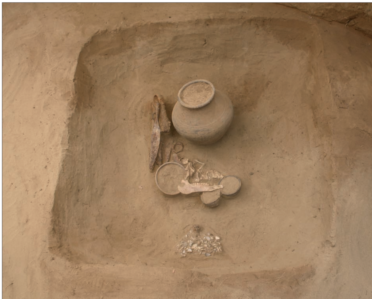
Sl. 4 Grob LT 96.